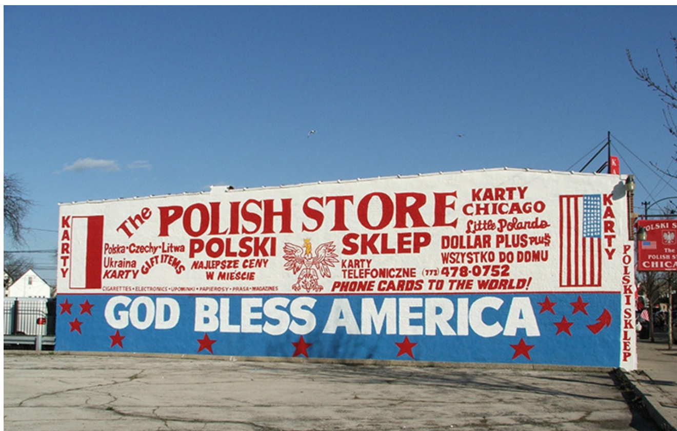
Chicago, fot. A. Lizakowski

Przeżycia osobiste opisanych przez nas osób, wybitnych Polaków w pewnym