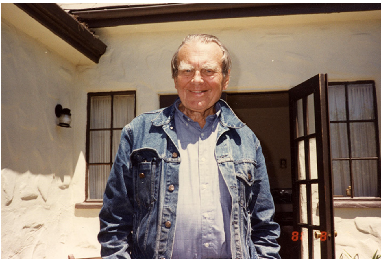
Czesław Miłosz w Berkeley