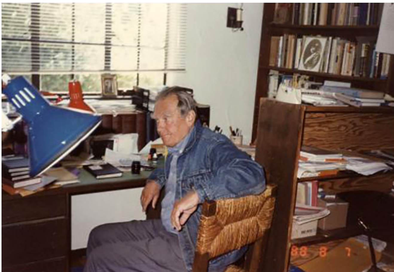
Czesław Miłosz przy swoim biurku w Berkeley

opisywanie językiem i okiem Polaka, bo przeważnie wyjeżdżał z rodziną lub przyjaciółmi, z którymi rozmawiał tylko i wyłącznie po polsku. Trzeba dodać, że więcej wiedział od Amerykanów o miejscach, które odwiedzał, albo w szczególności sposób upodobał sobie, ale ta wiedza nie czyniła go Amerykaninem.