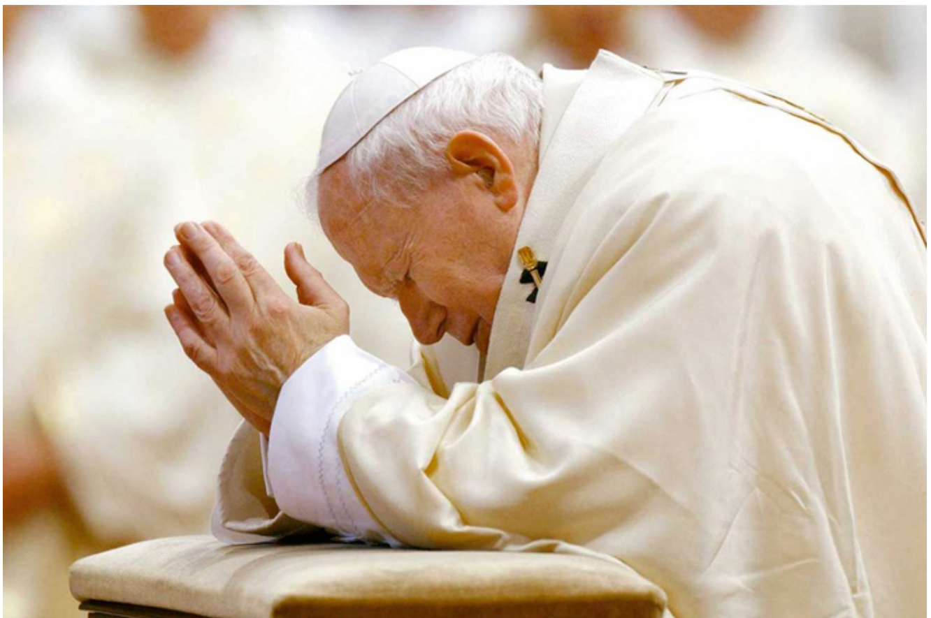
Jan Paweł II

Natomiast przekaz literacki jest dla niego przekazem myśli, skoro słowo jest odczytywaniem, czy nazywaniem tego co dzieje się w przestrzeni myśli, w przestrzeni rozumienia człowieka, w przestrzeni poznawczej, poszukiwaniem poznawczym, w którym sięga się do głębi swoich myśli, swojego poznania także.