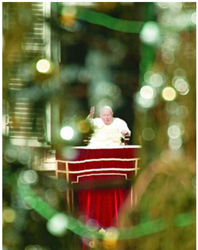
Jan Paweł II

Oprócz obszarów tradycji romantycznych i neoromantycznych, Jana Pawła II pasjonował Wyspiański i dużo z niego czerpał. Ale obok tradycji literackiej widać wyraźnie wpływ teologii Jana od Krzyża, doświadczenia mistycznego, które jest tak niezmiernie ważne i filozofii, zarówno tej klasycznej, gdzie definiowane są podstawowe pojęcie bytu jako dobra życia człowieka, jak i metody od metody fenomenologicznej obserwacji, gdy sam staje się i podmiotem, i przedmiotem obserwacji.