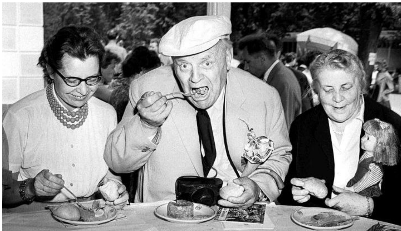
Melchior Wańkowicz z żoną i córką, 1960 r.