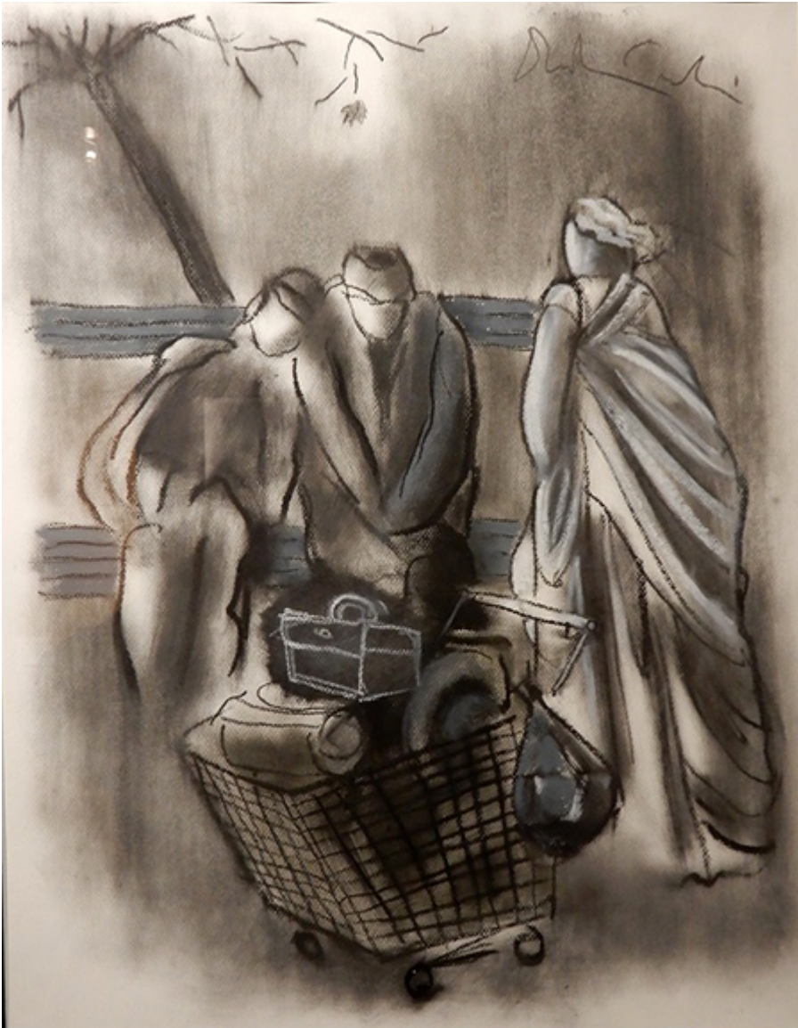
Andrzej Dudziński