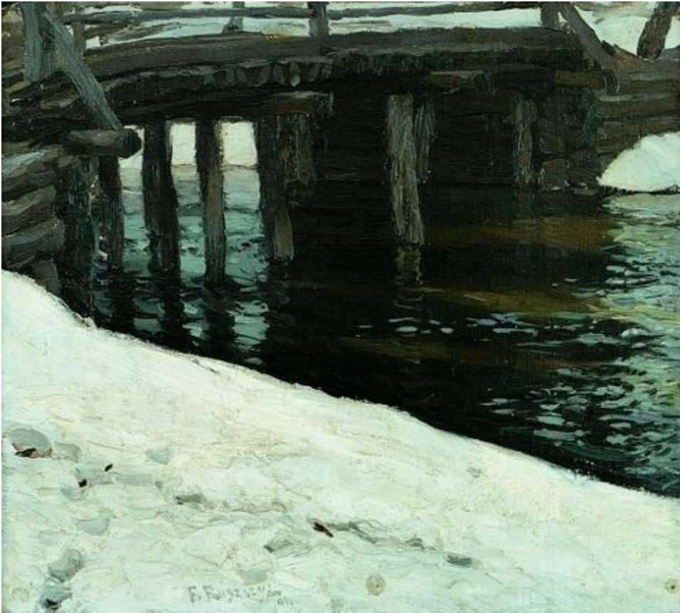
Ferdynand Ruszczyc Most zimą.