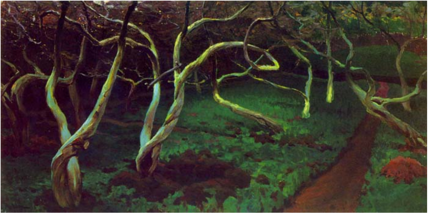
Ferdynand Ruszczyc, Stare jabłonie.