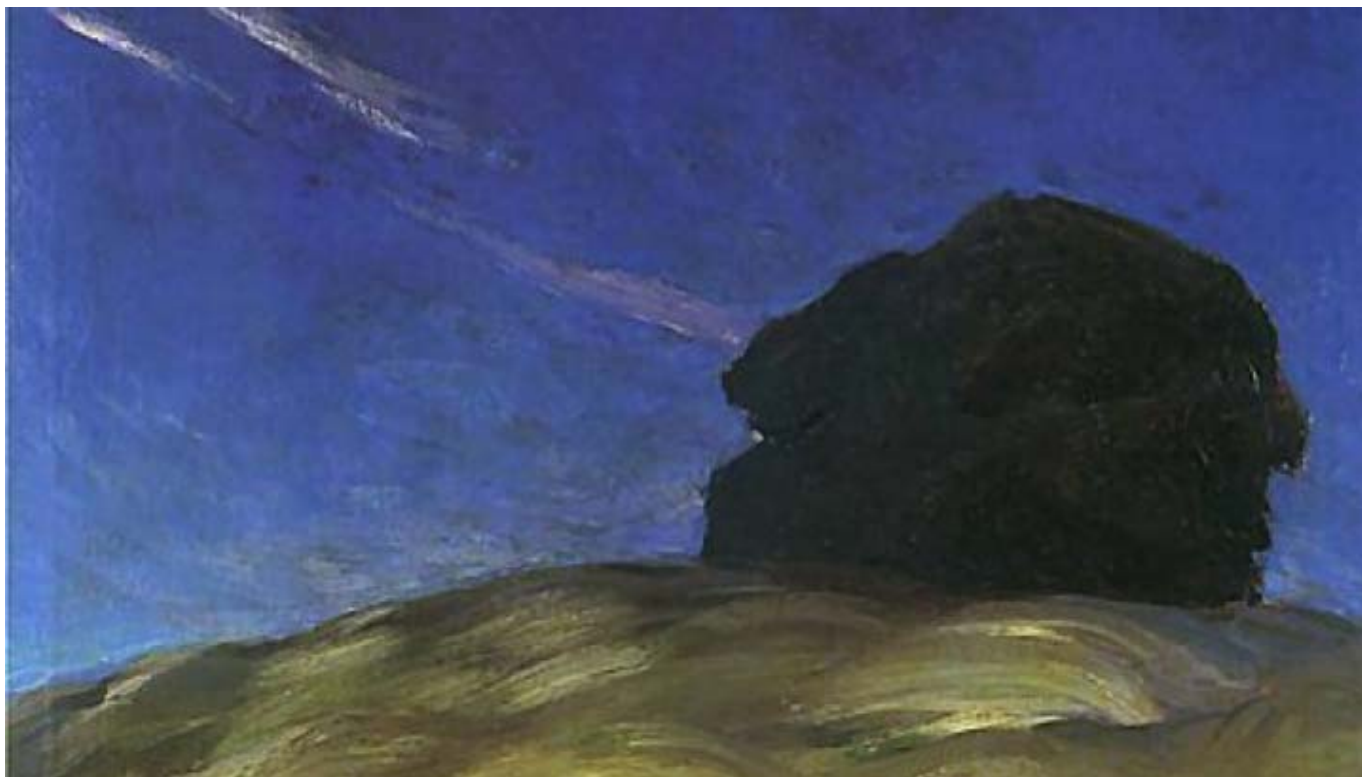
Ferdynand Ruszczyc, „Obłok”, 1902, olej na płótnie, 110 x 80 cm, wł. Muzeum Narodowe w Poznaniu.