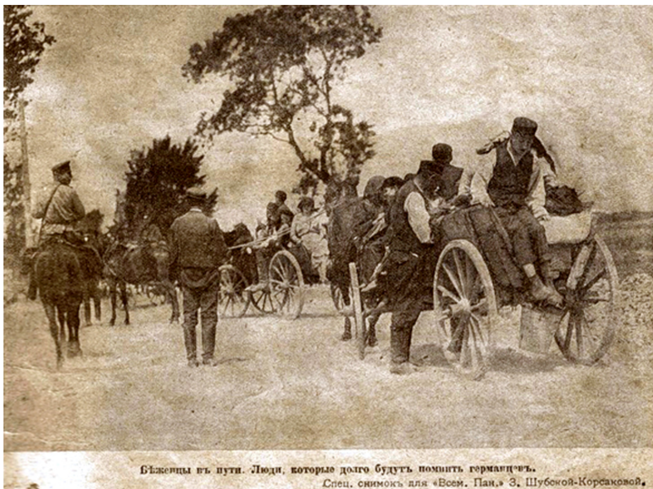
Bieżeńcy, 1915 r

Poza wszystkim książka „Bieżeństwo 1915” jest epickim, pełnym opisem historii bieżeńców 1915 roku, w którym autorka nie tylko pochyliła się nad losem wspólnot, pojedynczych ludzi, a także nad historią własnej rodziny. Stała się także „kronikarzem duszy ludzkiej” (używając sformułowania Swietłany Aleksijewicz), ukazując, jakie straty ponieśli ludzie w sferze duchowej i psychicznej. Czytając ten fascynujący reportaż, stajemy się świadkami i niejako „uczestnikami” jej dramatycznej opowieści, budzącej zarazem refleksję nad meandrami historii. Książka otrzymała już szereg znaczących nagród, m.in. nominację do Nagrody im. Ryszarda Kapuścińskiego 2017, Nagrodę Literacką im. Wiesława Kazaneckiego oraz Nagrodę Literacką Miasta St. Warszawy.