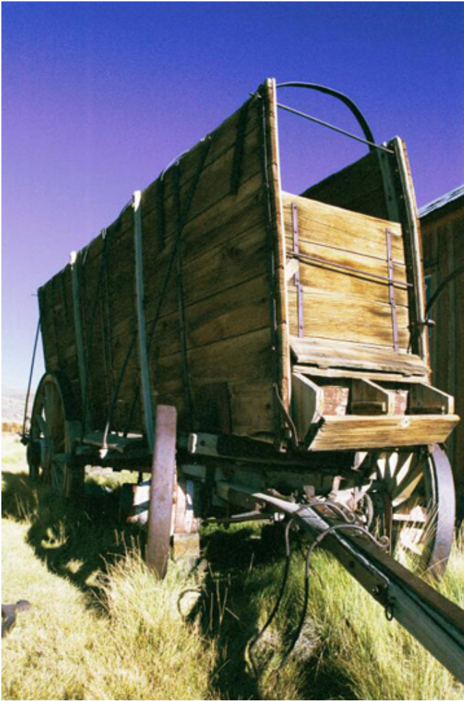
Body, wóz którym osadnicy przybywali po swoje marzenia, fot. Jacek Gwizdka.

Ta wypracowana przez lata doświadczeń i zmagañ z wysiłkiem, kalifornijska dewiza jest ciągle żywa. Kalifornia nadal przyciąga marzycieli, ryzykantów, ludzi odważnych nie wahających się postawić wszystkiego na jedną kartę. To nie przypadek, że właśnie w Krzemowej Dolinie niedaleko San Francisco ciągle powstają setki nowych, małych i wielkich firm komputerowych. To tu w błyskawicznym tempie rozwija się Internet, którego sieć oplotła już całą kulę ziemską. Tak jak ponad sto lat temu Kalifornia była głównym dostawcą złota dla mennic i banków w całych Stanach Zjednoczonych, tak teraz dostarcza całemu światu komputerową myśl twórczą.