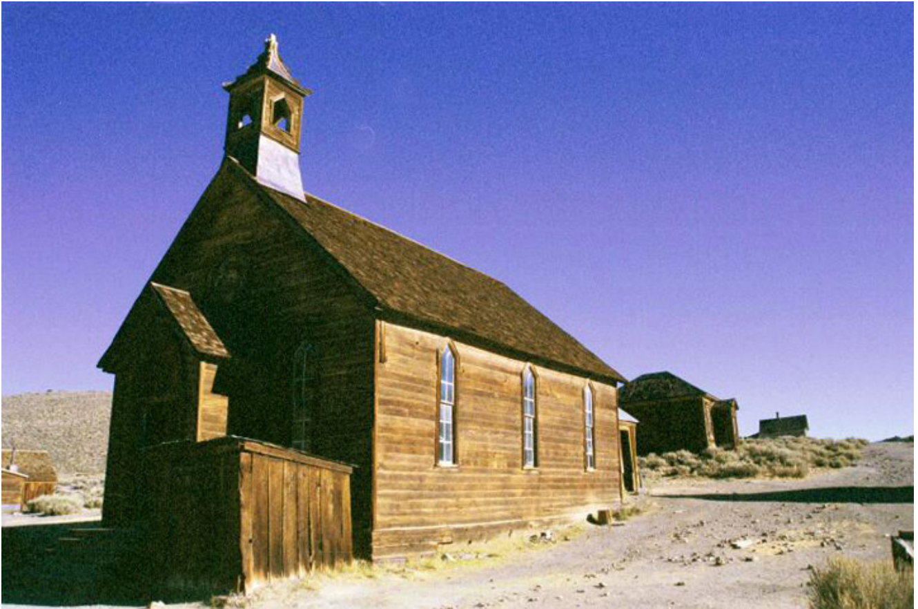
Bodie, kościół ewangelicki, fot. Jacek Gwizdka.

Zachowany w idealnym stanie kościół ewangelicki, wygląda tak jakby za chwilę miał przyjąć modlitwę o szczęście dla poszukiwaczy złotego kruszcu. Podchodzi do nas jakiś człowiek, w wielkim kowbojskim kapeluszu. - Tak wcześnie w Bodie? - uśmiecha się. A skąd jesteście? Bo ja z San Francisco? Nocowałem niedaleko w samochodzie, by być tu z samego rana. Wtedy jest niesamowite światło, trochę porannej mgły, odrobina tajemniczości. Przyjeżdżam tu co jakiś czas. Coś magicznego jest w tym miejscu. Gdy człowiekowi nie wiedzie się w interesach powinien cieszyć się, że zdobył doświadczenie, bo jest to zapowiedzią przyszłego sukcesu. Tak mówili osadnicy.