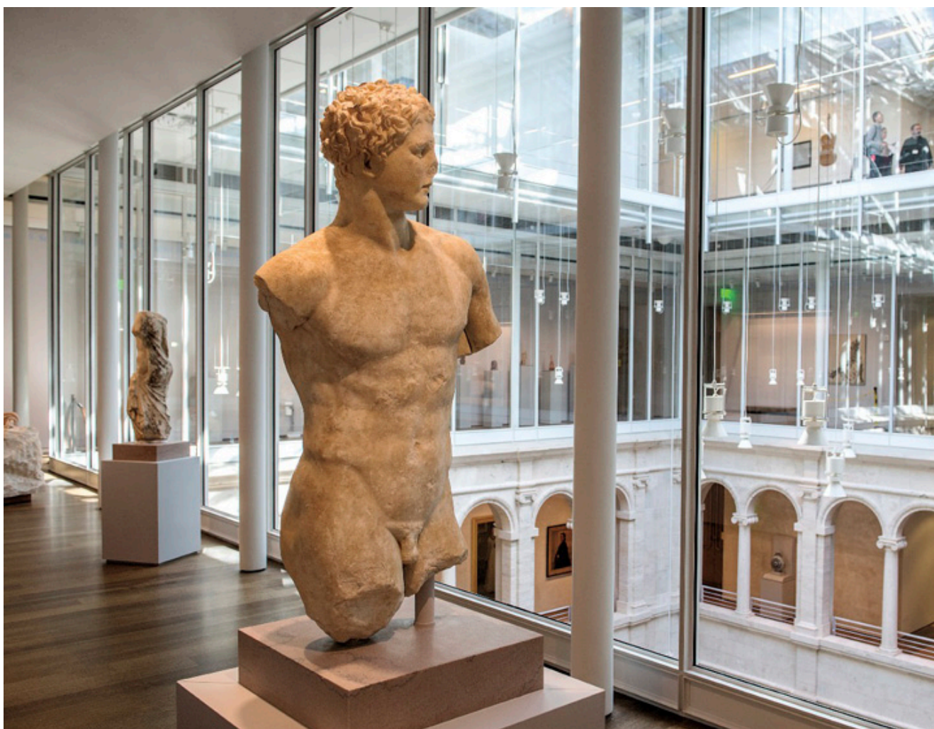
Harvard Art Museum, fot. Jim Harrison.

Przekraczając bramę Harvard University należy dotknąć ręką buta Johna Harvarda, założyciela uczelni, wygodnie siedzącego z książką na cokole pomnika. Od momentu założenia, w 1636 roku do dnia dzisiejszego, uczelnia cieszy się zasłużoną estymą jednego z najlepszych uniwersytetów świata.