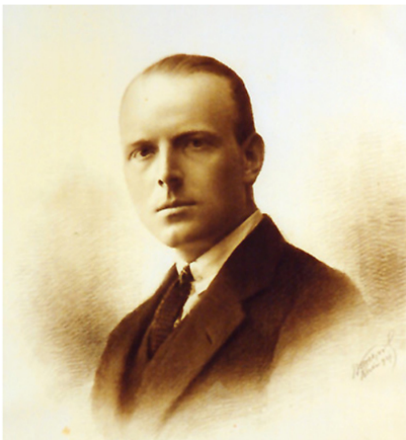
Alfred Potocki, IV ordynat (1886-1958)

Gośćmi ordynata Potockiego byli prezydent Mościcki, minister Beck, królowa Rumunii, księżstwo Kentu. Wizyty te hrabia Alfred starannie opisywał: