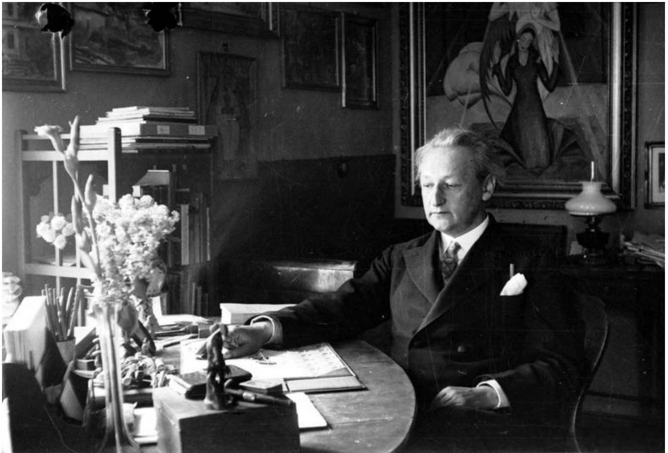
Emil Zegadłowicz (1888 - 1941) - poeta w swoim mieszkaniu w Gorzeniu Górnym, woj. krakowskie; zdjęcie ze zbioru: Jubileusz 25 lecia pracy pisarskiej Emila Zegadłowicza.