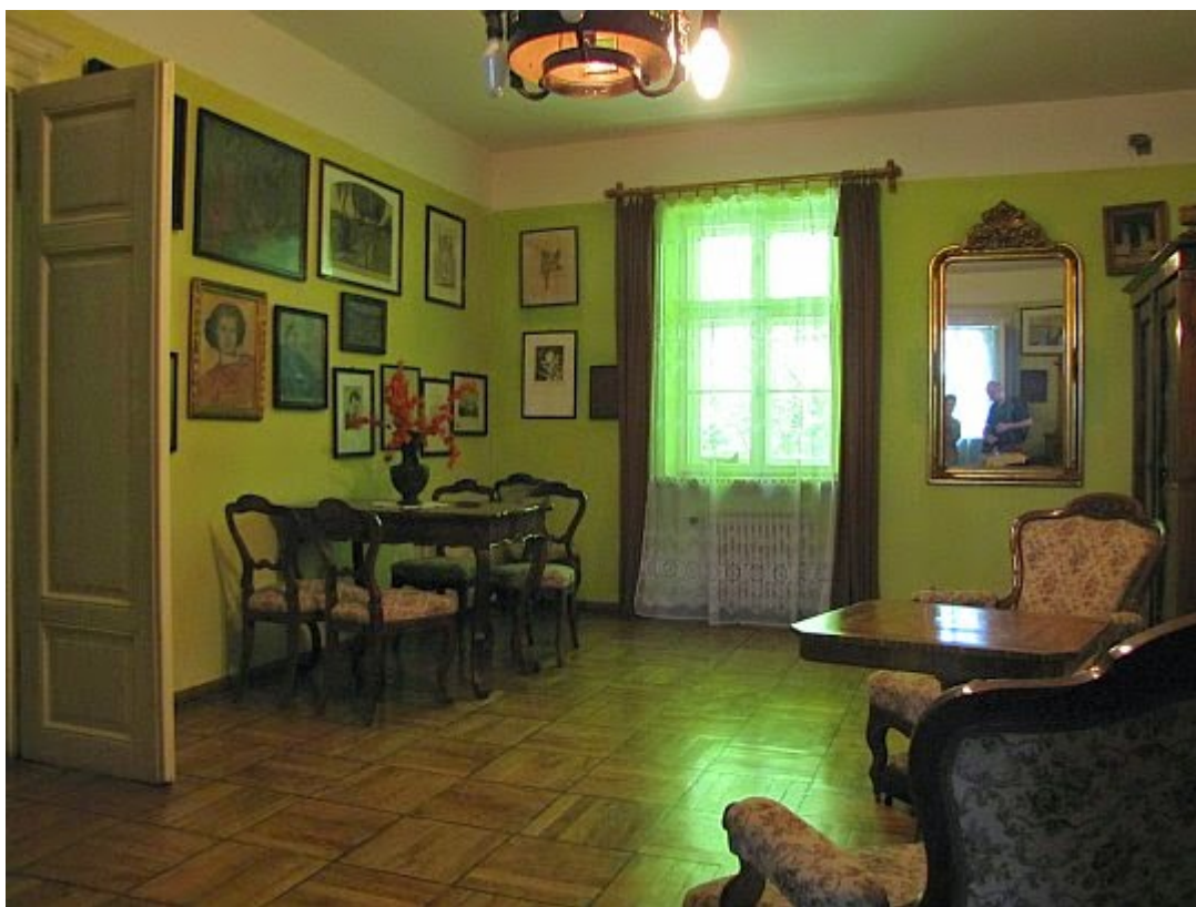
Muzeum Emila Zegadłowicza. Herbaciarnia.