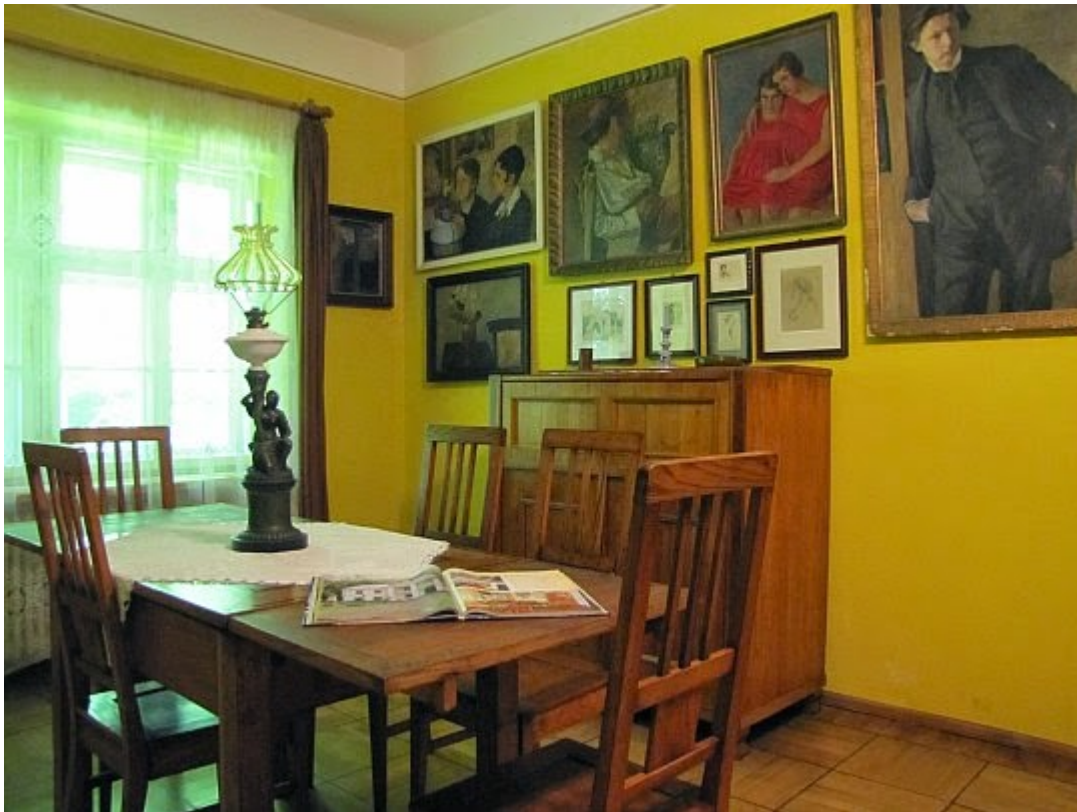
Muzeum Emila Zegadłowicza. Jadalnia.