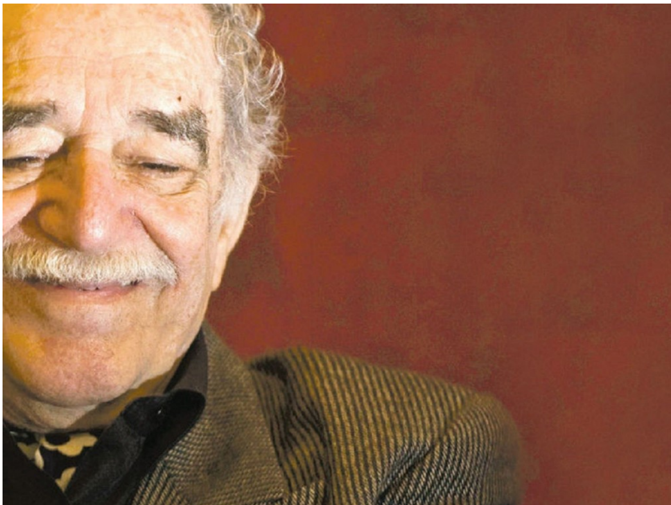
Gabriel García Márquez.