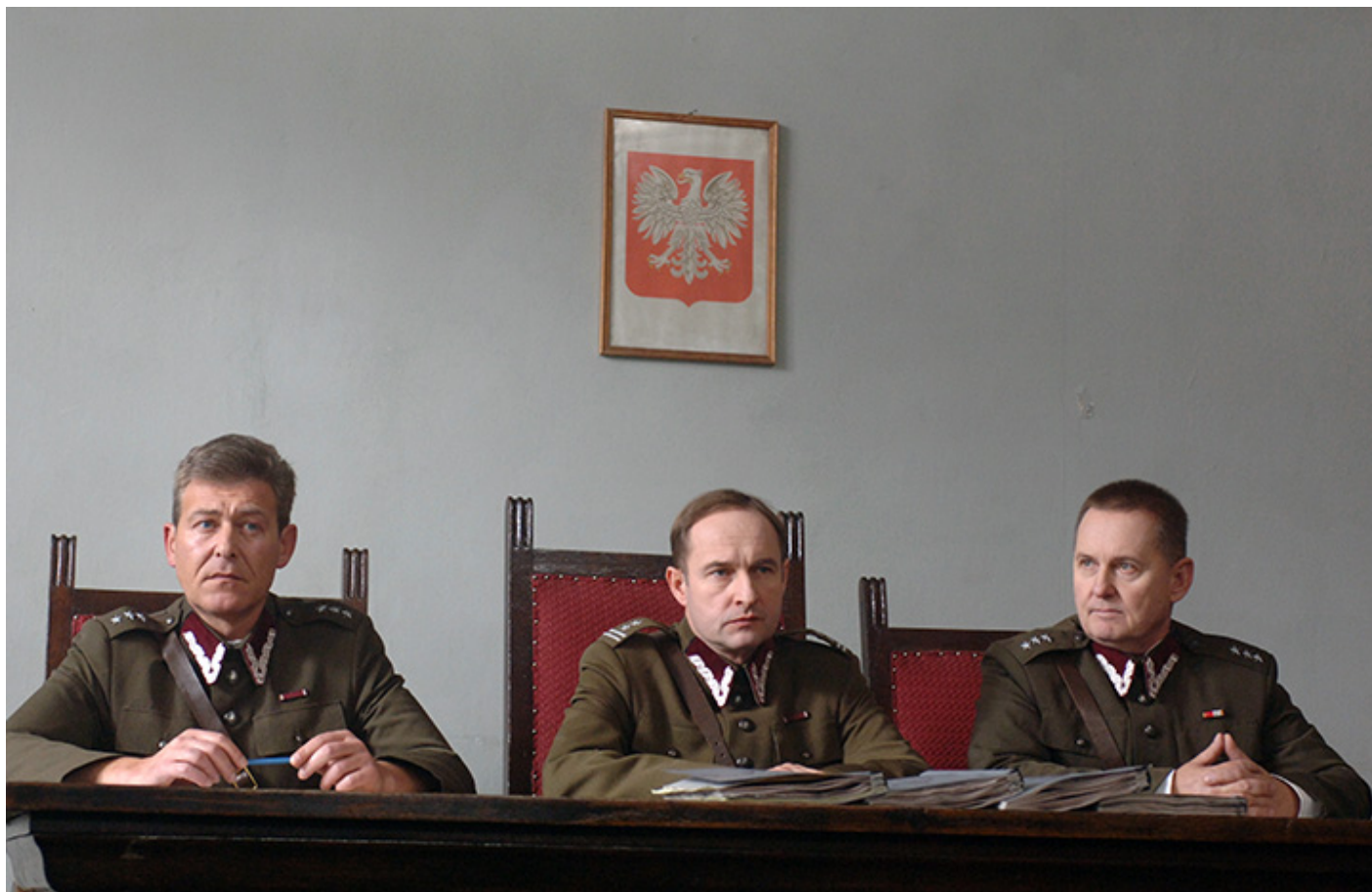
Scena na sali sądowej w filmie Ryszarda Bugajskiego „Śmierć Rotmistrza Pileckiego”