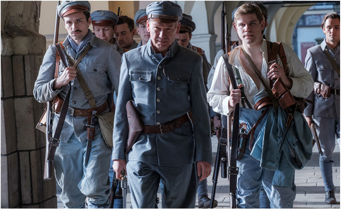
Kadr z filmu Dariusza Gajewskiego „Legiony”