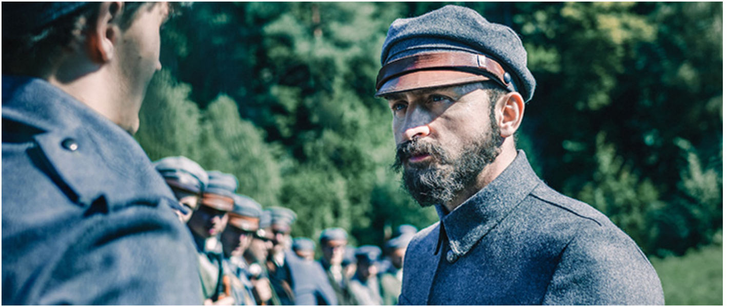
Kadr z filmu Michała Rosy „Piłsudski”, fot. Jarosław Sosiński