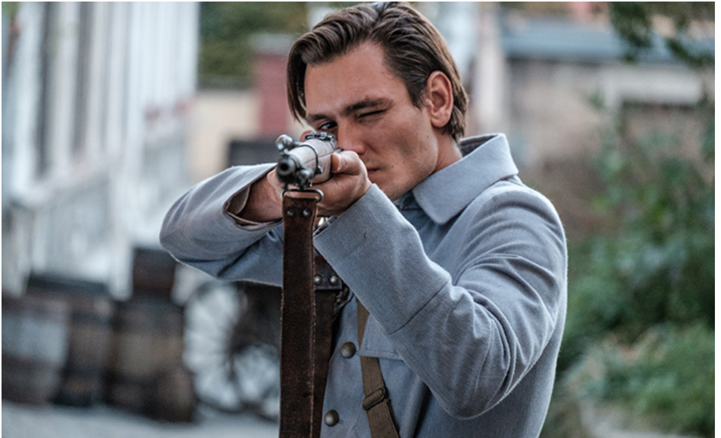
Kadr z filmu Dariusza Gajewskiego „Legiony”