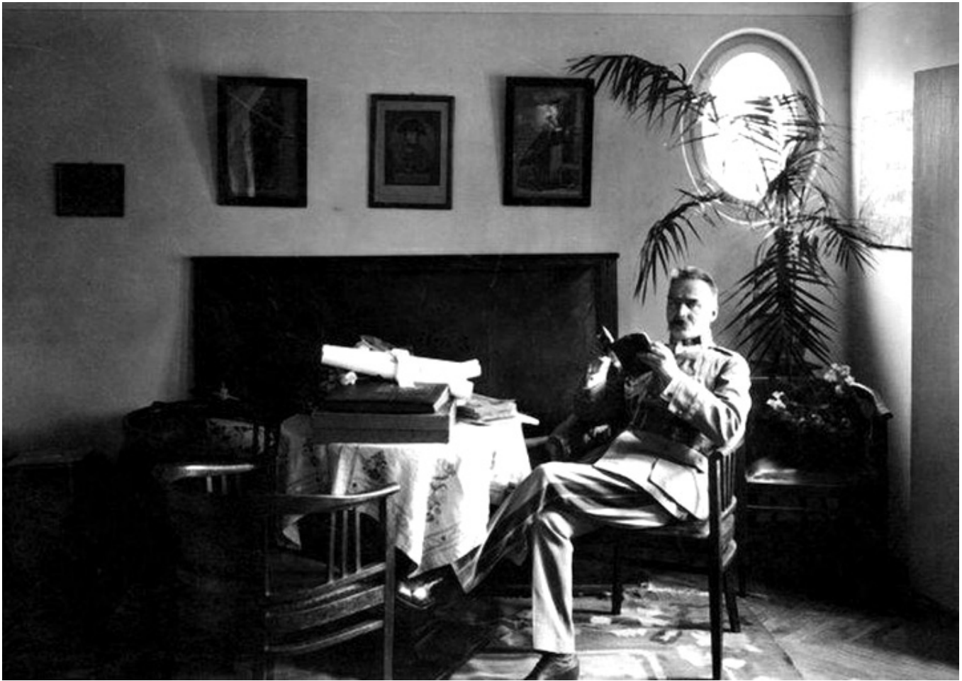
Józef Piłsudski w swoim dworze w Sulejówku pod Warszawą, 1925 r.

„Komendant”, „Brygadier”, „Ziuk” i w jednej osobie „Dziadek” bywał ze swoimi strzelcami wszędzie. Dzielił z nimi niebezpieczeństwa i niewygody, sypiał z nimi w jednej izbie, jadał te same, co oni, potrawy. Po prostu ich cenił i lubił. Nic dziwnego, że ci szukali każdej okazji, aby mu okazać szacunek i zwyczajną miłość. Nazywając go „Dziadkiem” starali się akcentować ideowe pokrewieństwo z nim jako uosobieniem ofiarnej walki o wolną Polskę, o którą przez dziesięciolecia modlili się swoją poezją wielcy romantycy. Dlatego też 19 marca każdego roku szły ku Piłsudskiemu najcieplejsze myśli jego żołnierzy, wszystkich polskich