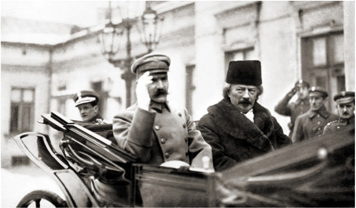
Józef Piłsudski i Ignacy Jan Paderewski, 1919 r.