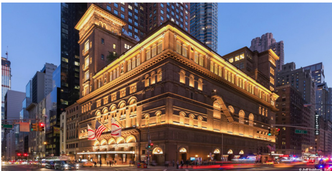
Carnegie Hall w Nowym Jorku.