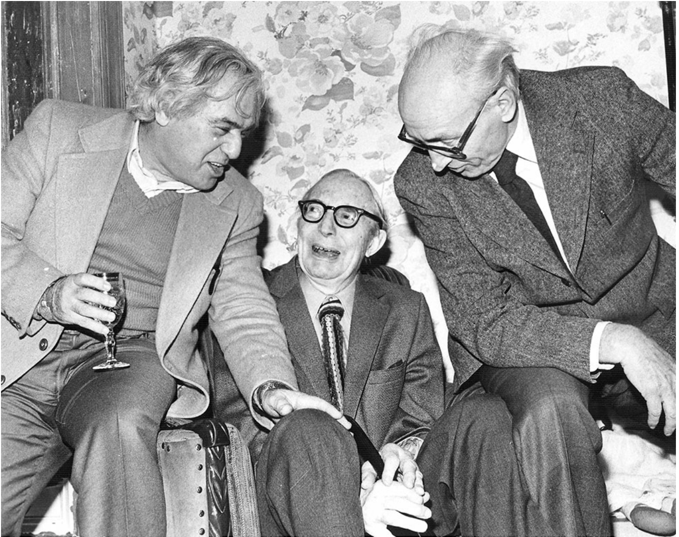
Poeci montrealscy: od lewej Irving Layton (1912-2006), Frank R. Scott (1899-1985) i Louis Dudek (1918-2001).

Przy tym był realistą. Rozumiał, że nie wszystko da się uratować, że trzeba się liczyć ze stratami. Wziąłem udział w 1984 roku w ogólnokrajowej konferencji w Ottawie poświęconej językowi, kulturze i tożsamości w Kanadzie. Uczestniczył w niej także Louis Dudek. Wypowiadał się na temat literatur tworzonych na ziemiach Kanady w językach innych niż angielski i francuski, w tzw. językach trzecich, nieoficjalnych, mylnie nazywanych językami etnicznymi. Jego zdaniem, niektóre wybitne jednostki, które emigrowały do Kanady, stanowiły wyjątki przynależały bowiem bezspornie do swojej macierzystej kultury, natomiast przesadzone całe grupy przypominały mu rośliny w doniczkach, rosnące nienaturalnie, będące nie na swoich miejscach. Im nie wróżył rozwoju ale stopniowy uwiąd. Bo choć Kanada sama też przybyła z Europy, to poprzez kilka stuleci wytworzyła dwa odrębne, ale silne nurty literatury, które się z czasem samookreśliły, a ostatnimi czasy pozyskały również inne dopływy. Taką pierwszą odmienną grupę stanowili pisarze żydowskiego pochodzenia jak Klein, Layton,