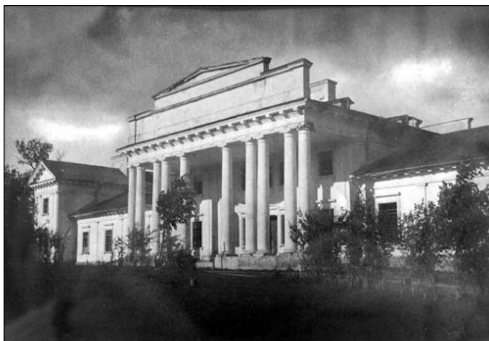
Pałac Tyszkiewiczów w Łohojsku