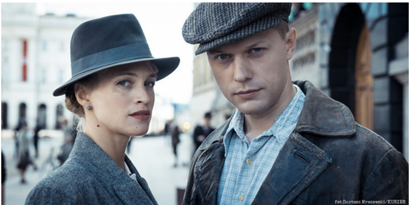
Kadr z filmu „Kurier”, fot. Bartosz Mrozowski.

Film ten ma być przede wszystkim dobrą przygodą, rozrywką, z elementami kina akcji czy kina szpiegowskiego. Wspomniała Pani o Indiana Jonesie. To jest według mnie dobre porównanie, bo w „Kurierze” jest dużo lekkich scen, robionych z dużym poczuciem humoru. Jest też wiele wymyślonych epizodów, jak na przykład wątek związany z agentką Doris.