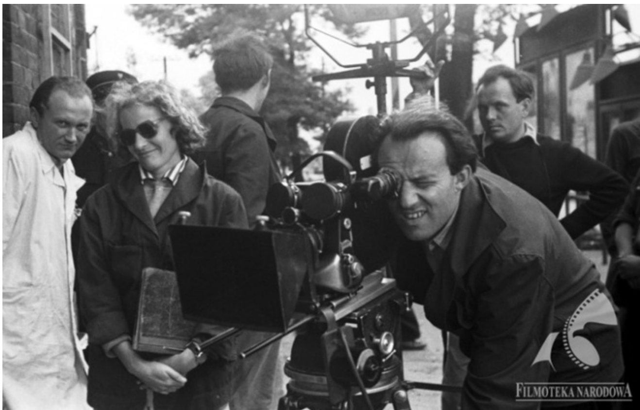
Andrzej Munk

Andrzej Munk należał do grupy młodych reżyserów tworzących w zespole filmowym KAMERA. W tym zespole powstały pierwsze filmy Andrzeja Wajdy, Jerzego Skolimowskiego, Romana Polańskiego, Wojciecha Hasa, Bohdana Poręby, Jakuba Morgernsterna. Powstały wówczas tak wybitne filmy, jak Pokolenie , Kanał , Popiół i diament Wajdy, Baza ludzi umarłych (wg opowiadania Marka Hłaski) Petelskiego czy Nóż w wodzie Polańskiego. To powojenne pokolenie młodych reżyserów wykreowało nurt w polskim kinie, który z całą siłą ujawnił się dopiero po 1956 r. Wojenne rozrachunki z punktu widzenia jednostki, różne motywy działania i różne racje to główna tematyka filmowa tego okresu. Podejmowanie polemiki z mitem bohaterstwa, to rys charakterystyczny nowego polskiego kina.