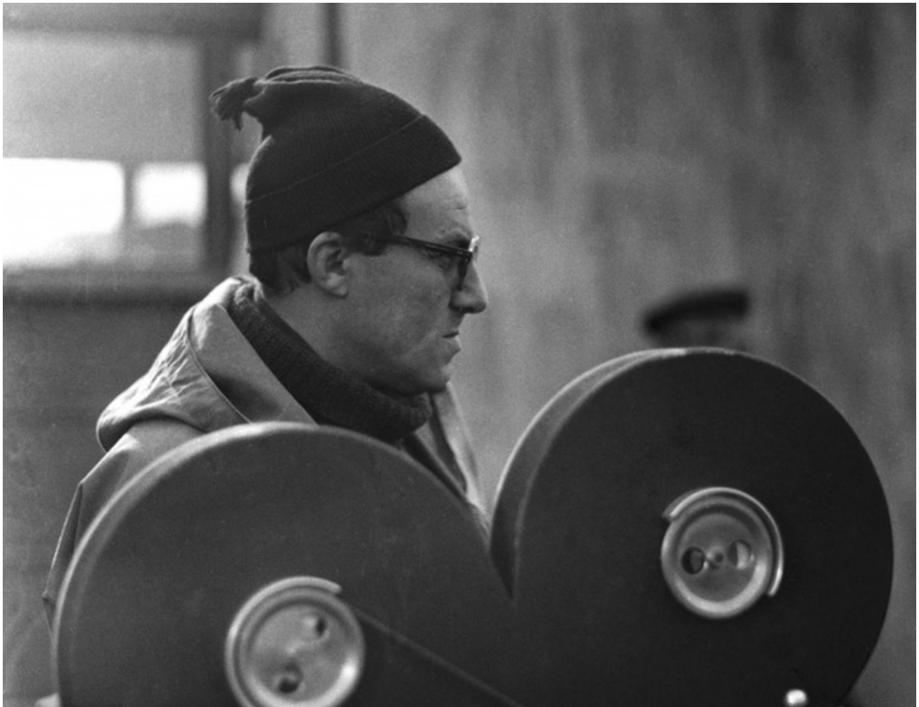
Andrzej Munk, fot. Studio Filmowe KADR.