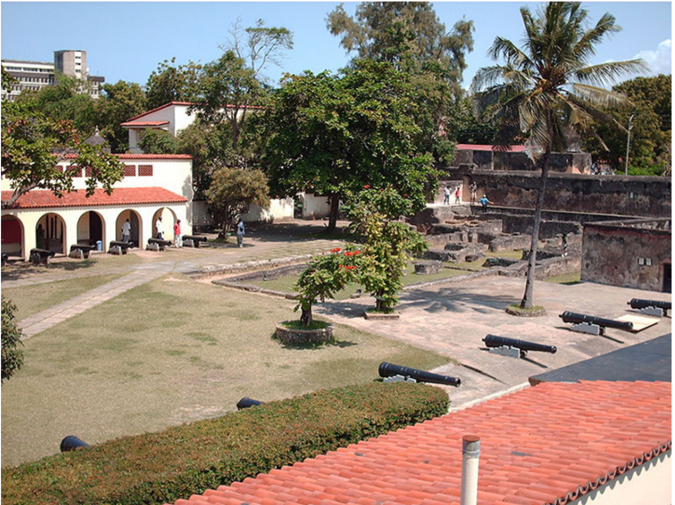
Fort Jezusa. Mombasa.

ciekawostka. Ładnie prezentują się zwieńczone kopułkami kaplice na skraju dziedzińca.