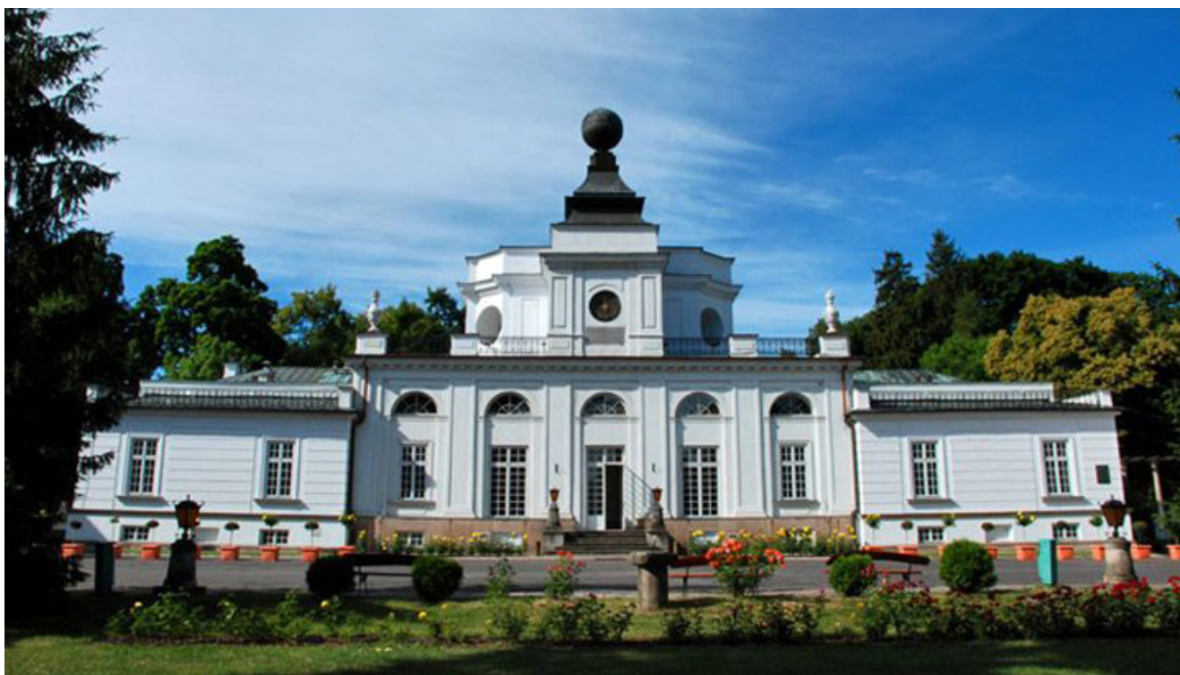
Pałac w Jabłonnie