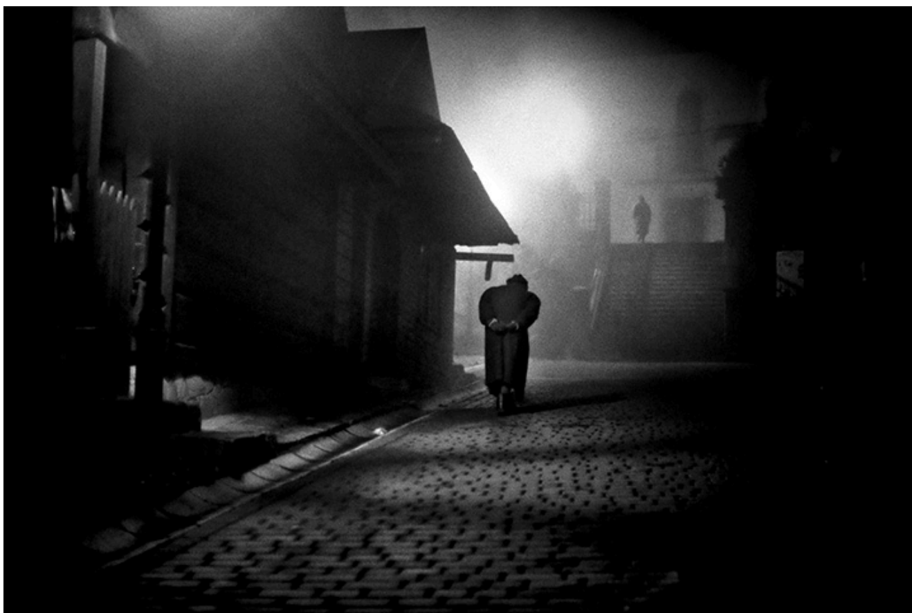
Zdjęcie z albumu „Lanckorona”

Po pierwsze aparat fotograficzny, który dostałem od Chrisa w prezencie miał w środku załadowany film czarno-biały. Przypuszczalnie, gdyby w środku był film kolorowy, to bym robił zdjęcia kolorowe [ śmiech ]. Po drugie, pamiętam z mojego domu czarno-biały telewizor, w którym świat wydawał się taki autentyczny, szczerzy i prawdziwy. Może dlatego, że byliśmy dziećmi. Oprócz tego jak oglądam Kazimierz, to oglądam go oczyma ludzi, którzy tam kiedyś żyli, a kiedy oglądam Lanckoronę, to oglądam ją oczyma mojej babki. W tym czasie nie było kolorowej fotografii. Te wszystkie zdjęcia, robione techniką cyfrową, zaczynają życie jako zdjęcia kolorowe, dopiero później pozbawiam je koloru.