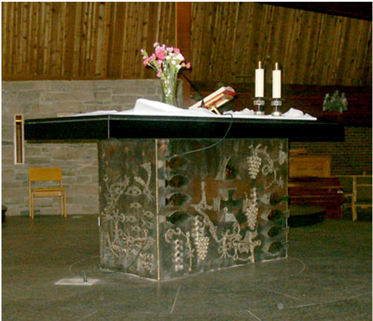
Ołtarz i inne przedmioty sakralne w kościele Wszystkich Świętych w Etobicoke, rzeźbione w metalu, są autorstwa Krystyny Sadowskiej