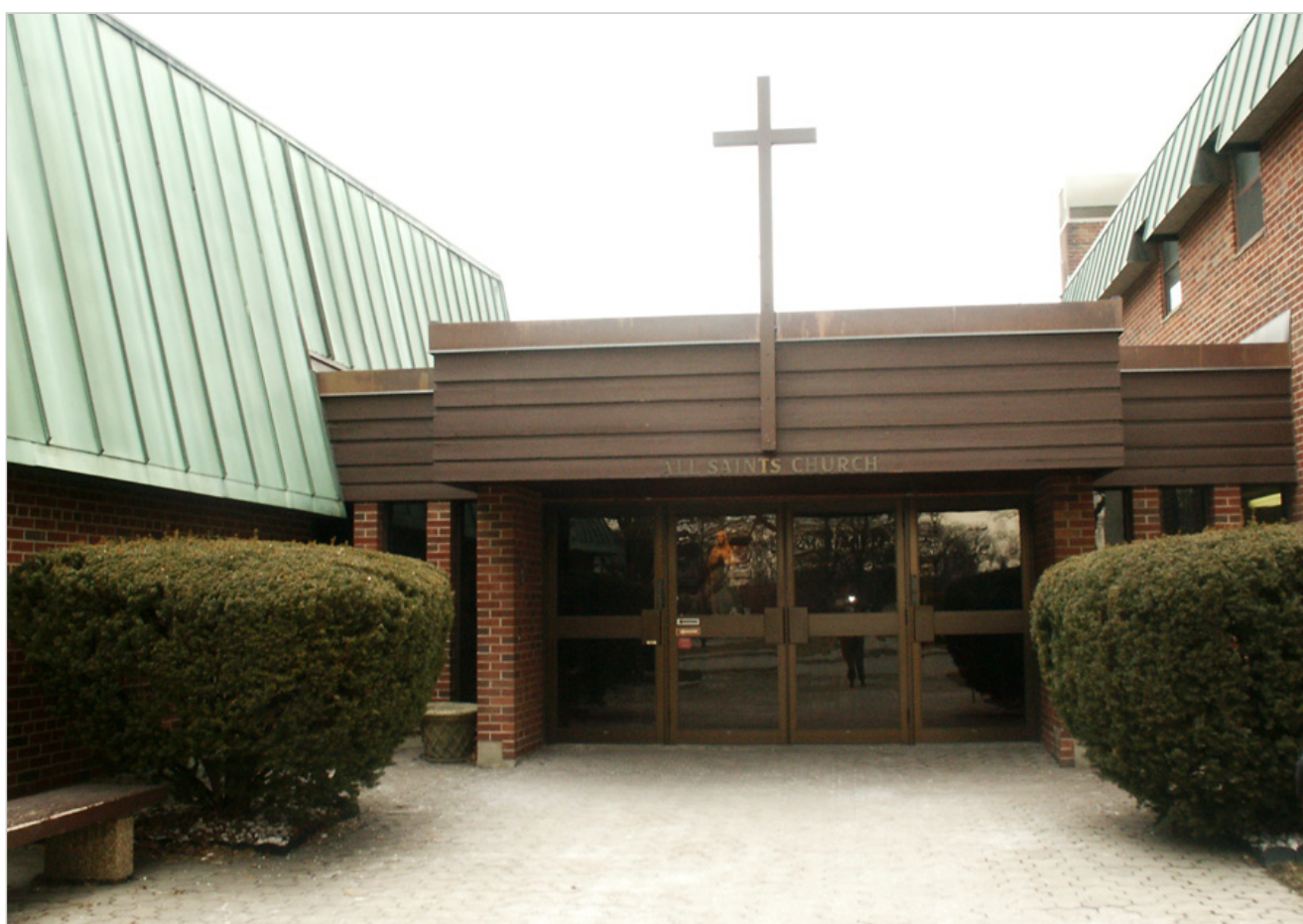
Kościół Wszystkich Świętych, Toronto-Etobicoke, Ontario