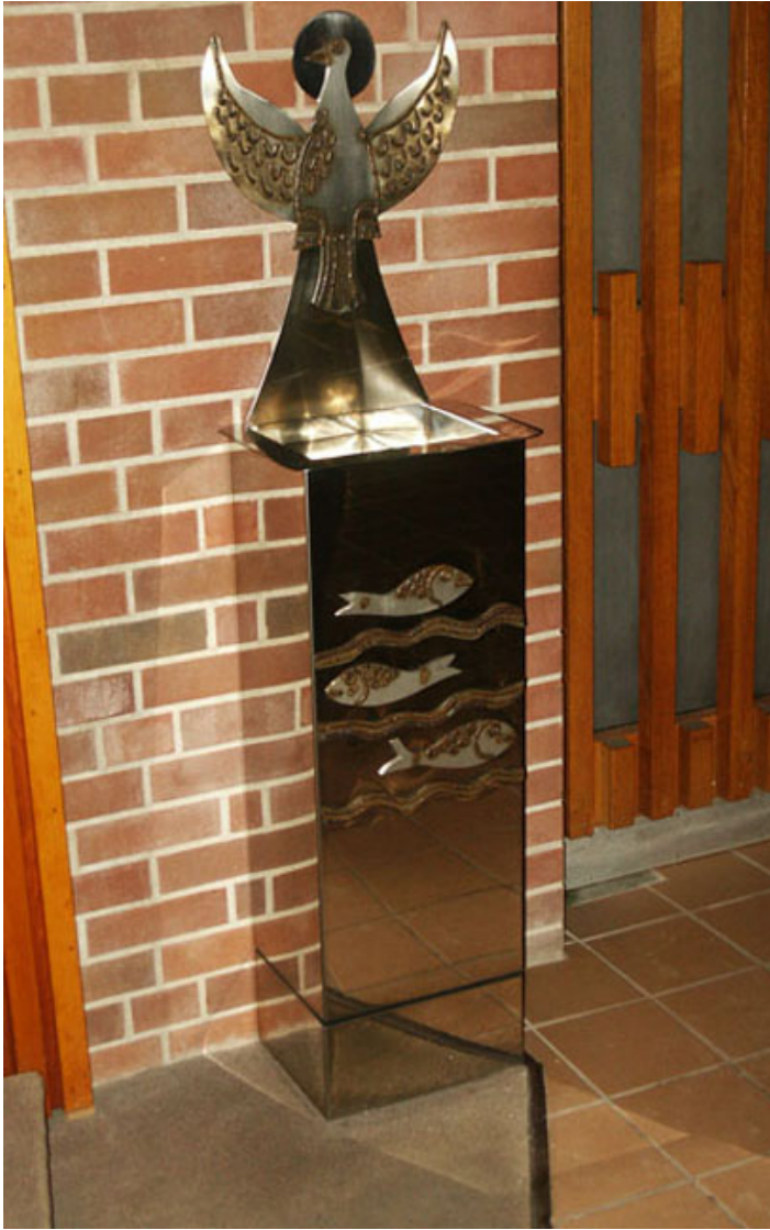
Kropielnica autorstwa Krystyny Sadowskiej w kościele Wszystkich Świętych, w Etobicoke