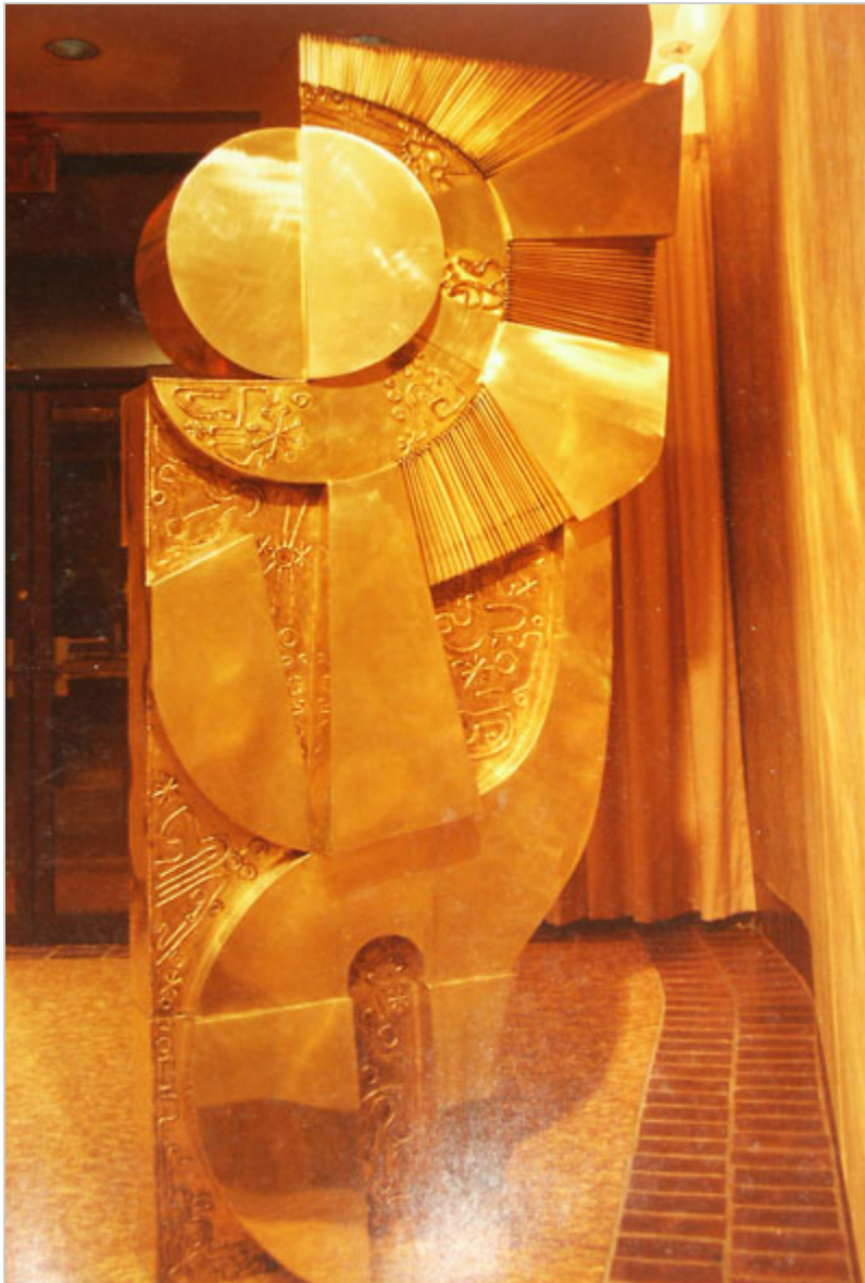
Krystyna Sadowska, stojąca metalowa rzeźba, fot. J. Sokołowska- Gwizdka.