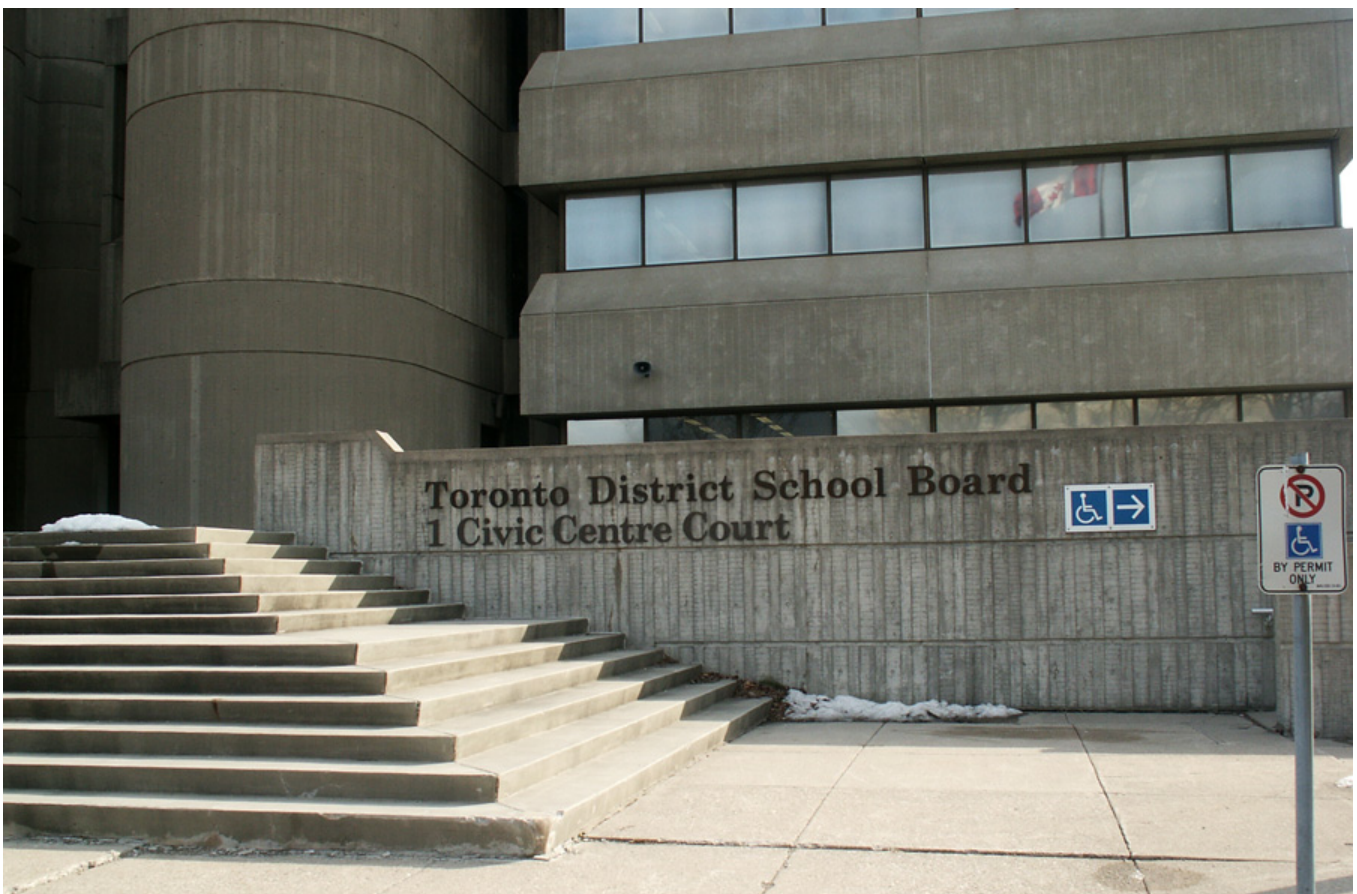
Toronto District School Board, Civic Centre Court, Toronto-Etobicoke, Ontario