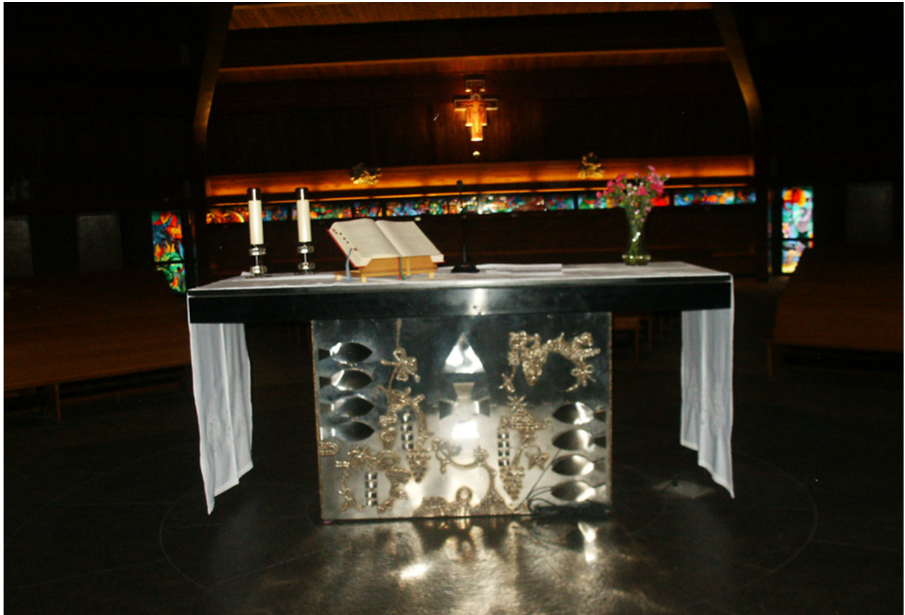
Ołtarz i inne przedmioty sakralne w kościele Wszystkich Świętych w Etobicoke, rzeźbione w metalu, są autorstwa Krystyny Sadowskiej