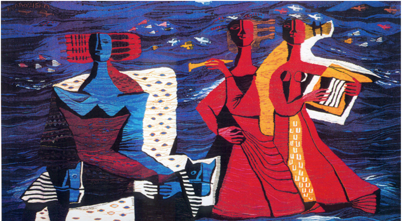
Gobelin „Muzykanci”, za który Krystyna Sadowska otrzymała złoty medal na wystawie w Paryżu pod koniec lat 30-tych XX w.