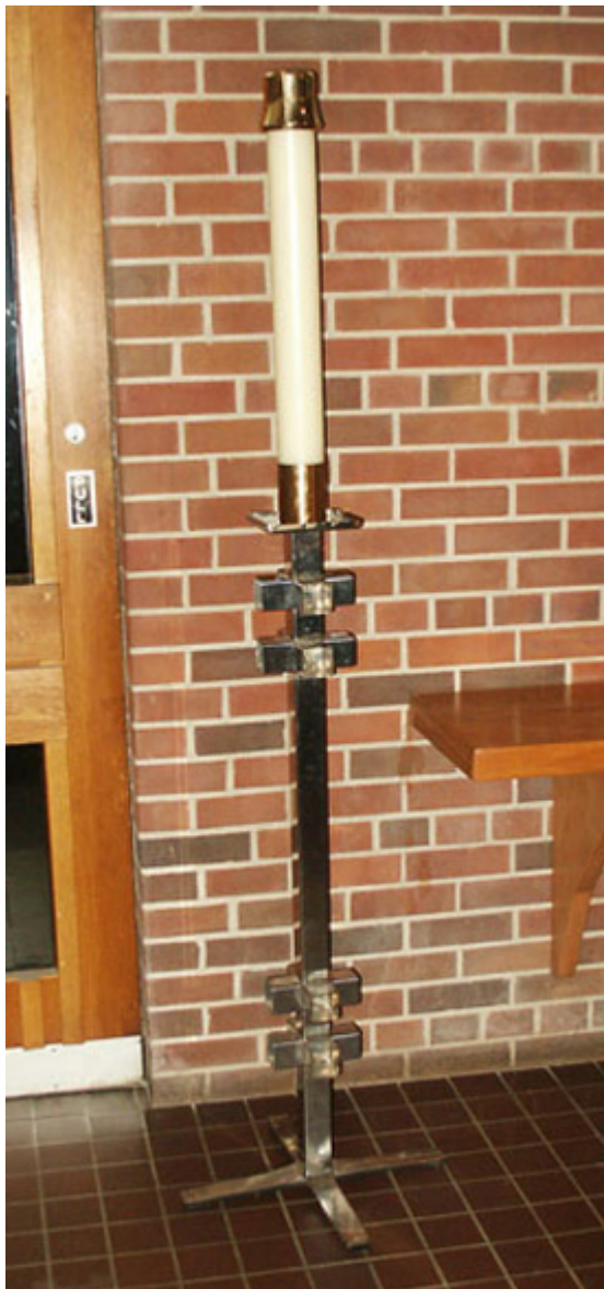
Świecznik autorstwa Krystyny Sadowskiej w kościele Wszystkich Świętych, w Etobicoke