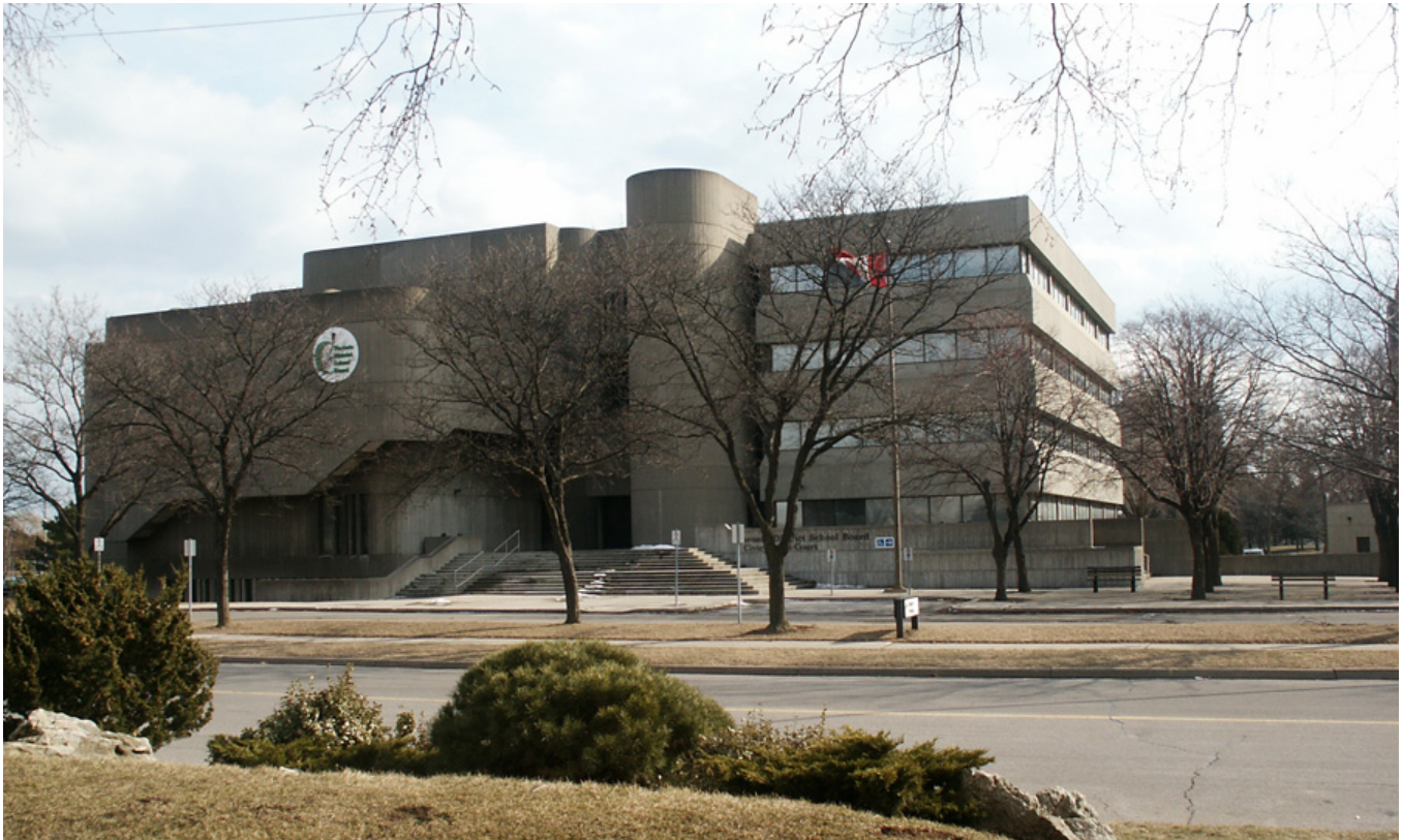
Toronto District School Board, Civic Centre Court, Toronto-Etobicoke, Ontario