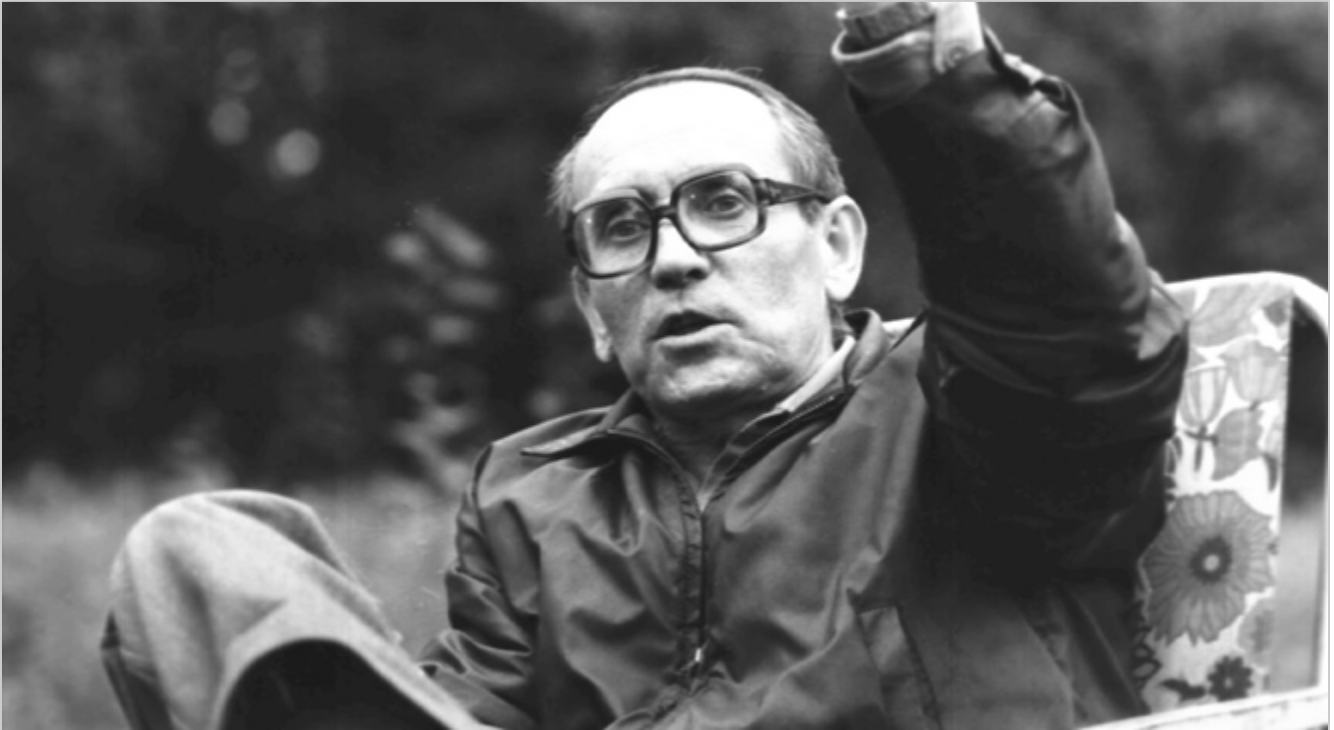
Tadeusz Konwicki podczas realizacji filmu „Dolina Issy” w 1981 roku