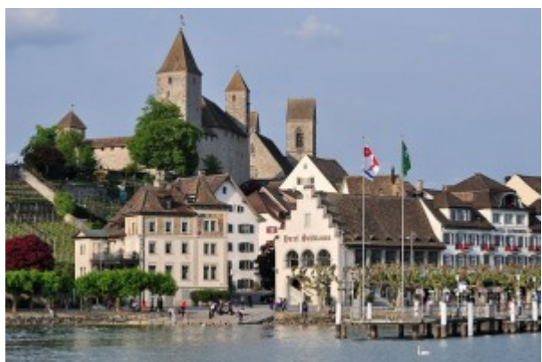
Zamek w Rapperswilu