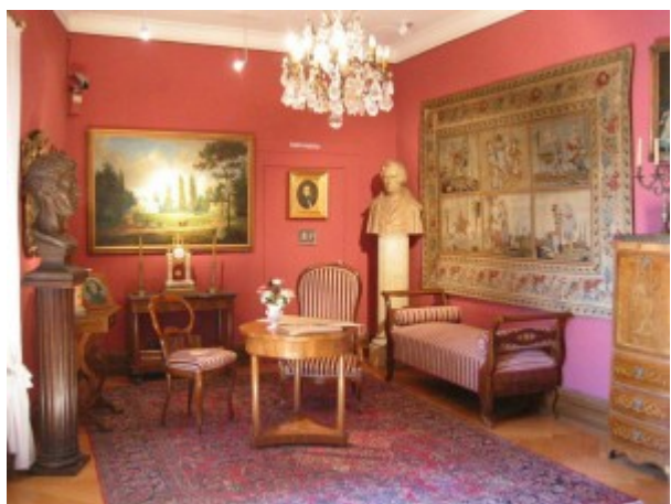
Muzeum Polskie w Rapperswilu w Szwajcarii

Los Muzeum Polskiego, którego siedziba znajduje się w średniowiecznym zamku w pobliżu malowniczego Jeziora Zuryskiego, stoi pod znakiem zapytania. Starania polskiej dyplomacji, aby po 140 latach nadal utrzymać tę polską placówkę w Szwajcarii, jakże ważną dla historii polskiej kultury na emigracji, nie przyniosły rezultatów. W miejscu polskiego muzeum ma powstać restauracja i muzeum gminne. (red.)