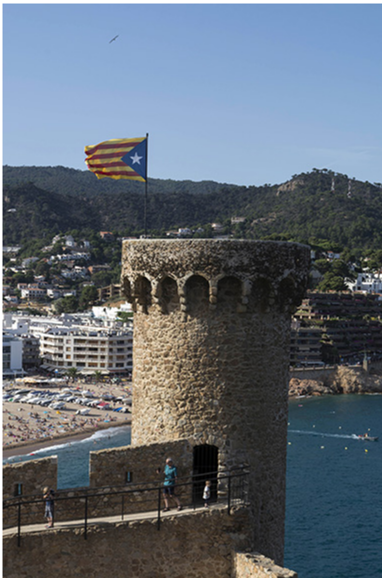
Tossa de Mar (1 sierpnia 2019), fot. Anna Simó.