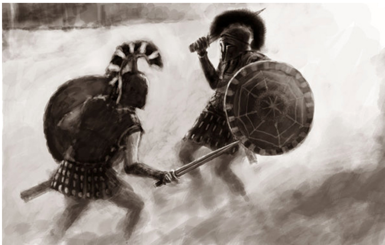
Achilles i Hektor