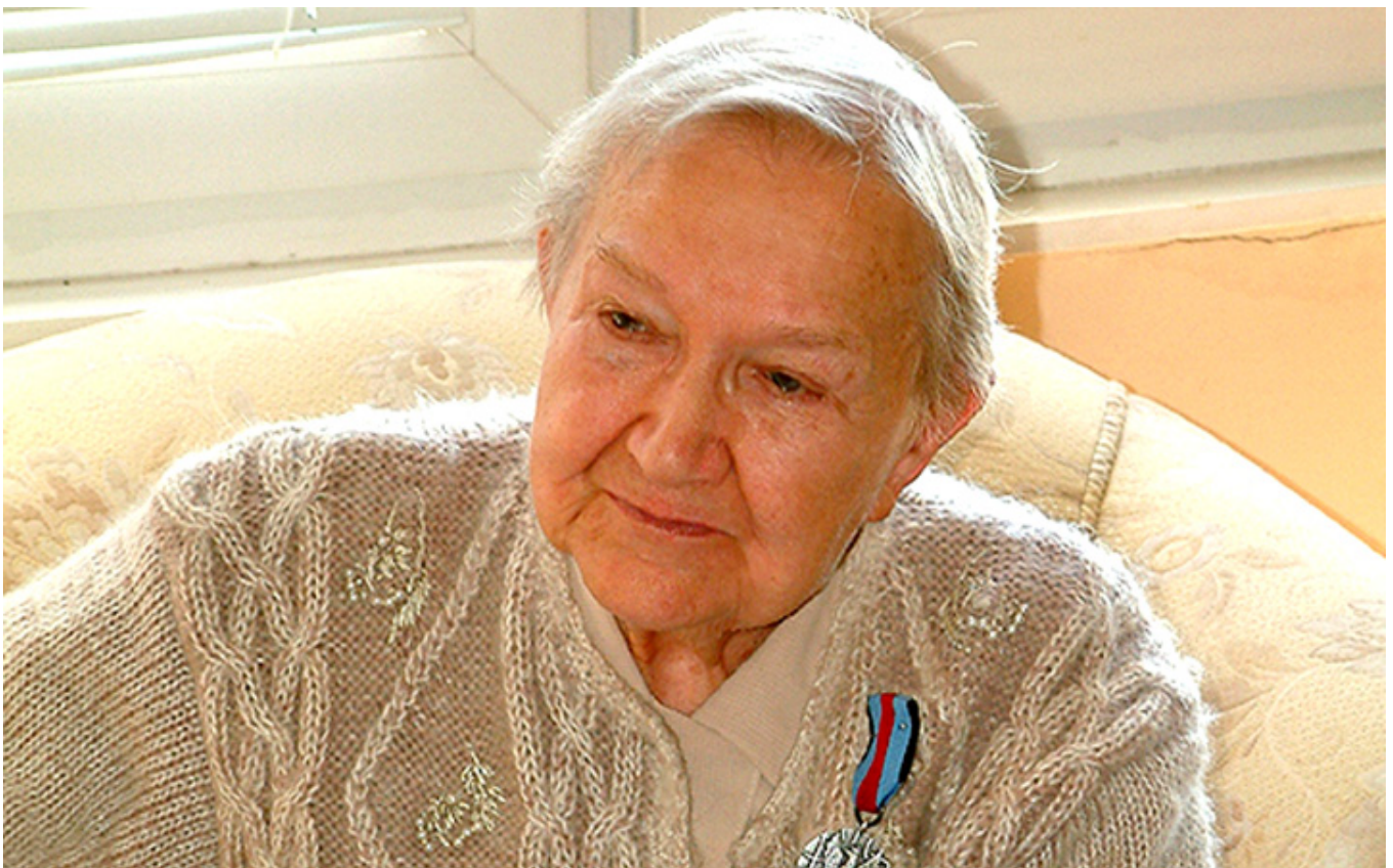
Elżbieta Zawacka, fot. materiały prasowe.