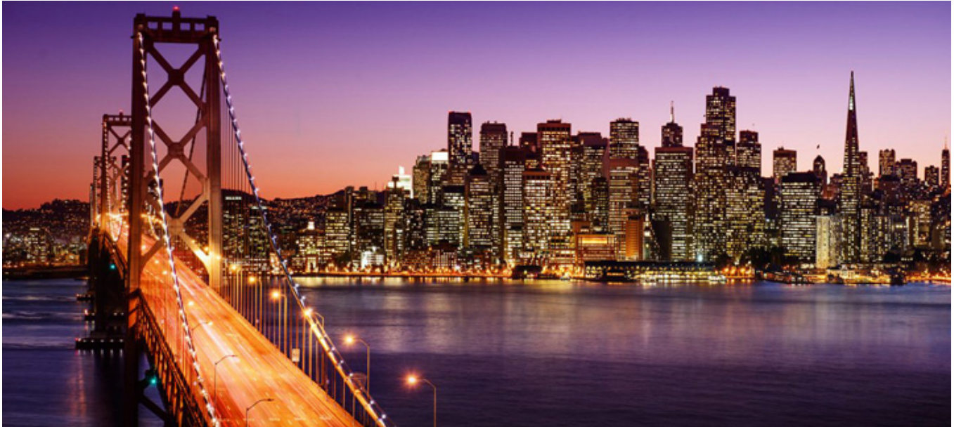
Bay Bridge i widok na San Francisco.