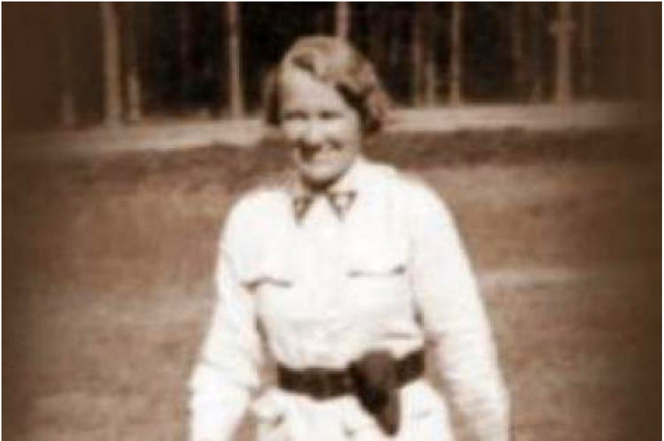
Elżbieta Zawacka, fot. z książki Katarzyny Minczykowskiej „Cichociemna. Generał Elżbieta Zawacka Zo”.

W marcu 1944, gdy Zo groziło aresztowanie, wycofano ją z działalności kurierskiej i przeniesiono do służby w dowództwie Wojskowej Służby Kobiet (WSK). Działając w WSK, brała udział w Powstaniu Warszawskim, a po kapitulacji przedostała się do Krakowa, gdzie odbudowywała zerwaną łączność ze Sztabem Naczelnego Wodza. Zdemobilizowana w lutym 1945 r. dalej pracowała w konspiracji: najpierw w Delegaturze Sił Zbrojnych na Kraj, następnie w Zrzeszeniu Wolność i Niezawisłość. Z działalności antykomunistycznej zrezygnowała w 1946 r., podejmując pracę w Państwowym Urzędzie Wychowania Fizycznego i Przynależenia Wojskowego przy Ministerstwie Obrony Narodowej, z której - ze względów politycznych -