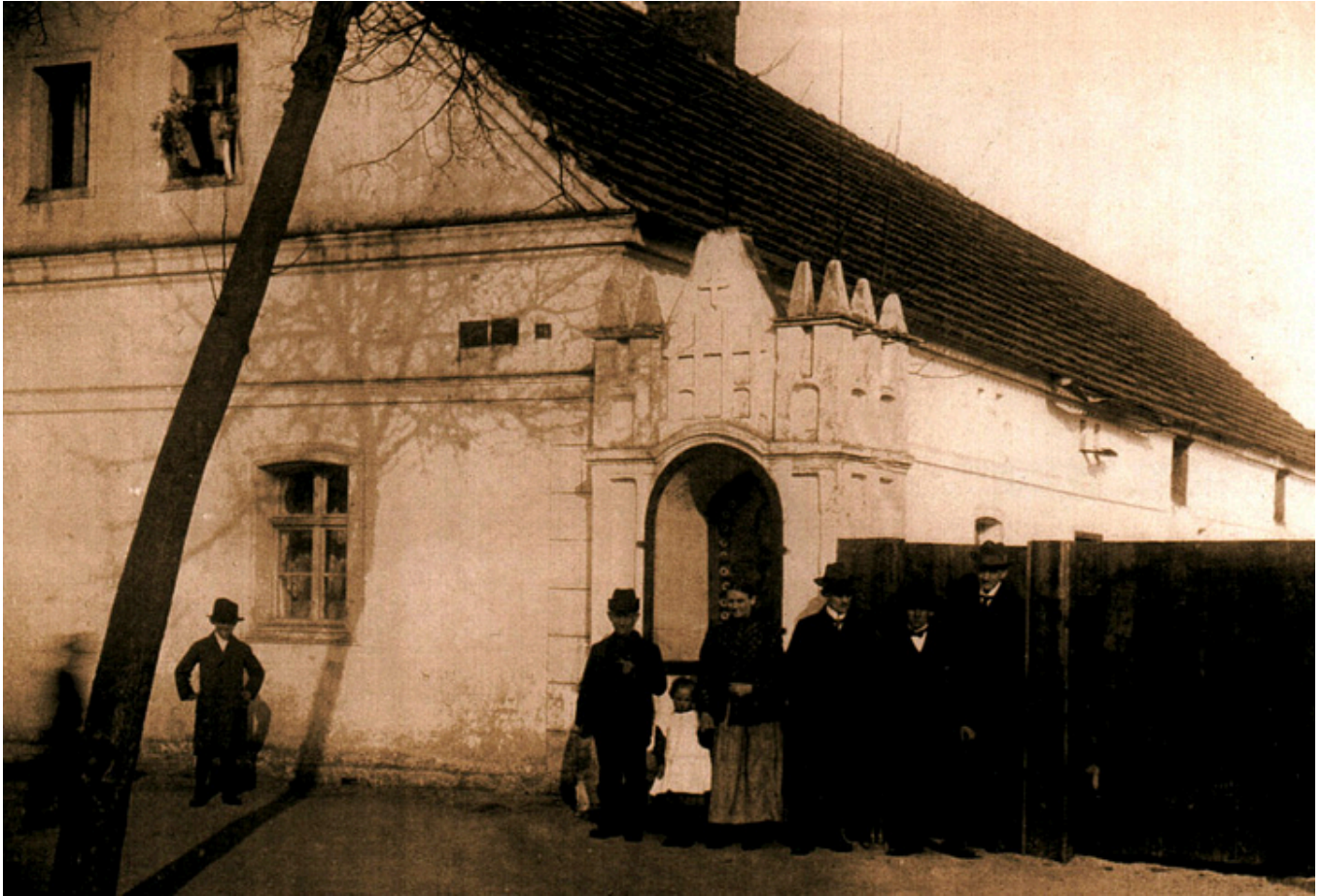
Stare Siołkowice na opolszczyźnie

I jeszcze kilka uwag dotyczących Sebastiana Wosia, czyli Edmunda Saporskiego.