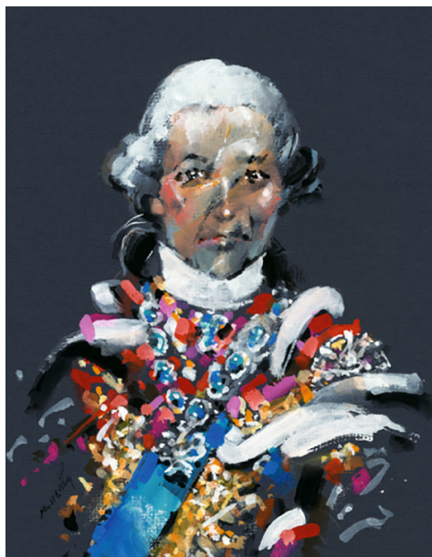
Stanisław August Poniatowski

Początkowo malowanie szło dobrze, po namalowaniu dwudziestu czterech postaci wydano nawet kalendarz ścienny z dwunastoma na 2008 rok. Potem jednak nastąpiła kilkuletnia przerwa w realizowaniu tego wielkiego przedsięwzięcia. Zbliżający się do osiemdziesiątki Waldemar Świerzy zaczął się obawiać, czy danym mu będzie ukończyć rozpoczęte dzieło. W końcu jednak udało się pokonać kłopoty i Profesor mógł kontynuować pracę, lecz wówczas spadł, w czasie przygotowania wystawy swych plakatów w Sopocie, z drabiny i złamał bark. To złamanie mogło oznaczać zakończenie jego artystycznej kariery. Profesor jednak się nie poddał i po kilkumiesięcznej intensywnej rehabilitacji okazało się, że nie tylko powrócił do dawnej formy ale też – jak stwierdzili znawcy – kolejne portrety, poczynając od królowej Jadwigi, były jeszcze lepsze. Malował je szybciej, odważniej i z większą pasją. Gdy pozostali do namalowania już tylko dwaj