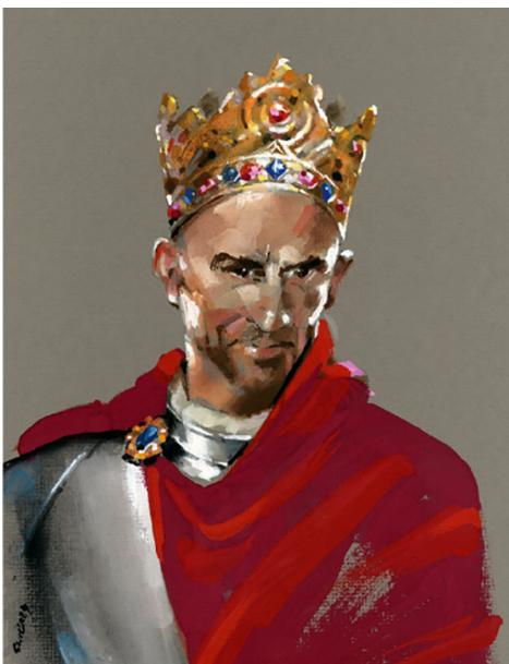
Władysław Jagiełło, autor: Waldemar Świerzy

Do tego poczet Jana Matejki jest niekompletny. Artysta pominął siedmiu nie bardzo wygodnych władców, dodał zaś żony Mieszka I i Mieszka II. W sumie poczet ten liczy 44 jednobarwnych, potem pokolorowanych, ołówkowych rysunków namalowanych przez artystę dla podreperowania domowej kasy, na zamówienie