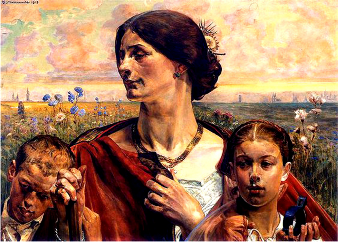
Jacek Malczewski, Ojczyzna, Tryptyk (Prawo, Ojczyzna, Sztuka), 1903 r., olej, deska, 69,5 × 98 cm, Muzeum Narodowe we Wrocławiu.