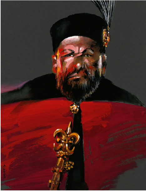
Stefan Batory, autor: Waldemar Świerzy, copyright: Kreacja Pro.