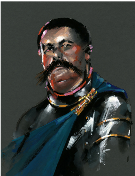
Jan III Sobieski, autor: Waldemar Świerzy