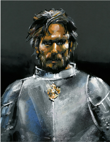
Konrad Mazowiecki