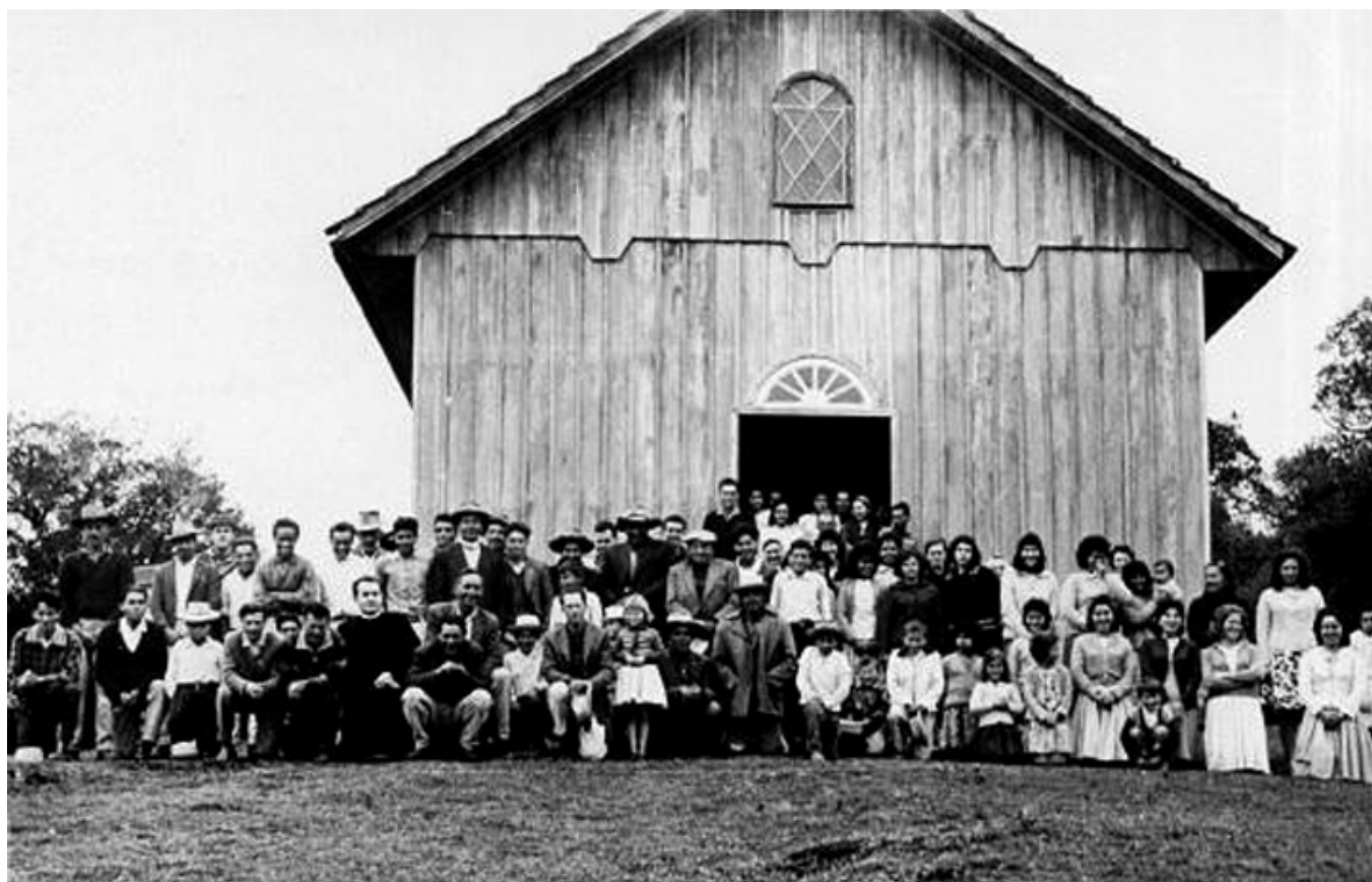
Polscy emigranci, którzy wyemigrowali z Siołkowic do Brazylii w II poł. XIX w.

kolonizacja niemiecka. Tego Siołkowanie nie chcieli, tym bardziej, że w tym stanie panował klimat niemal tropikalny, do którego absolutnie nie byli przystosowani. Osiedleni w kolonii Brusque, którą wcześniej z powodu trudnych warunków opuścili Irlandczycy, przez dwa lata walczyli z dżunglą, aby zdobyć jakiegokolwiek środki do przeżycia.