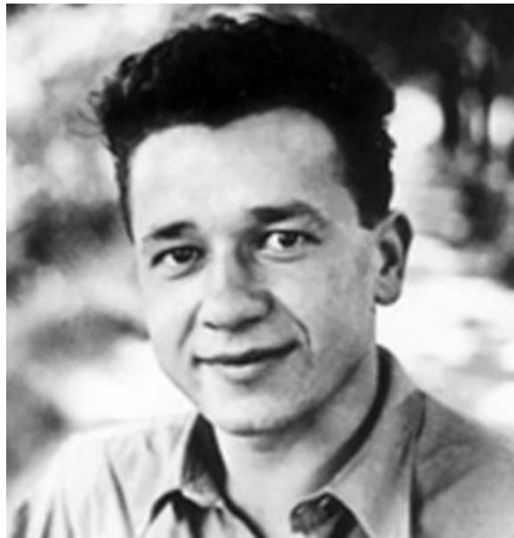
Tadeusz Borowski