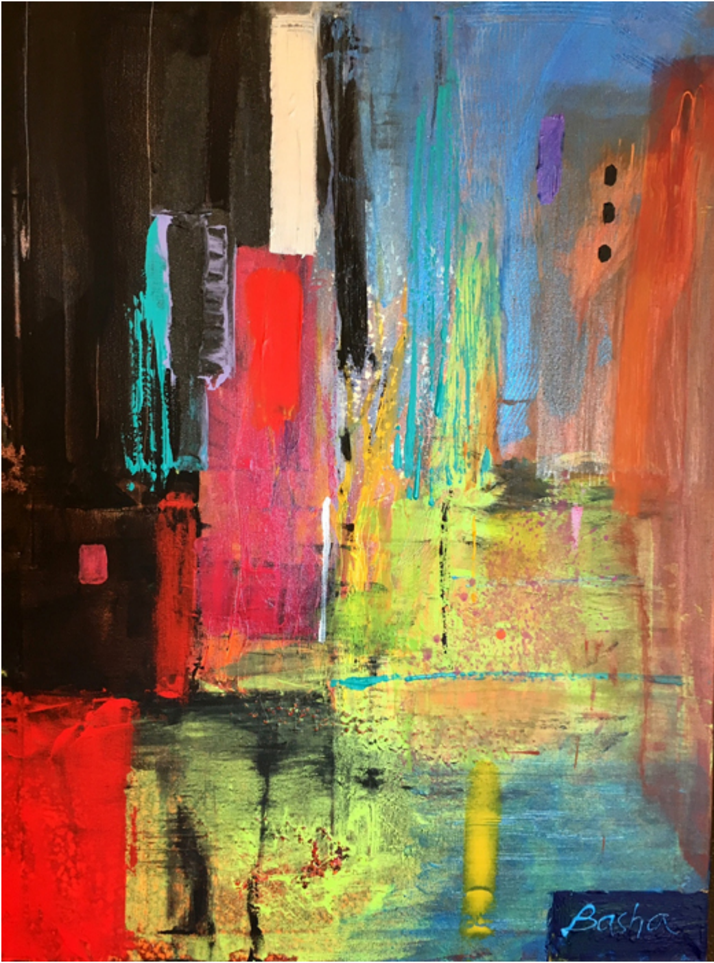
TWILIGHT, 42×32 inches.