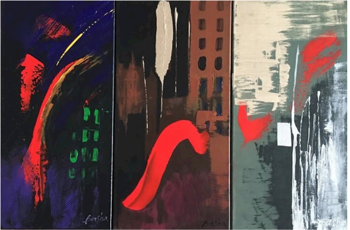
MEMORIES, Tryptich, acrylic on canvas, 18x 24 inches.