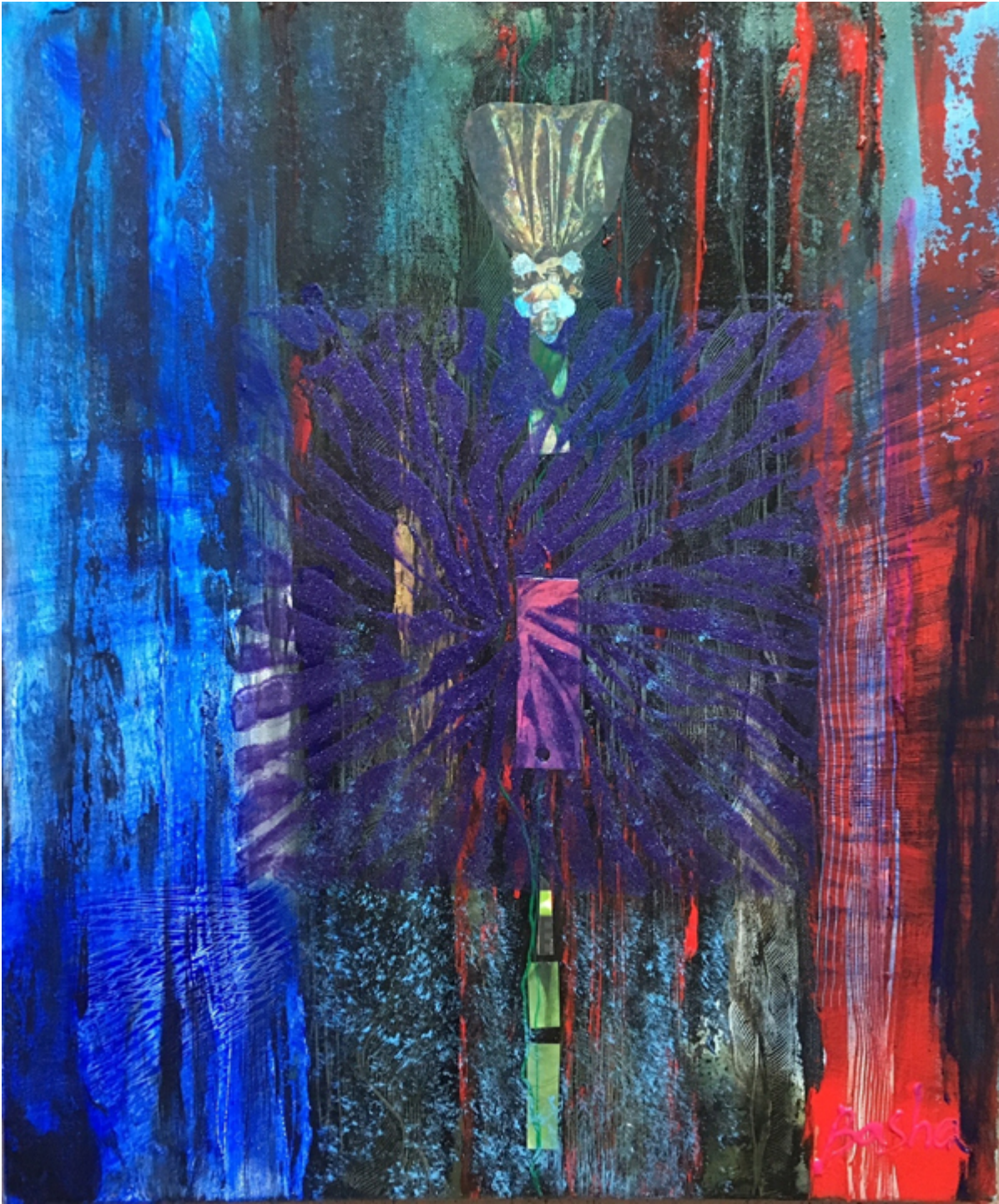
NIGHT VISION, mixed media on canvas, 24×20 inches.