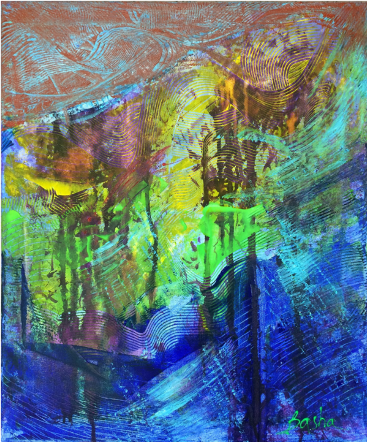
NEW CURRENT, acrylic on canvas, 24×20 inches.