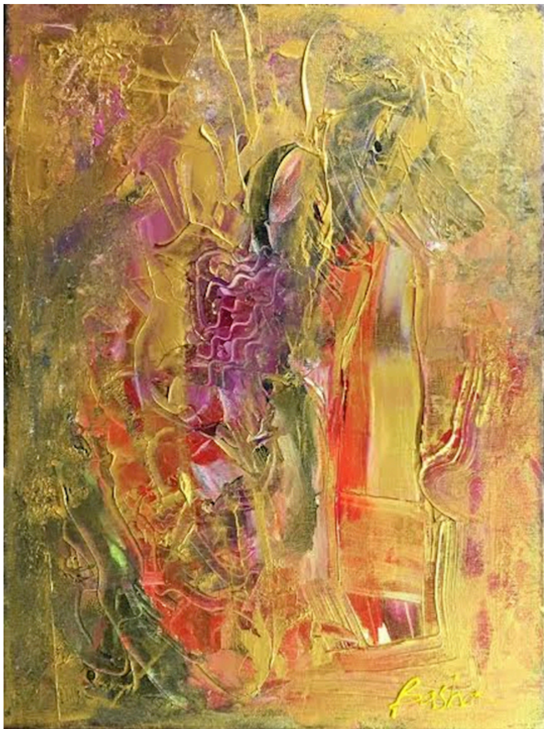
Basha Maryanska, GOLDEN THOUGHTS, acrylic on canvas, 30×24 inches.

Warszawy. W Beacon, NY i w Larkspur, Colorado została część prac w bardzo dużych formatach, ze względu na szalone koszty transportu. Wystawa w Warszawie została jednak tak zaprojektowana, aby miała bardzo podobną wymowę.