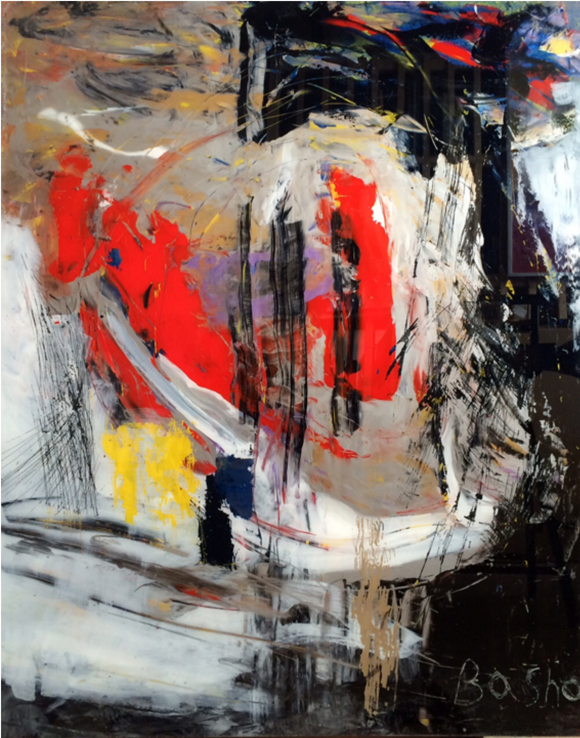
SEARCHING, acrylic on the reverse side of plexiglass, 48×38 inches.