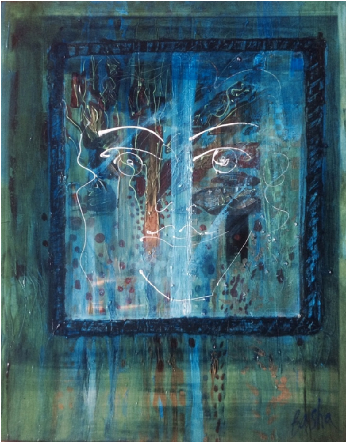
DREAM ABOUT MYSELF, acrylic on canvas, 30×24 inches.