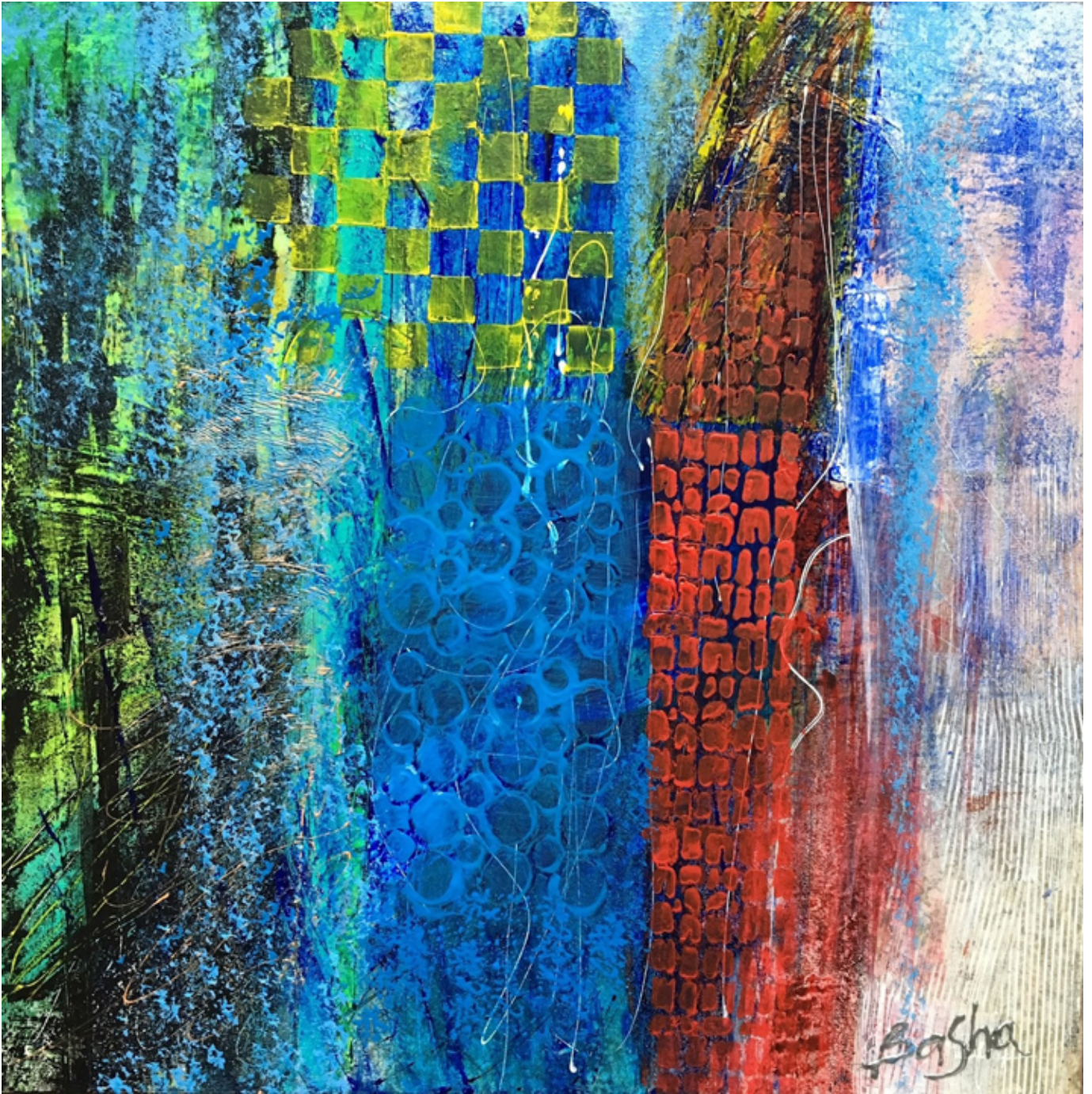
CITY E-SCAPE, acrylic on canvas, 24×24 inches.