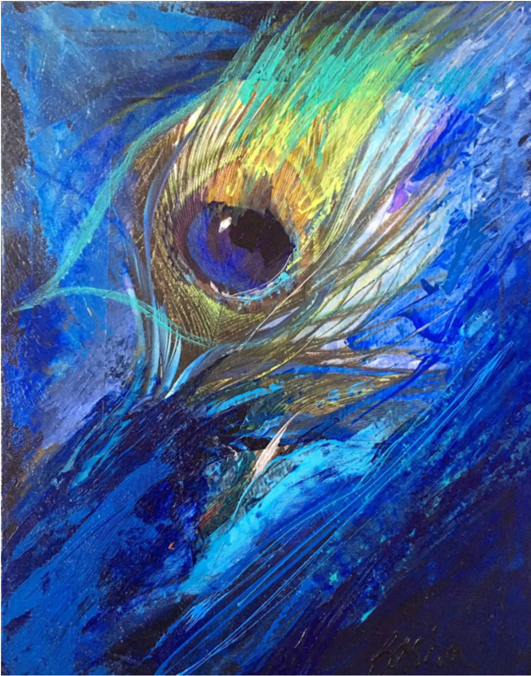
PEACOCK EYE - MY PORTRAIT 2015, 24×18 inches.