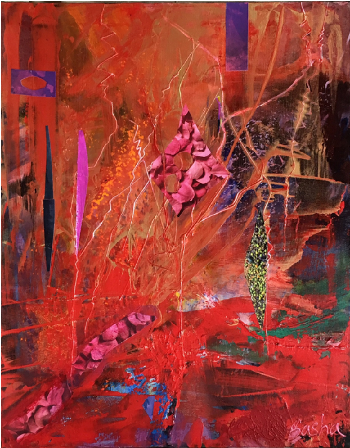
BUSY DAY, mixed media on canvas, 24×18 inches.