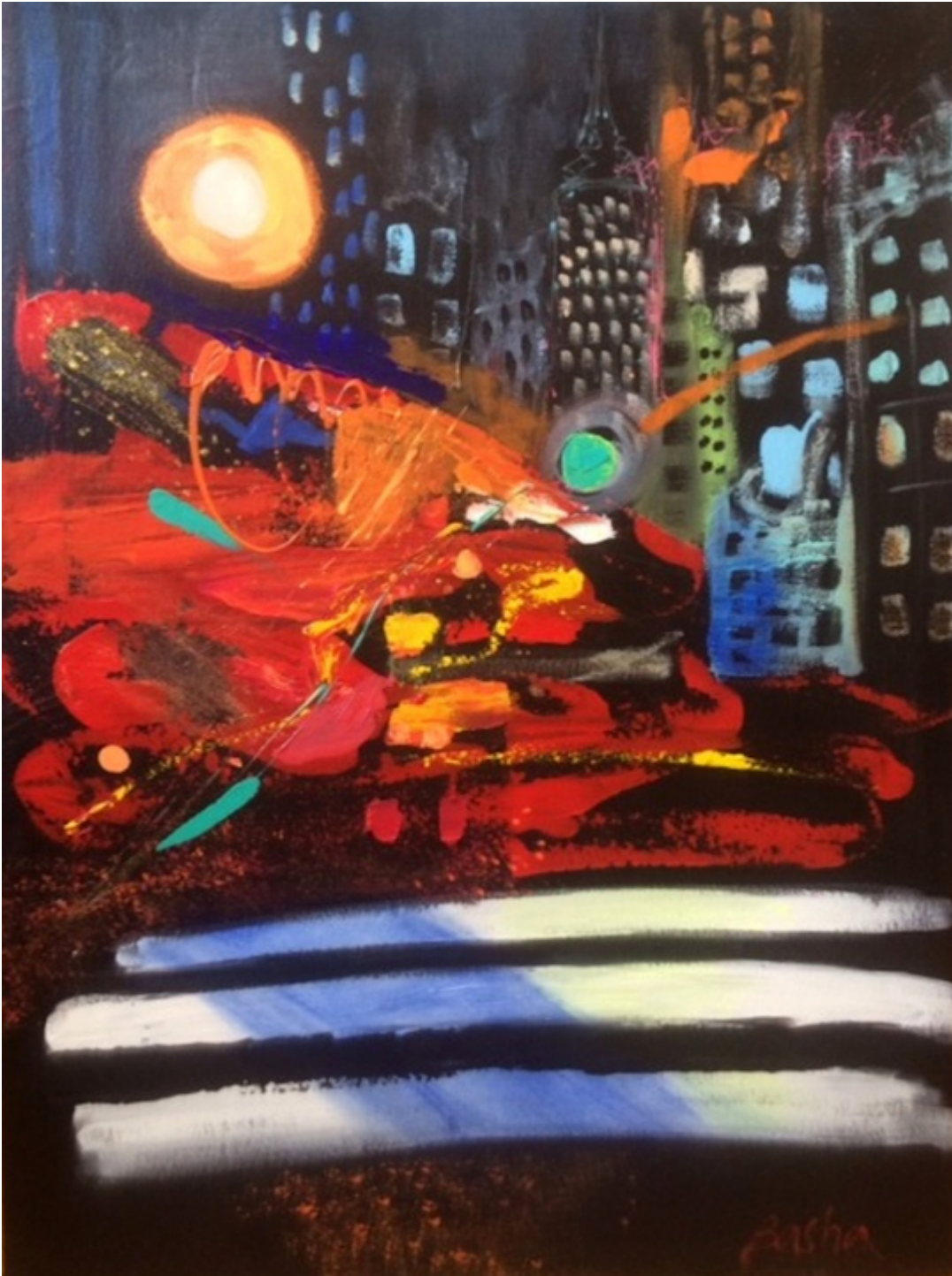
CITY DREAMS, acrylic on canvas, 40×30 inches.