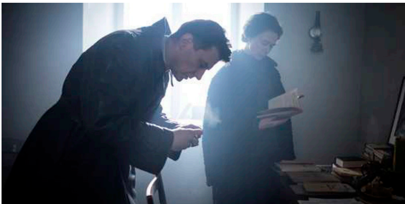
Kadr z filmu „Zaćma” w reżyserii Ryszarda Bugajskiego, fot. Jacek Drygała.

JSG: Świat, który Pan kreuje na ekranie nie jest czarno-biały, lecz zbudowany z różnych odcieni szarości. Dobro może mieć ryse, a zło może mieć psychologiczne wytłumaczenie swojego istnienia. Czy można dojrzeć granicę pomiędzy tymi przeciwstawnymi pojęciami?