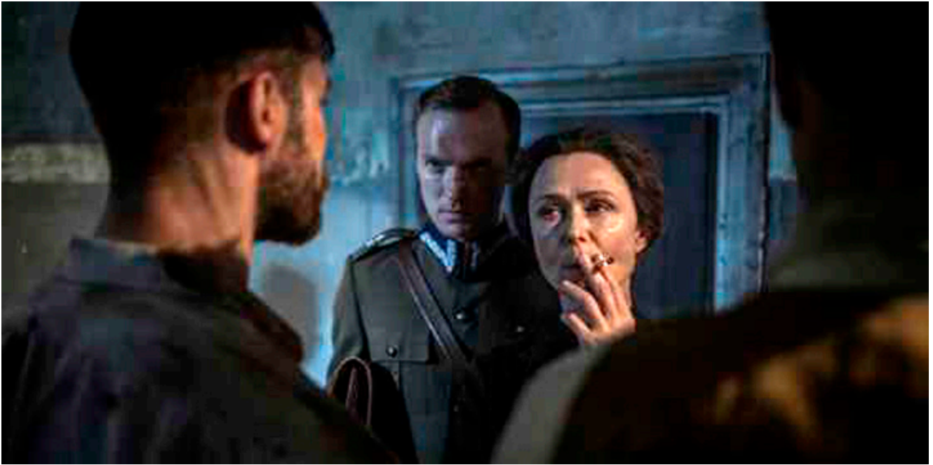
Kadr z filmu „Zaćma” w reżyserii Ryszarda Bugajskiego, fot. Jacek Drygała.