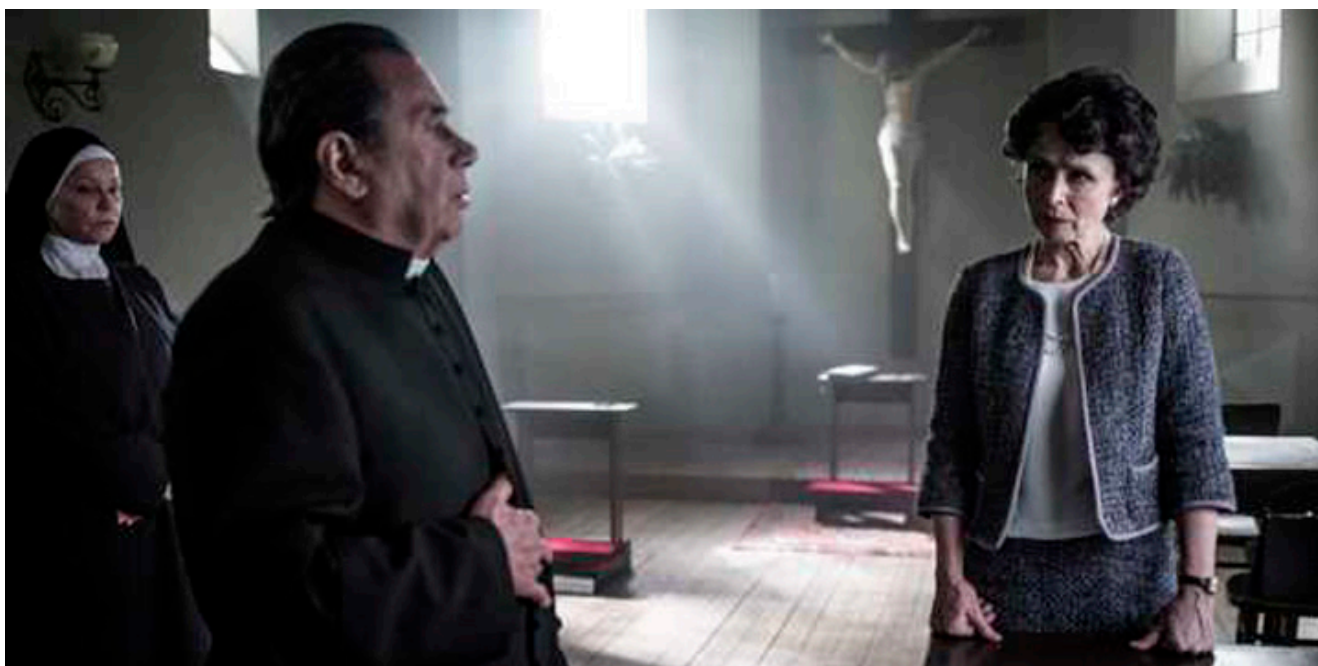
Kadr z filmu „Zaćma” w reżyserii Ryszarda Bugajskiego, fot. Jacek Drygała.

samym nabiera dramatycznego wyrazu i staje się bardziej osobista.