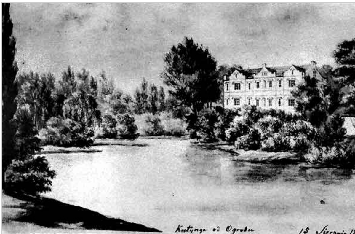
Kretynga według Napoleona Ordy.