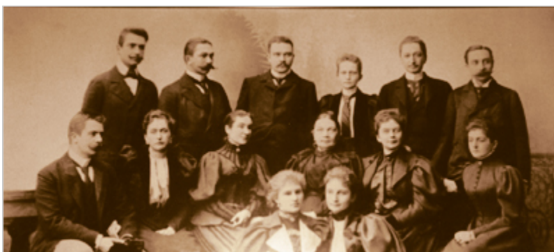
Tyszkiewiczowie, portret rodzinny wiszący w pałacu w Kretyndze

zwyczaju, ku niezadowoleniu tych najmłodszych. Choinka urządzana była tylko dla dzieci służby. Przeznaczano na ten cel pieniądze, które do dyspozycji dostawały już miesiąc wcześniej młode panny Tyszkiewiczówny. Miały one zrobić listę dzieci, przewidzieć co im najbardziej potrzeba i z czego się ucieszą i przygotować prezenty. Choinkę ogromnej wielkości ustawiano w Ogrodzie Zimowym. Przyozdabiana mnóstwem zabawek, świecidełek i lampek, a na końcu owijana od góry do dołu cieniutkimi, złotymi nićmi, tworzącymi mieniącą się sieć, wyglądała imponująco. Dzieci służby czekały na dole ogrodu, aż się je zawoła na rozdanie prezentów.