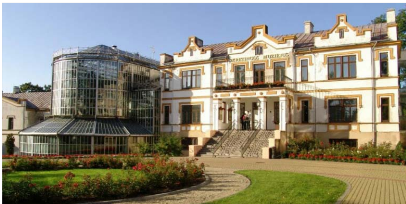
Kretynka, po lewej stronie pałacu Ogród Zimowy

dochodziła do wysokości drugiego piętra. Tę samą wysokość osiągały liczne palmy sprowadzone z Afryki. Ogród Zimowy oświetlony był trzema łukowymi lampami elektrycznymi, dla których hr Józef wybudował elektrownię poruszaną turbiną wodną podczas jesiennej słyoty, a parą wodną uzyskaną z opalanego drzewem lub torfem wielkiego kotła, podczas zimy. Z czasem lampy łukowe zamieniono na żarówki.