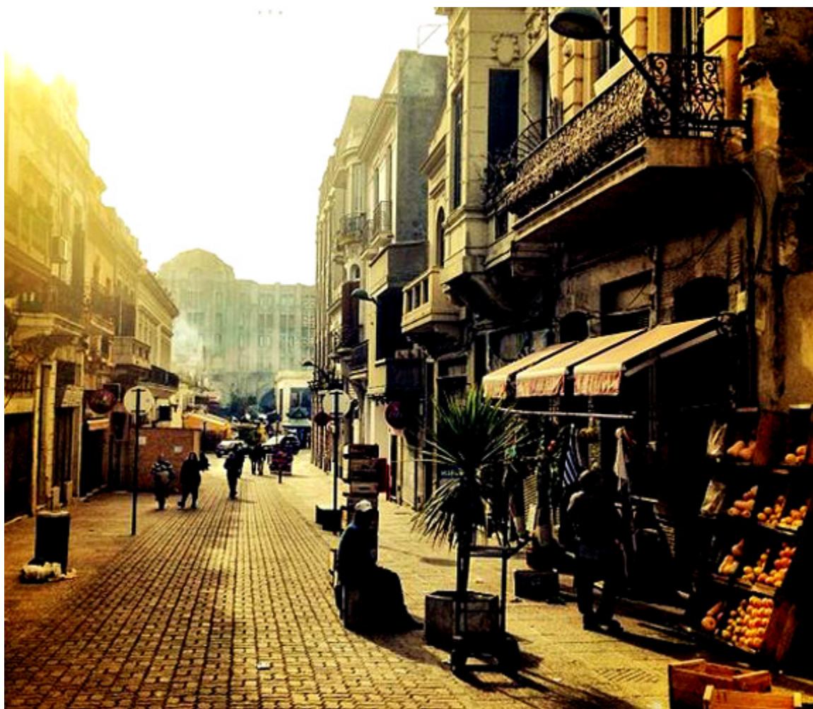
Urugwaj, Montevideo

- sąd, orzeczenie, słowo); mierda - (gówno); permiso - pozwolenie); municipio (magistrat); komedor ( comedor - jadalnia, posiłki); amigowie ( amigo - przyjaciel); importancia (ważność); eukalipta ( eucalipto - drzewo eukaliptusowe); tinta (farba, barwa); kwadra ( cuadra - blok domów); konfiterya ( confitería - cukiernia); kolaborator ( colaborador - kolaborant, współpracownik); zapaty ( zapato - but); kontra i rekontra ( contra y recontra ).