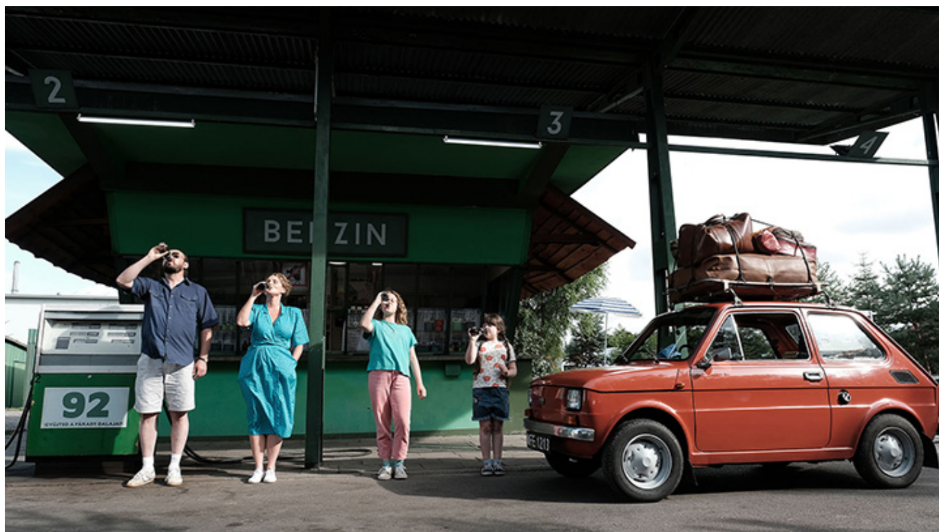
„Zupa Nic”, reż. Kinga Dębska