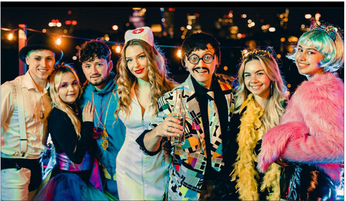
„Czarna owca”, reż. Aleksander Pietrzak, fot. Jaroslaw Sosiński / TVN Grupa Discovery