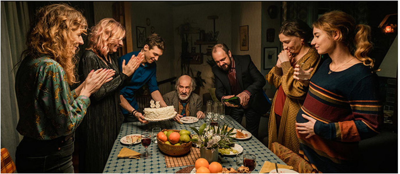
„Czarna owca”, reż. Aleksander Pietrzak