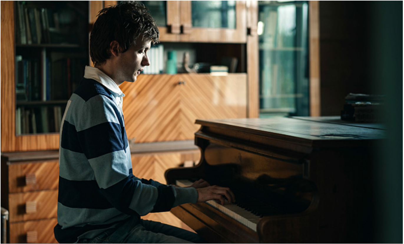
„Sonata”, reż. Barosz Blaschke, fot. Jaroslaw Sosiński/MEDIABRIGADE