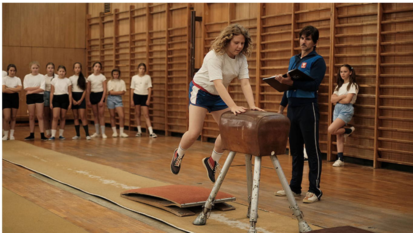
„Zupa Nic”, reż. Kinga Dębska