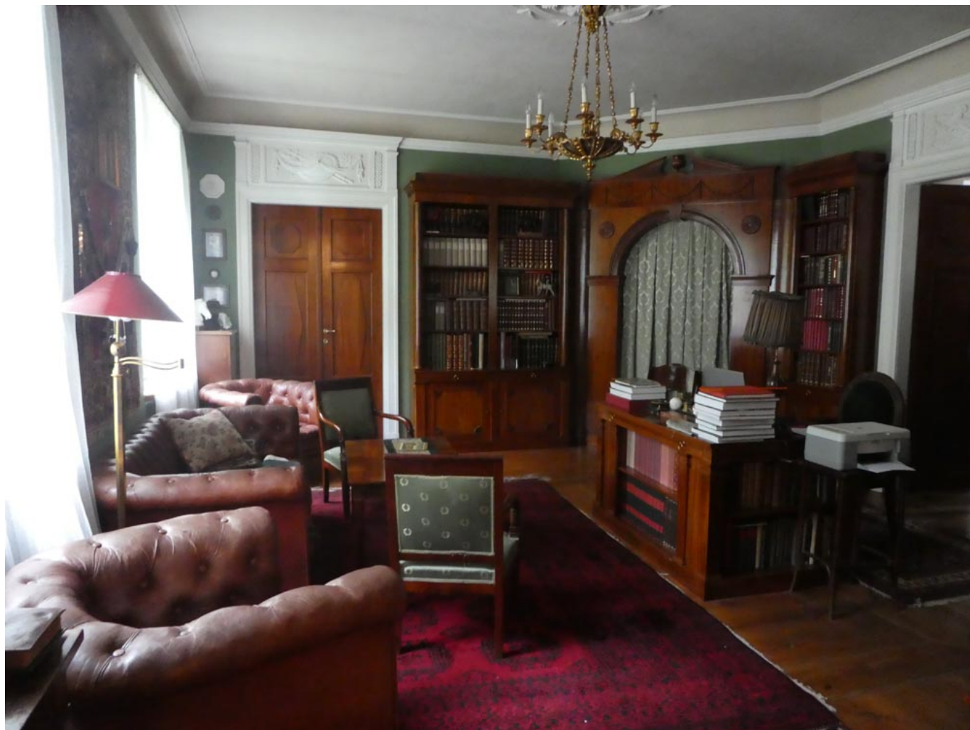
Gabinet w dworze w Tułowicach