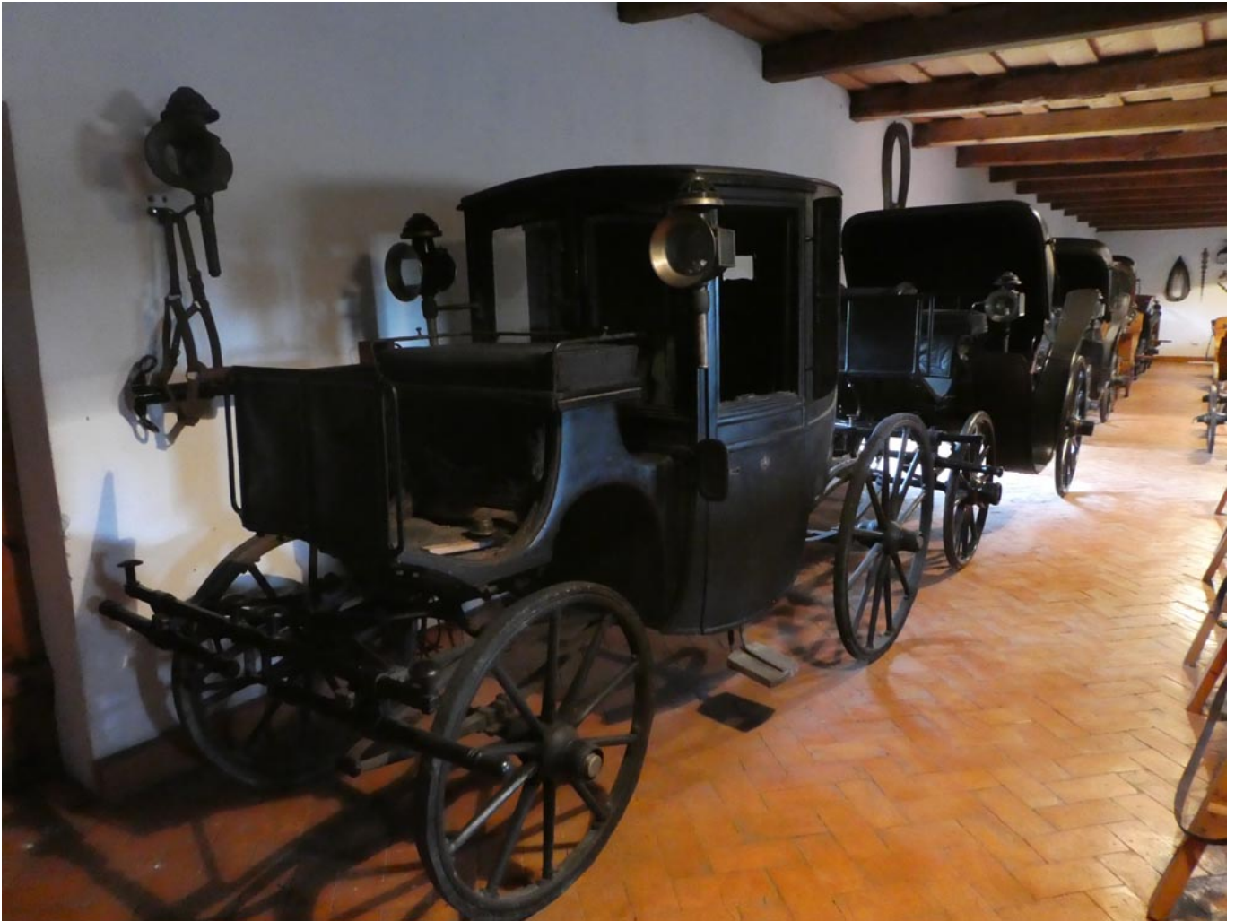
Powozownia w Tułowicach