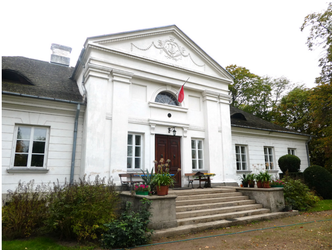
Dwór w Tułowicach dziś