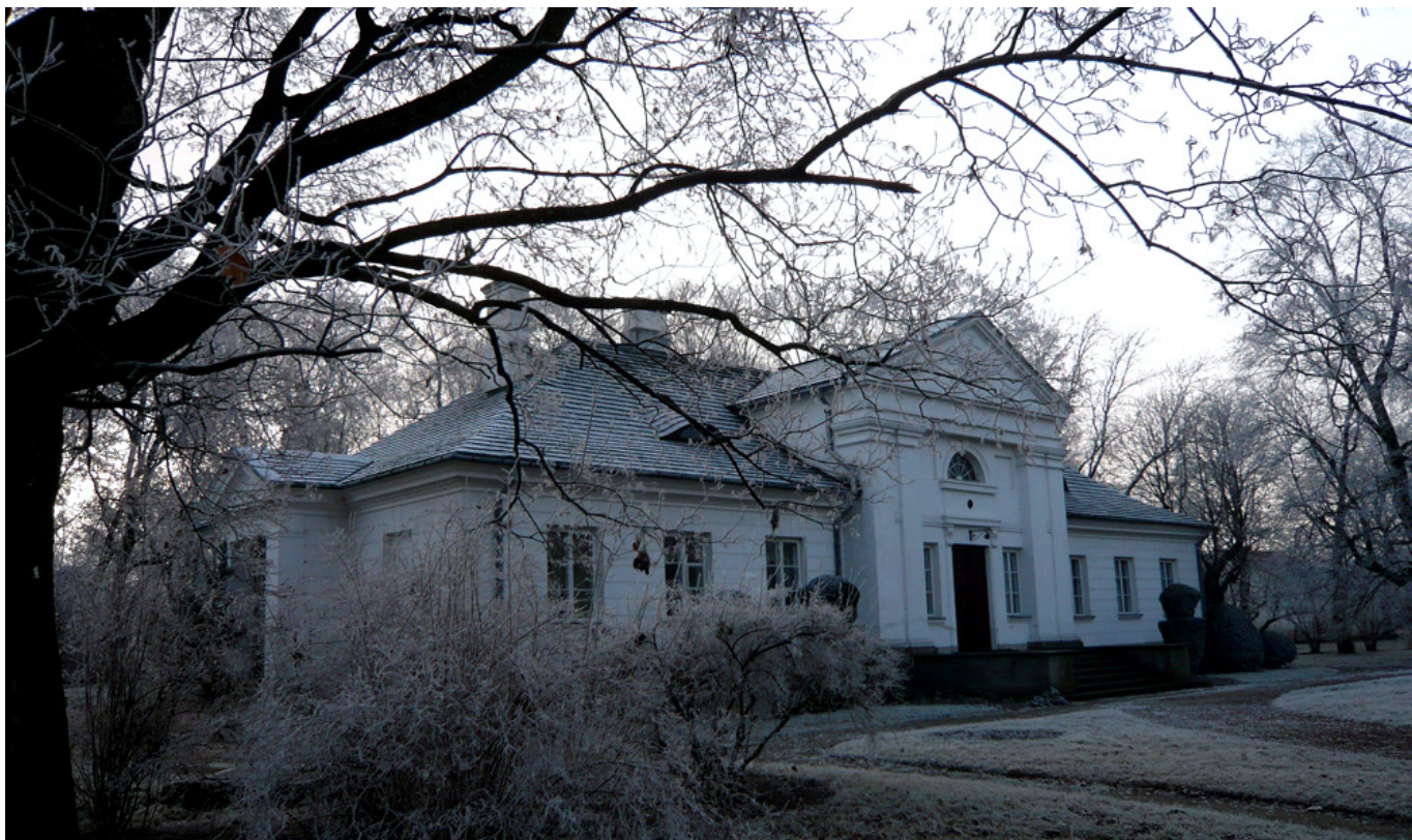
Dwór w Tułowicach zimą, fot.arch. A. Novák-Zemplińskiego

ANZ: Święta są jak najbardziej tradycyjne i bardzo rodzinne. Choinka do sufitu bogato ubrana, opłatek, biały obrus i pod nim sianko oraz tradycyjne, świąteczne potrawy. Oczywiście też kolędy. Przy stole wigilijnym w Tułowicach gromadzą się już cztery pokolenia.