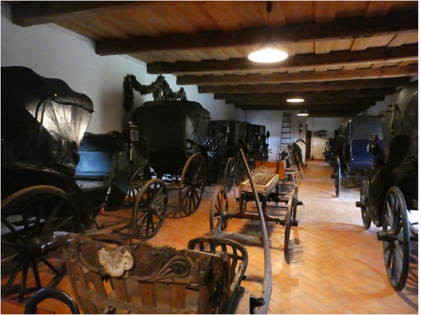
Powozownia w Tułowicach