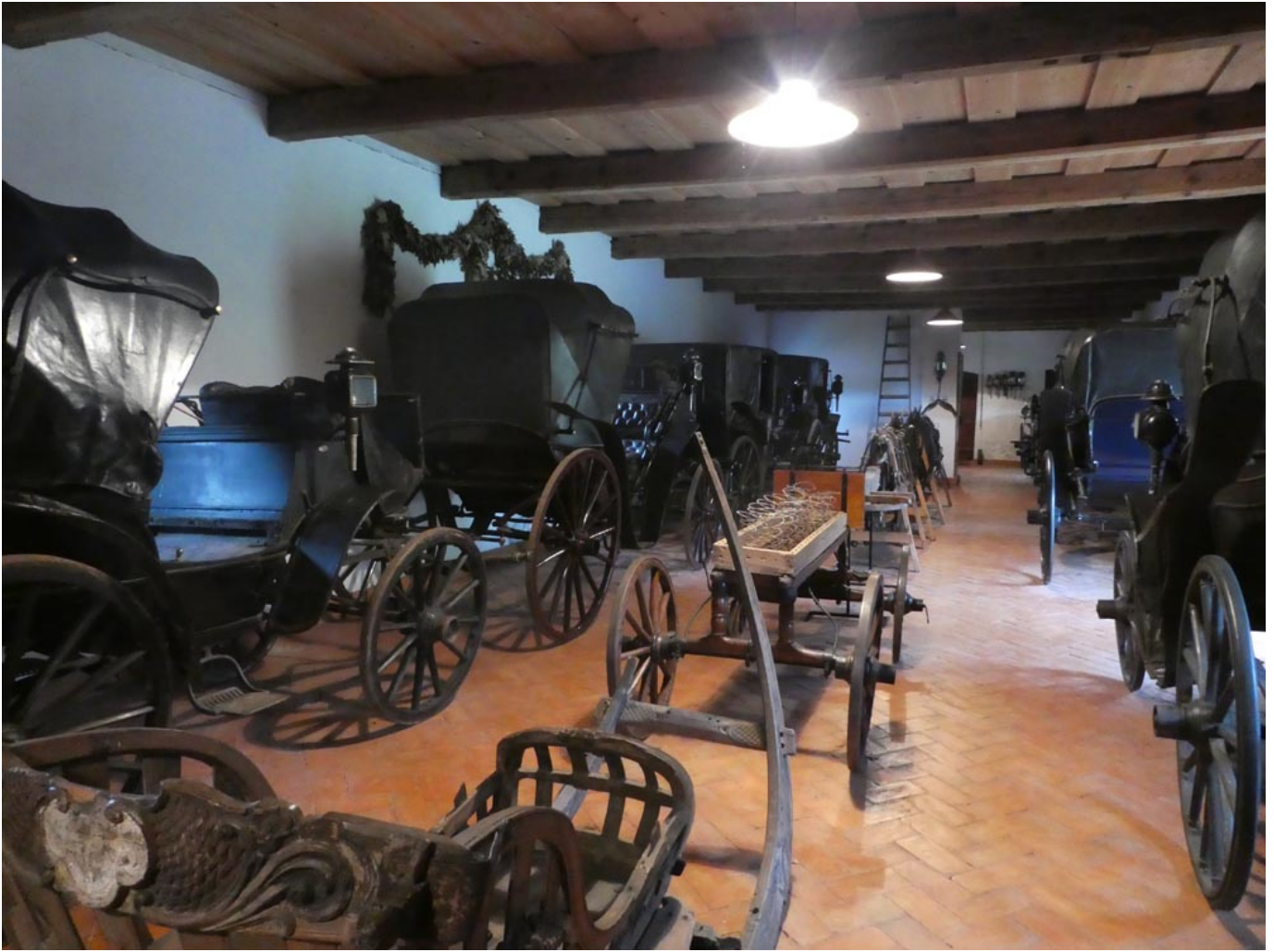
Powozownia w Tułowicach