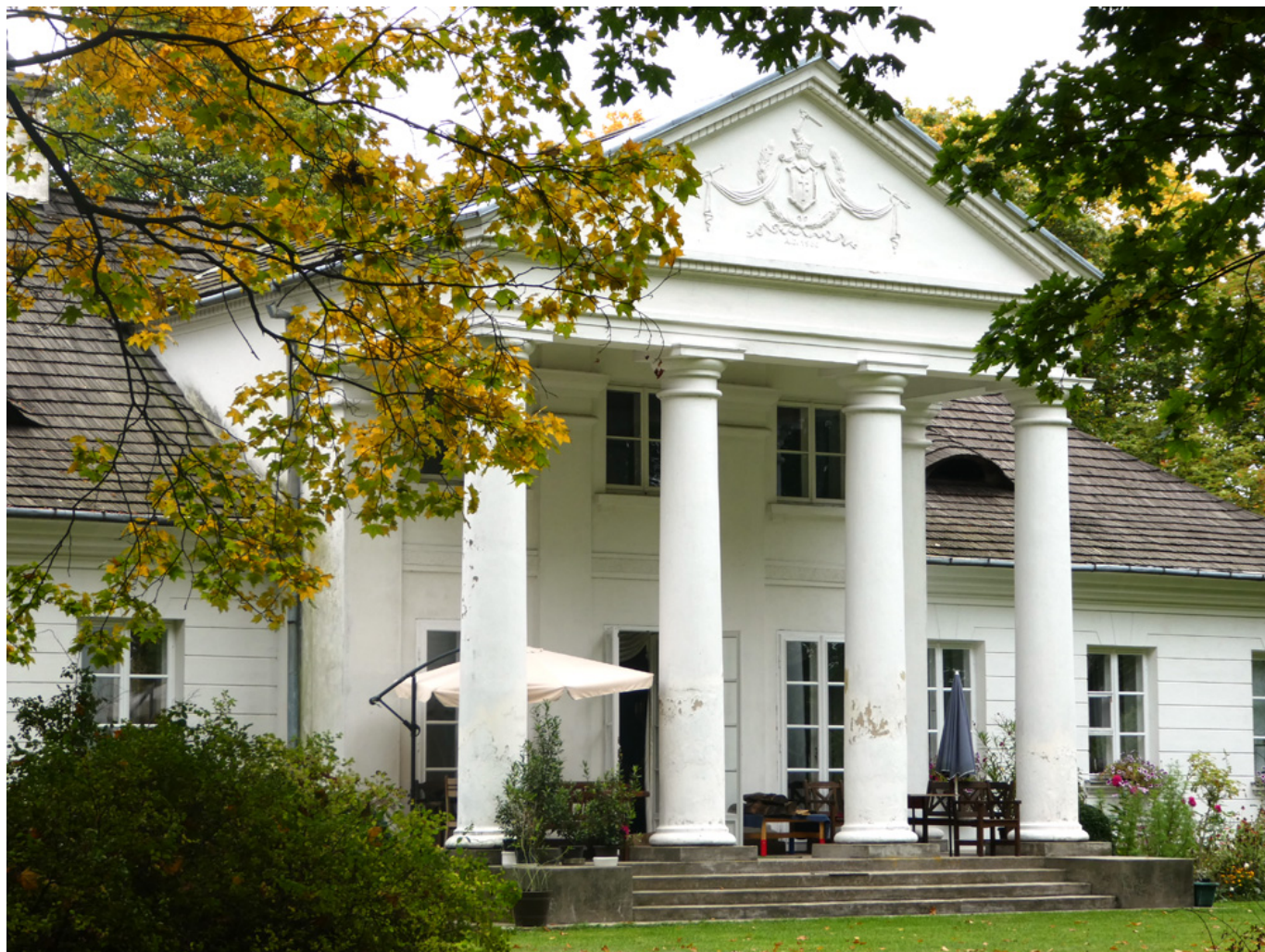
Dwór w Tułowicach dziś, fot. Marcin Sokołowski