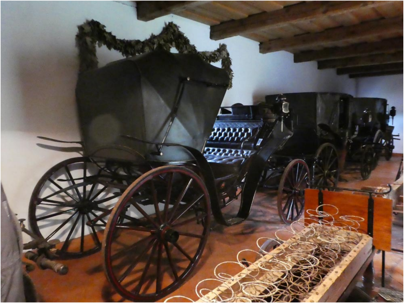
Powozownia w Tułowicach