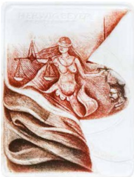
Herwig Beyer 1987 r.