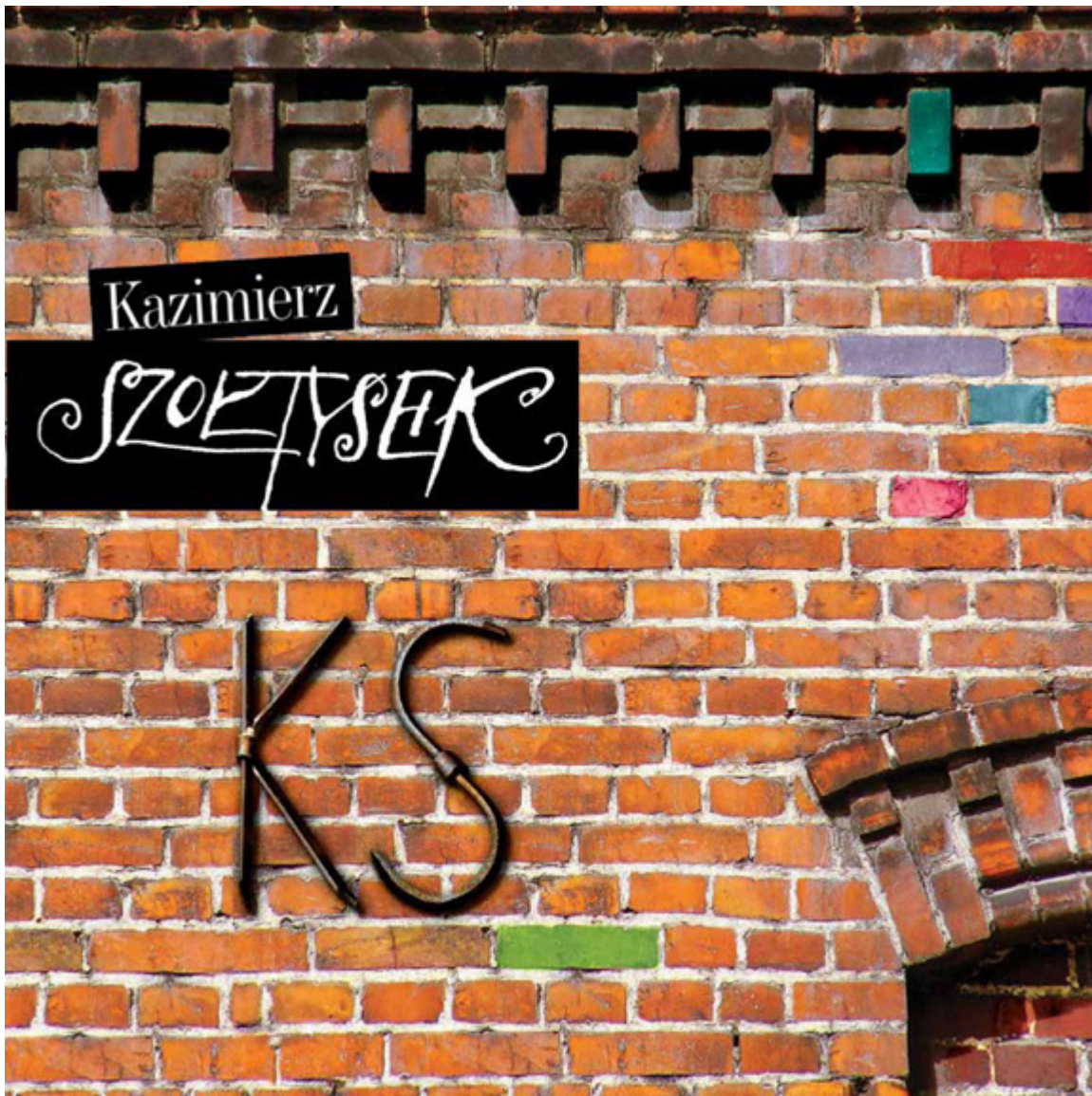
Album Kazimierza Szołtyśka z okazji 40-lecia pracy artystycznej