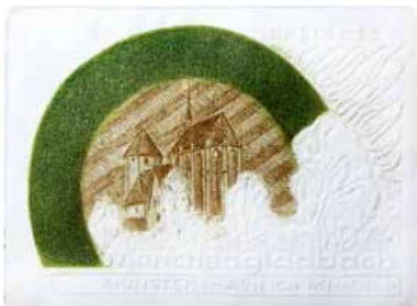
Mönchengladbach Münster 1993 r.