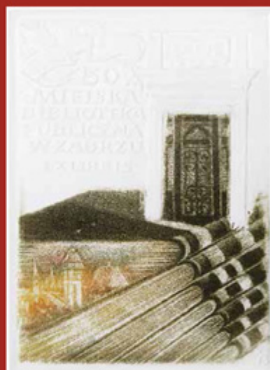
Miejska Biblioteka Publiczna w Zabrzu Öffentliche städtische Bibliothek in Zabrze 1995 | intaglio

Album Kazimierza Szołtyśka z okazji 40-lecia pracy artystycznej