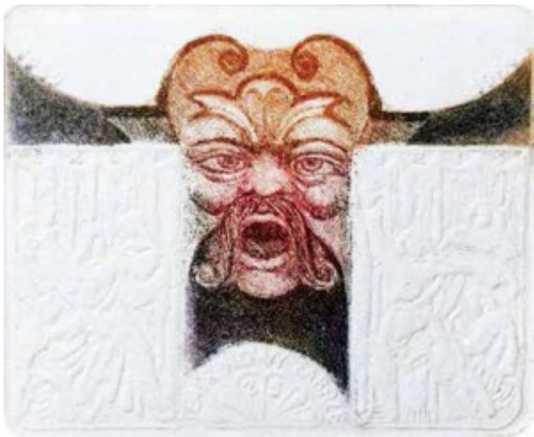
Teatr Nowy w Zabrzu 1994 r.