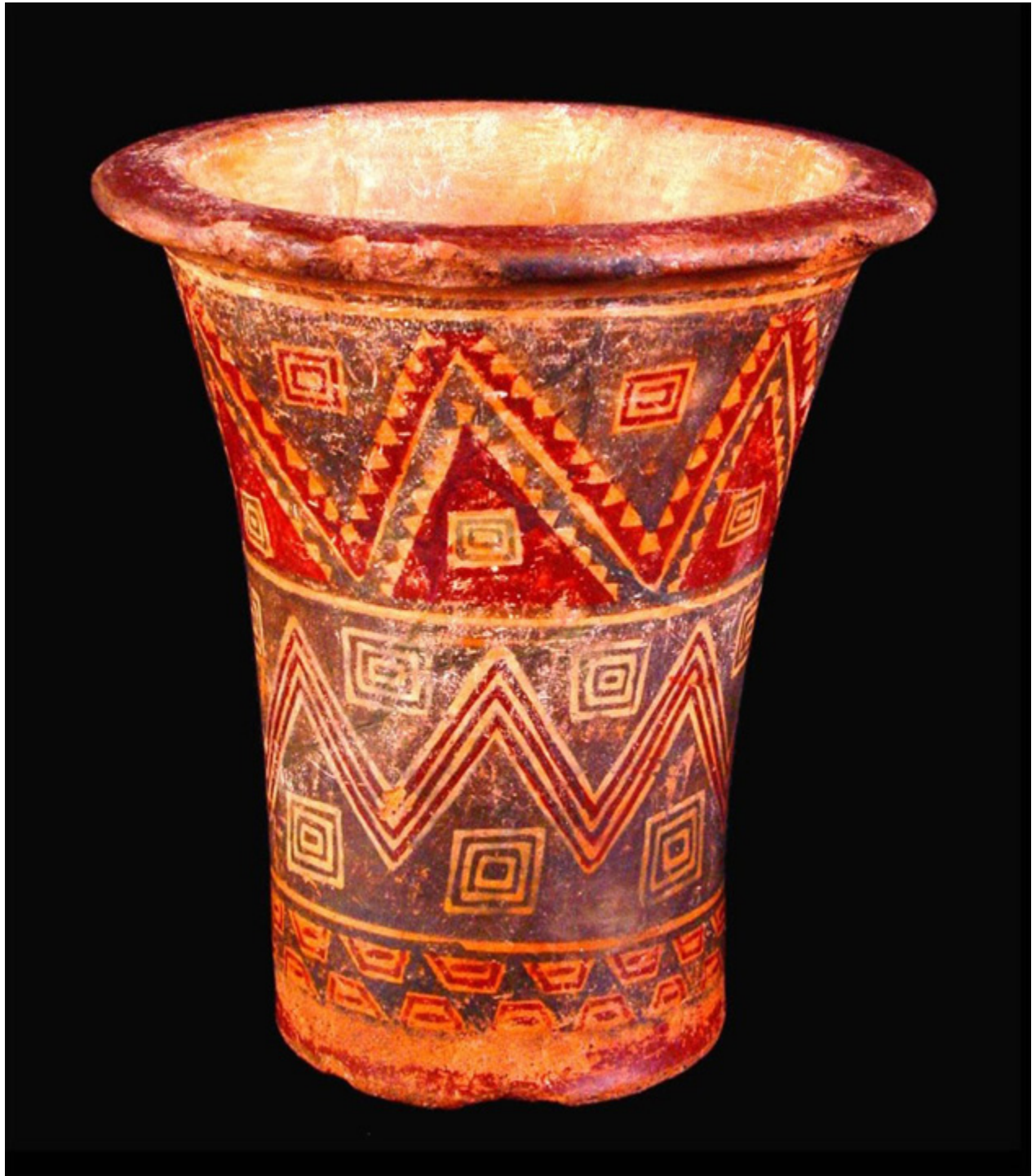
Kero. Ceremonialne naczynie inkaskie