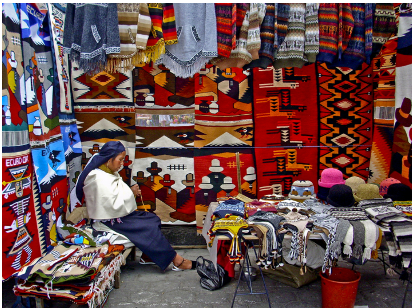
Targ w Otavalo. Indianka szyje i sprzedaje

bolesne wspomnienia z naszego kraju. Podczas kolacji w małej knajpce, a potem także przy innych posiłkach, zwróciliśmy uwagę, że kawę w Ekwadorze serwują w szklanych karafkach. Wchodzili tam co jakiś czas Indianie, by zjeść ukradkiem i w pośpiechu pozostawione przez konsumentów resztki jedzenia. Widok zaiste przykry!