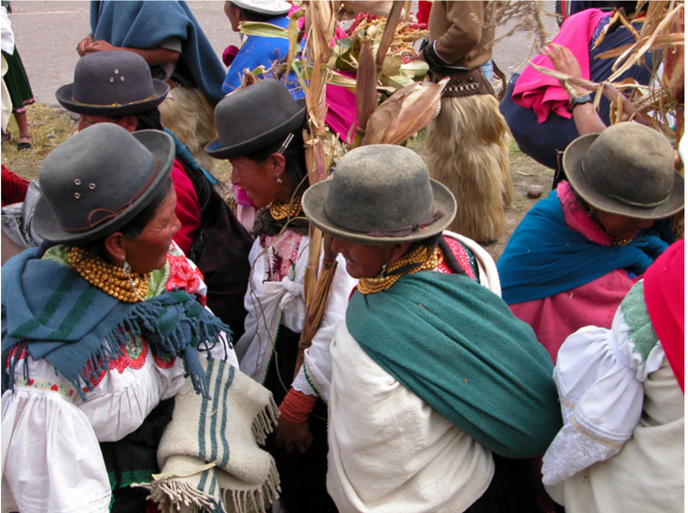
Odpust nad jeziorem San Pablo

Po spędzeniu właściwie tylko jednego popołudnia w Quito , nazajutrz udaliśmy się do odległego o jakieś 80 km na północ miasteczka Otavallo . Znane jest w całej Ameryce ze sztuki ludowej mieszkających tam Indian, którzy nadal mówią językiem zwanym quechua lub quichua , najważniejszym i oficjalnym językiem Imperium Inków. Jego północny kraniec sięgał jeszcze dalej, aż poza granicę dzisiejszej Kolumbii , do regionu Pasto . Jechaliśmy zdezelowanym autobusem wypełnionym tłumem Indian. Ci biedni ludzie nie mają odpowiednich warunków do utrzymania higieny, toteż zaduch, by nie powiedzieć fetor,