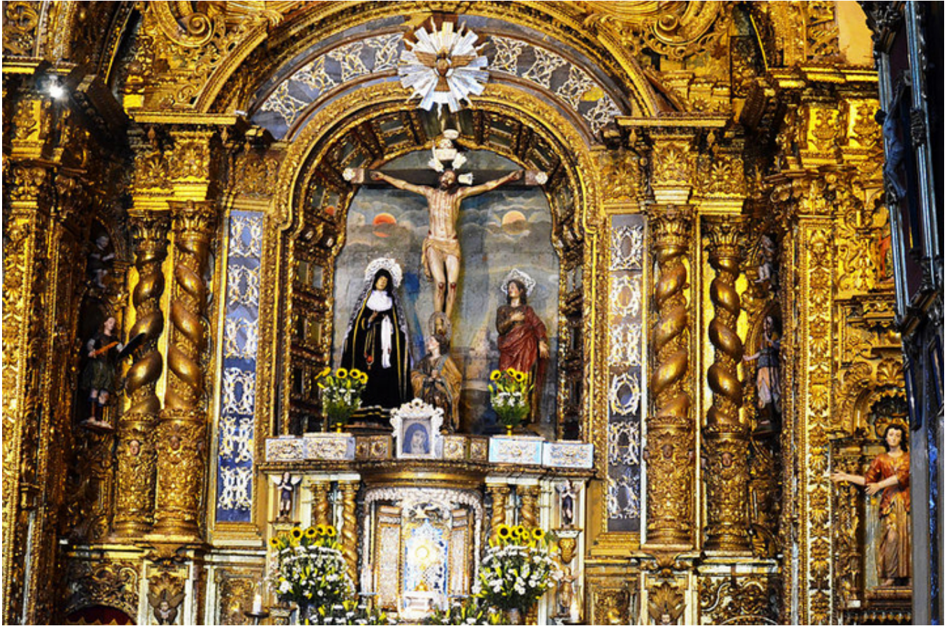
Quito. Ukrzyżowanie w kaplicy Cantuña