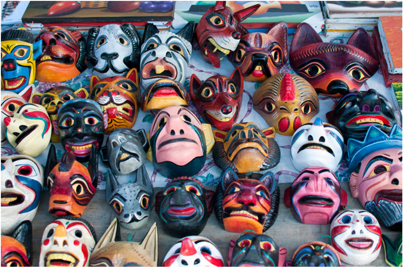
Maski w Otavalo