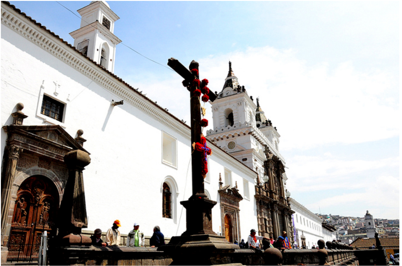
Quito. Kościół św. Franciszka