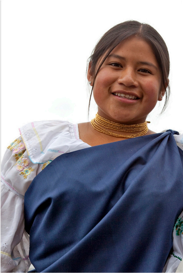
Dziewczyna z Otavalo

Typowy strój Indianki z Otavalo to biała haftowana obszerna bluzka z dodatkowym kolorowym niebiesko-żółto-czerwonym haftem kwiatowym na piersiach i ramionach, no i właśnie owe „piętrowe” dosłownie zwoje tych złotych czechosłowackich paciorków na szyi. Targ bynajmniej nie ogranicza się do ozdób i rzemiosła artystycznego. Wielu Indian mieszkających w okolicznych wioskach na stokach gór znosi do Otavalo swoje produkty rolne, w tym wielkie snopy siana dla zwierząt i inne płody ziemi. Poza tym cała duża część targowiska to szereg małych knajpek oferujących rozmaite, na ogół pikantne, ostro