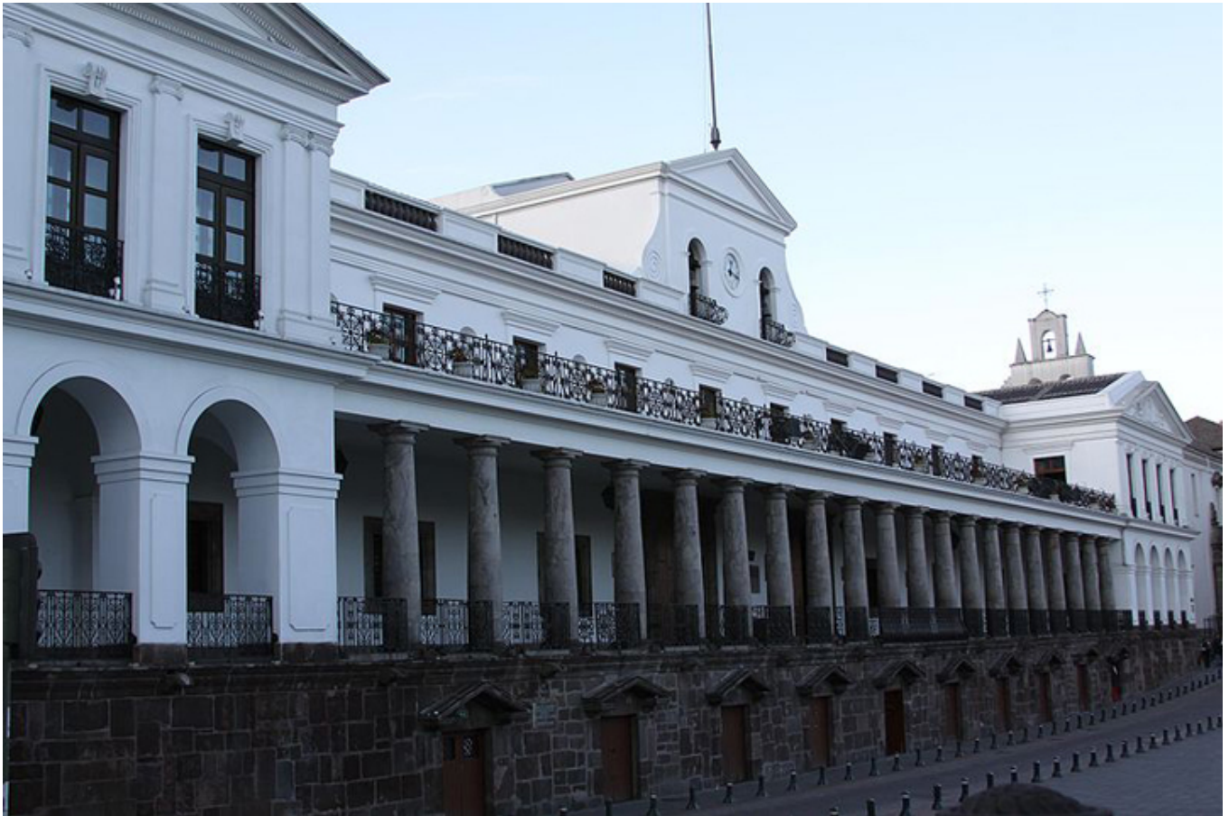
Quito. Pałac Prezydencki