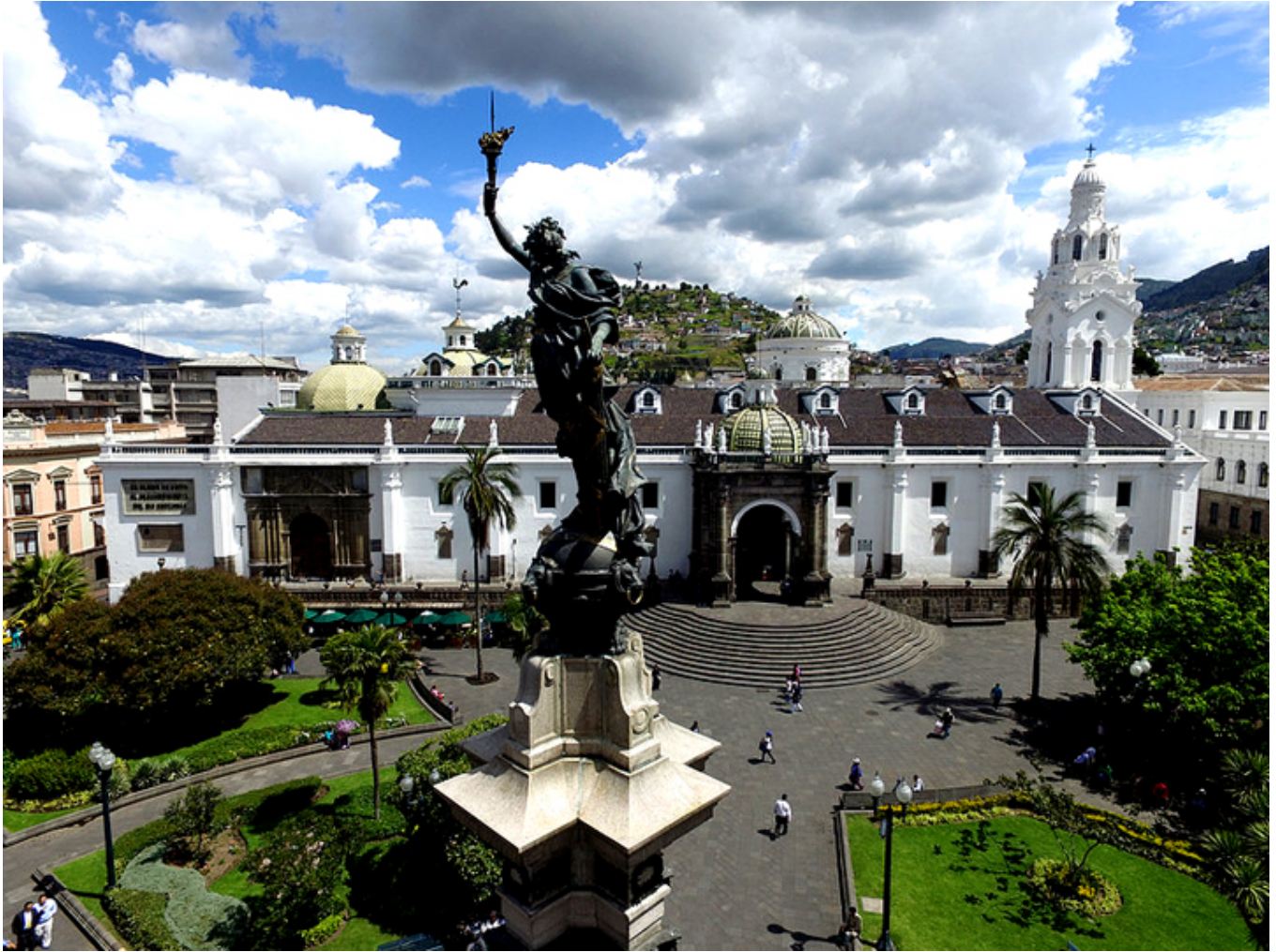
Quito. Plac Niepodległości z Katedrą w głębi