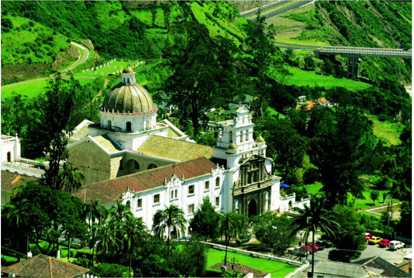
Guápulo w dolinie pod Quito