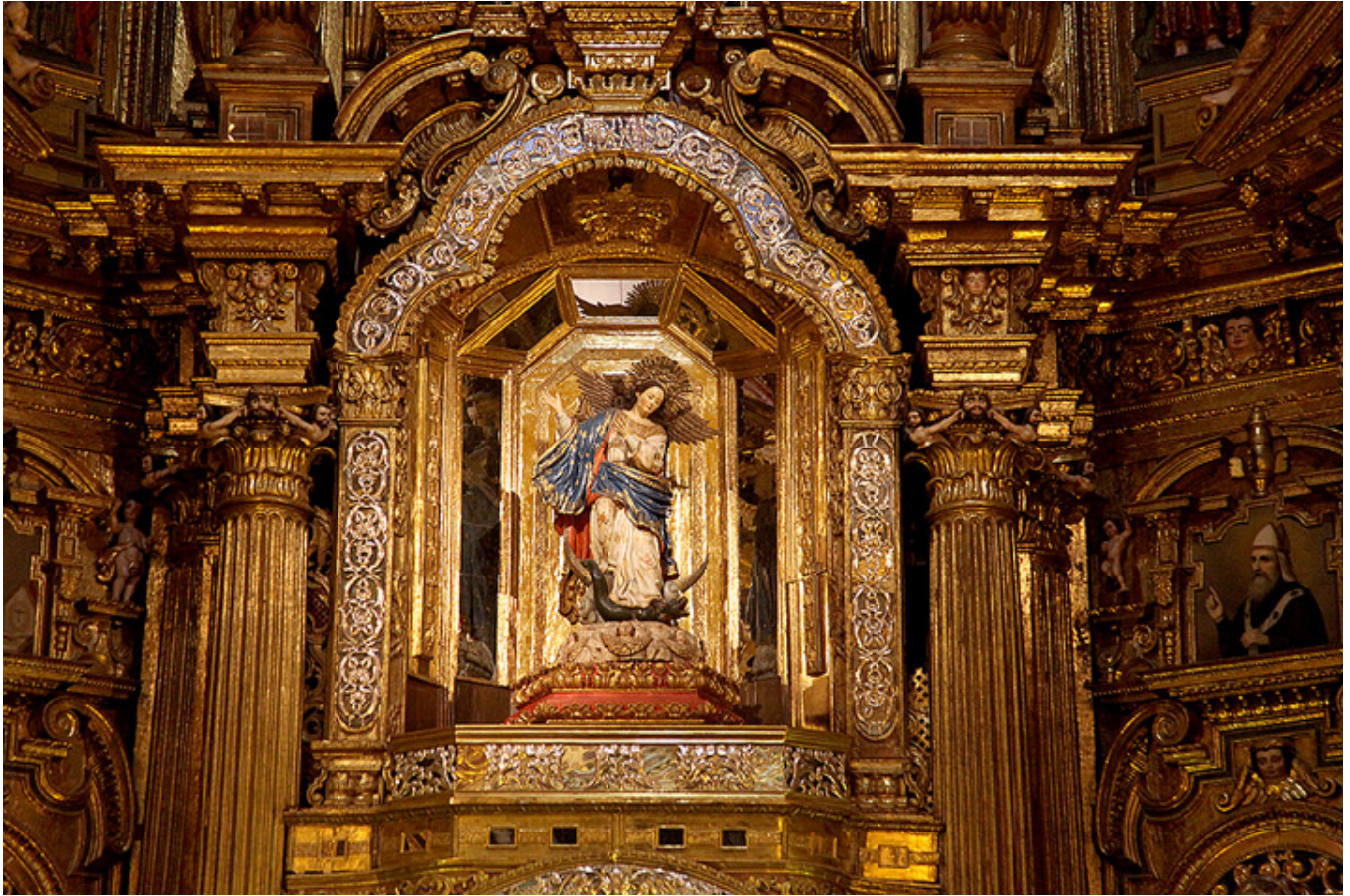
Quito. Kościół św. Franciszka, wnętrze