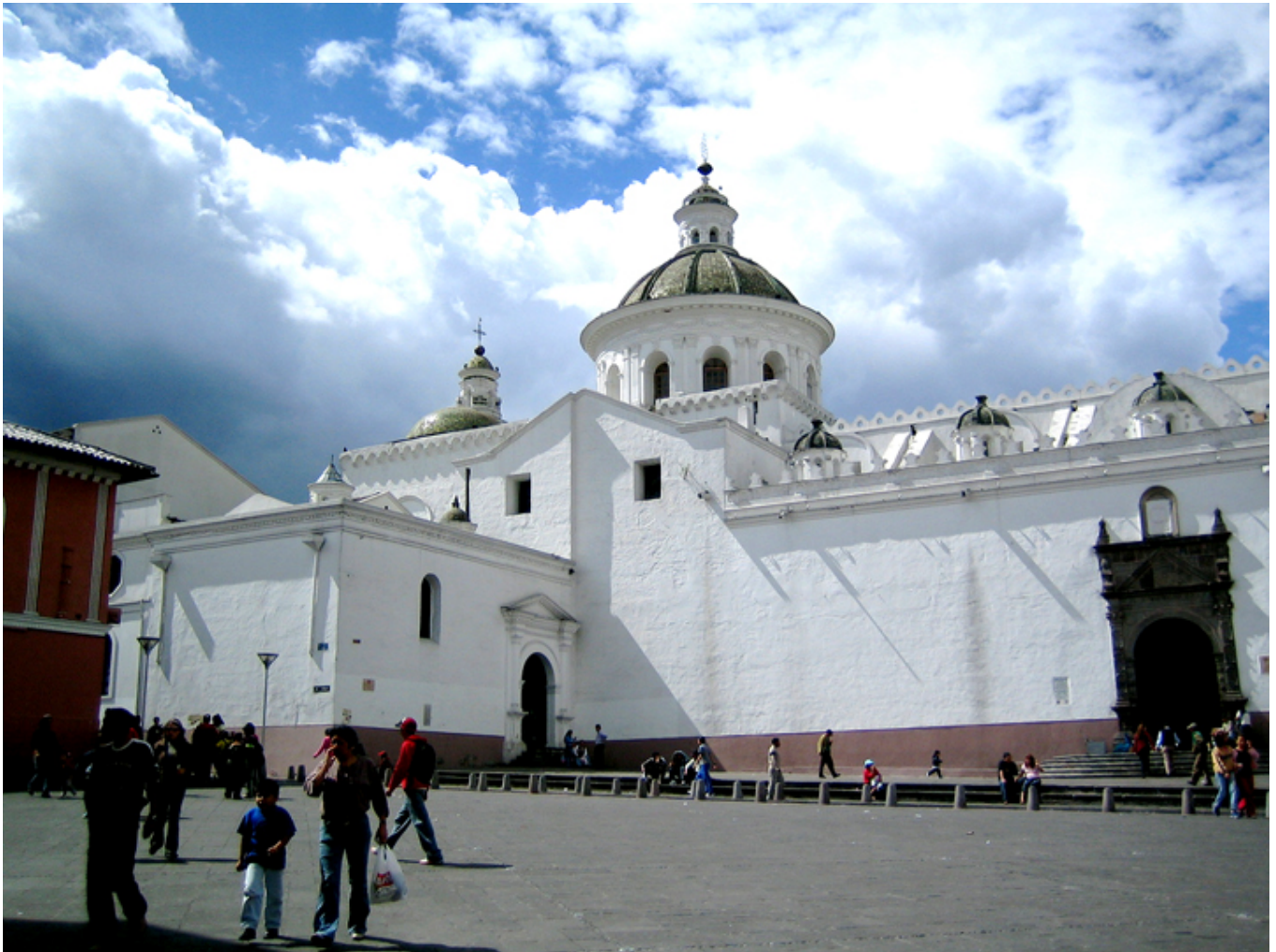
Quito. Widok na kościół Towarzystwa Jezusowego