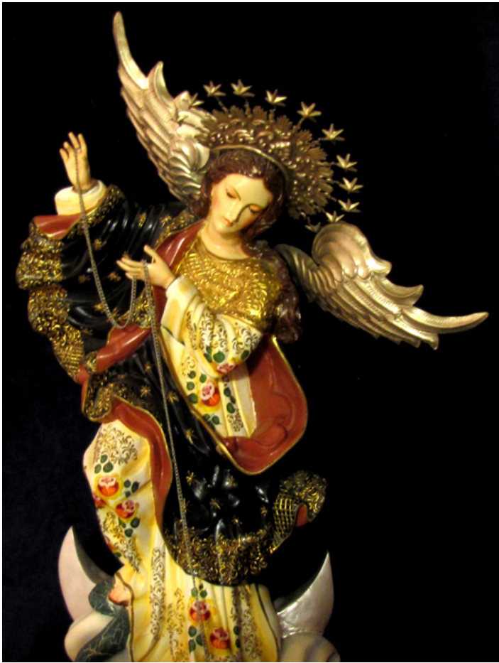
Szkoła Kiteńska. Matka Boska Niepokalanego Poczęcia