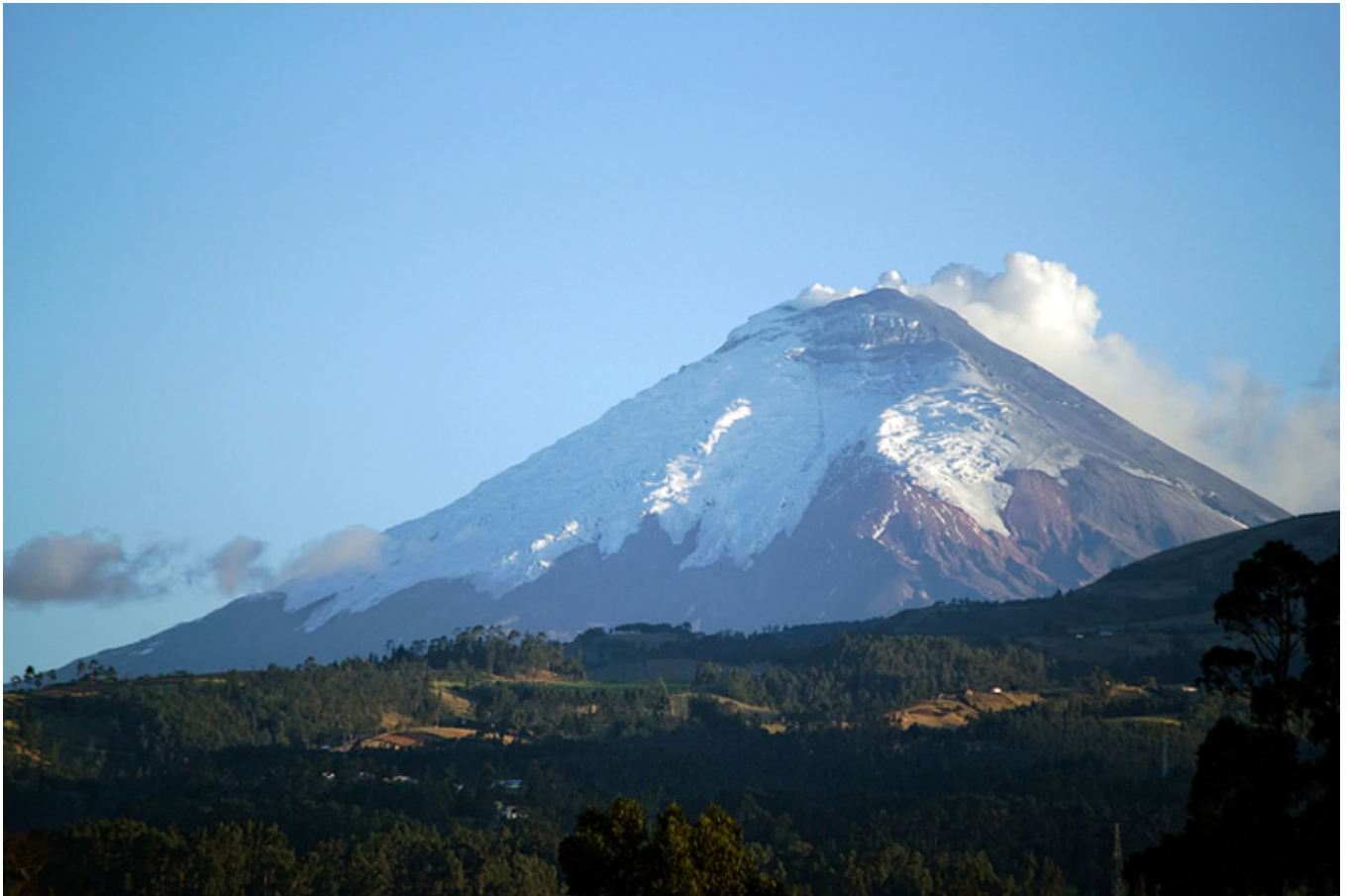
Wulkan Cotopaxi (5897 m wysokości) w trakcie erupcji