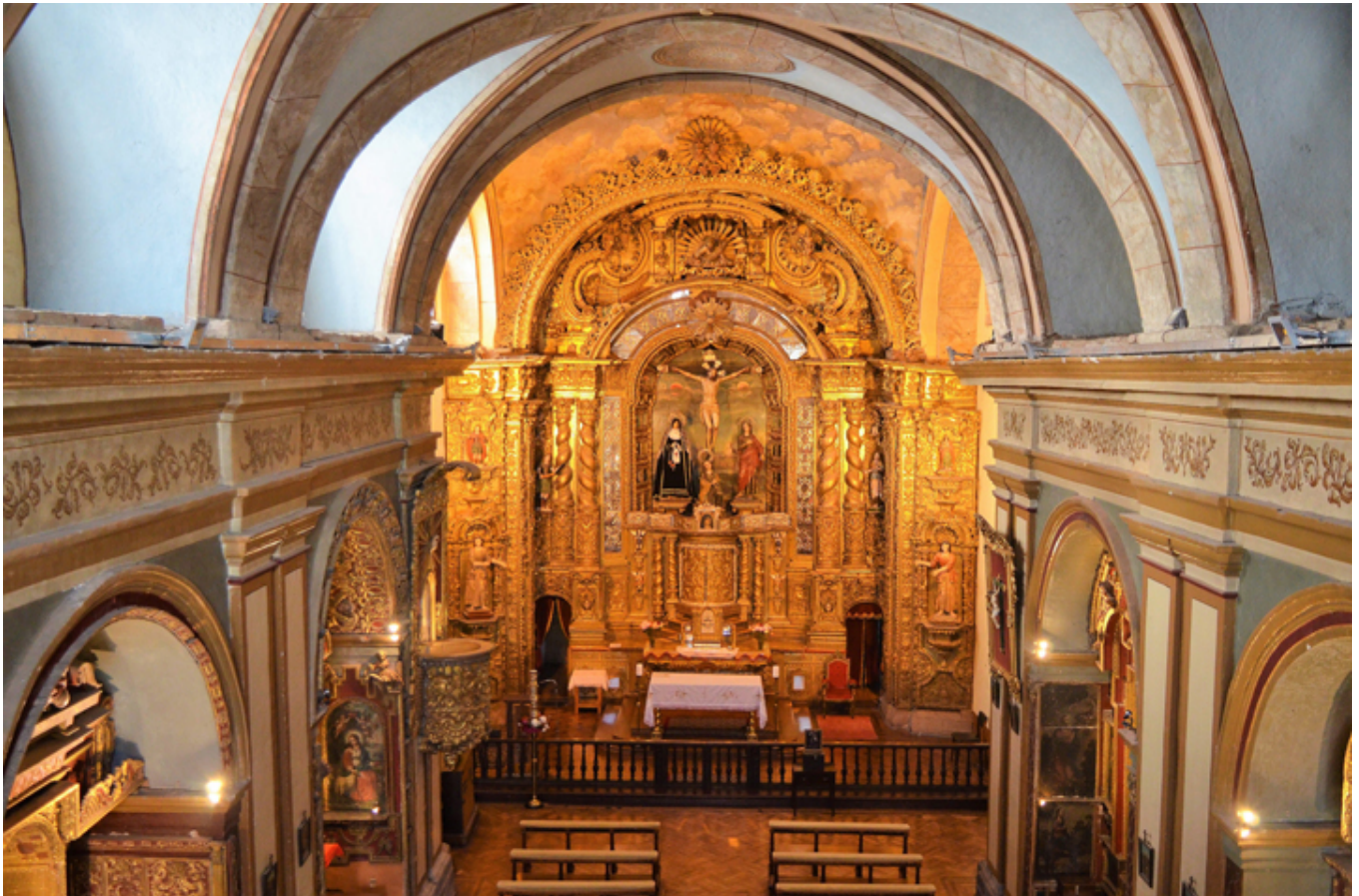
Quito. Kaplica Cantuña przy klasztorze św. Franciszka