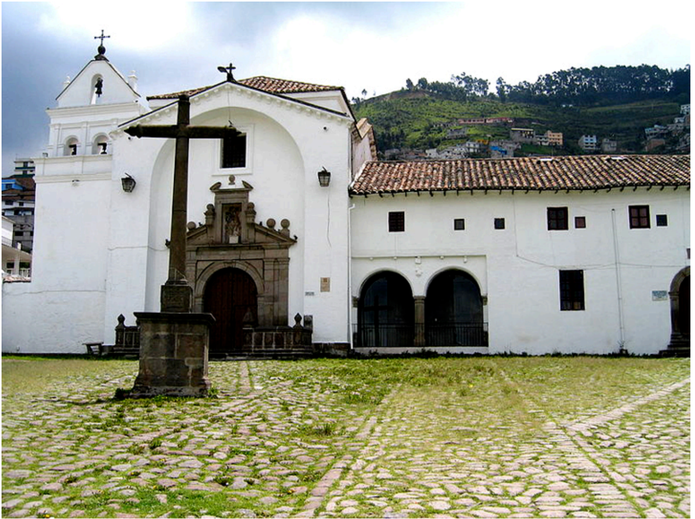
Quito. Klasztor San Diego