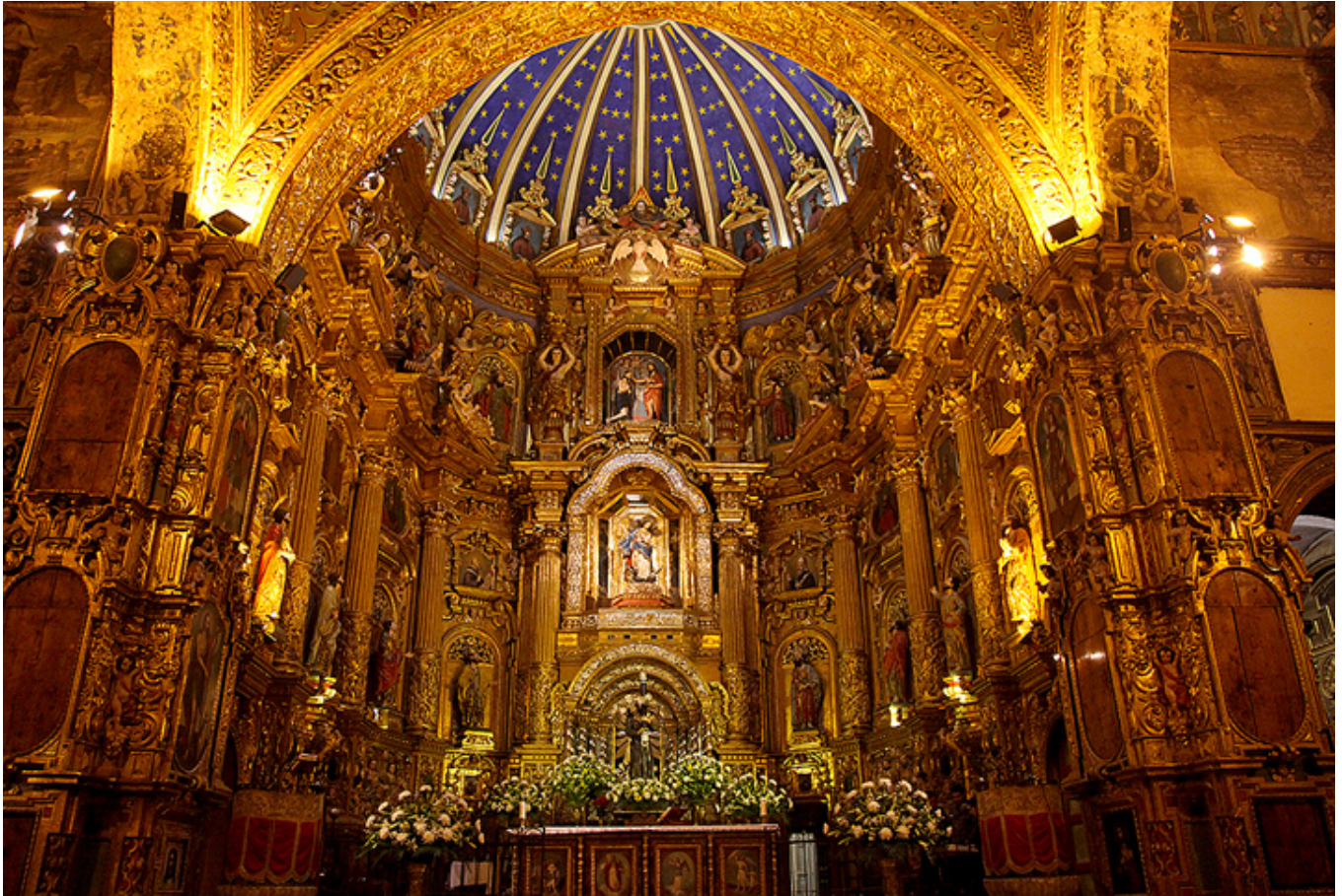
Quito. Wnętrze kościoła św. Franciszka