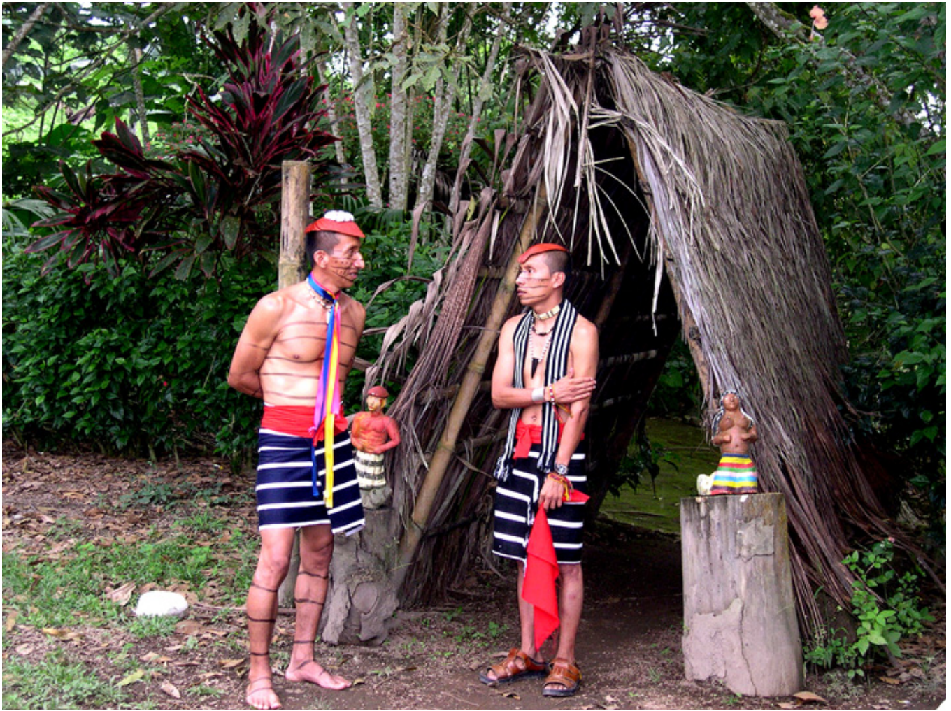
Indianie Tsáchila w swej wiosce