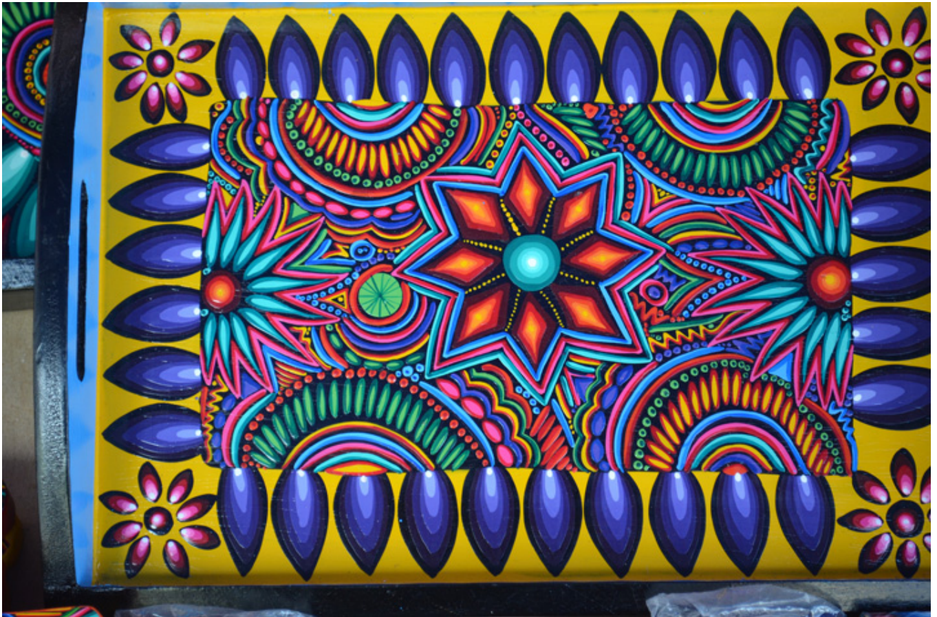
Otavaló. Taca z miejscowości Tigua