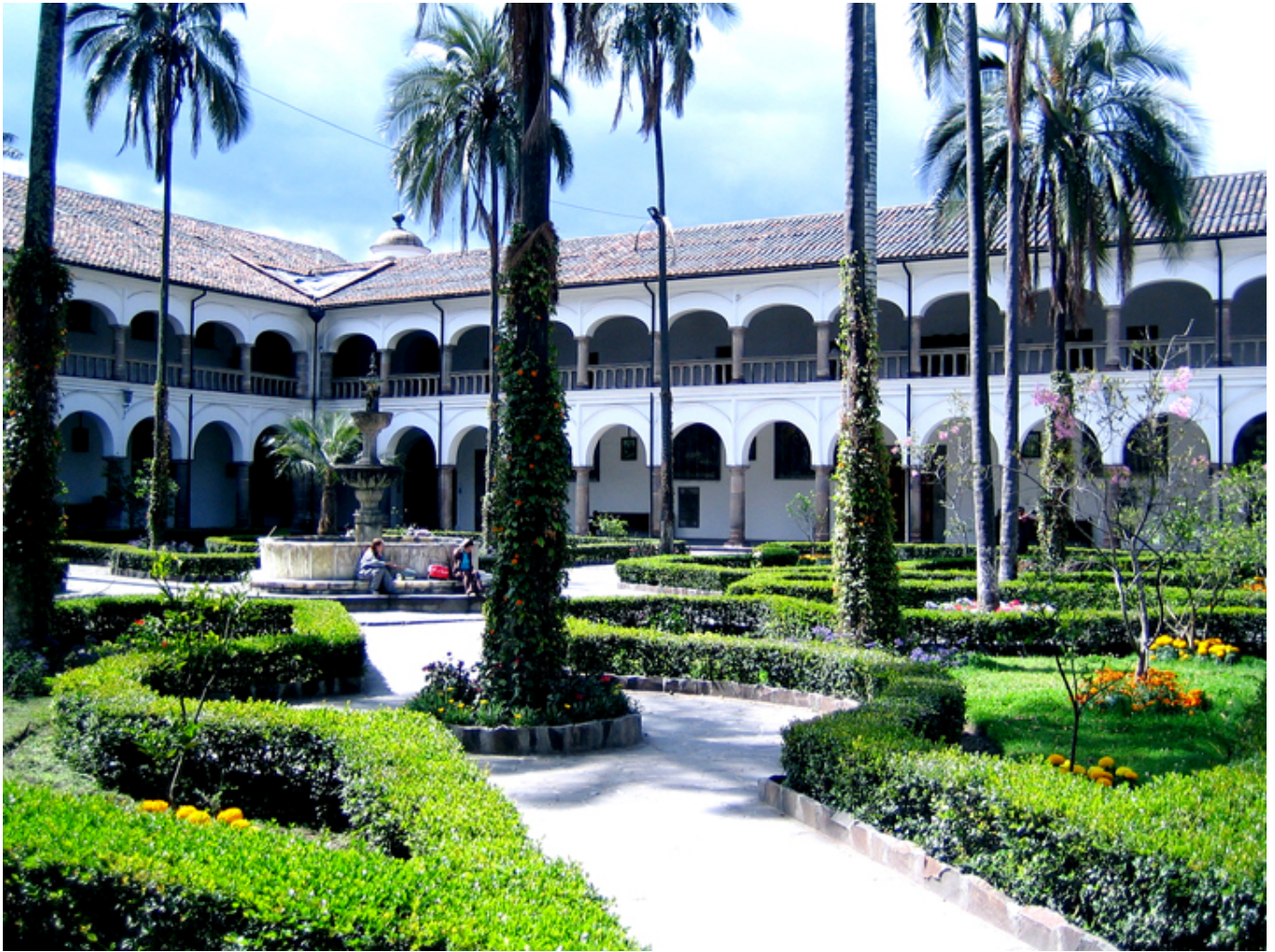
Quito. Wirydarz św. Franciszka