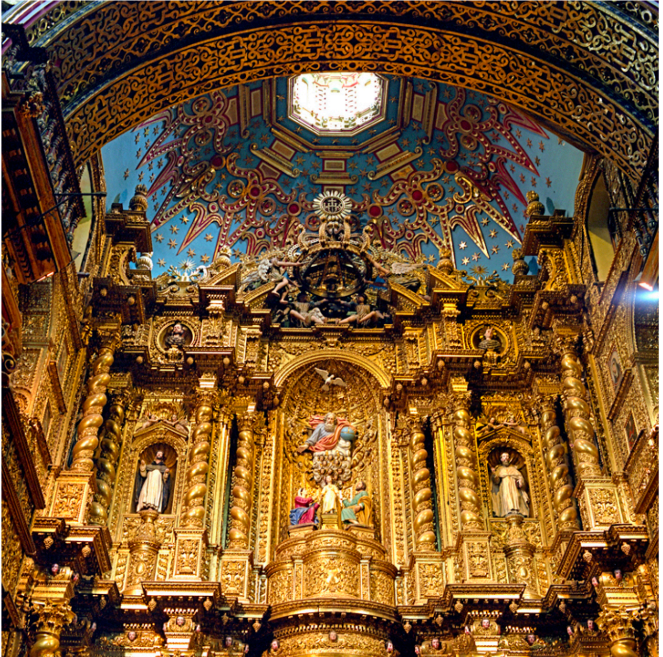
Quito. Kościół Towarzystwa Jezusowego