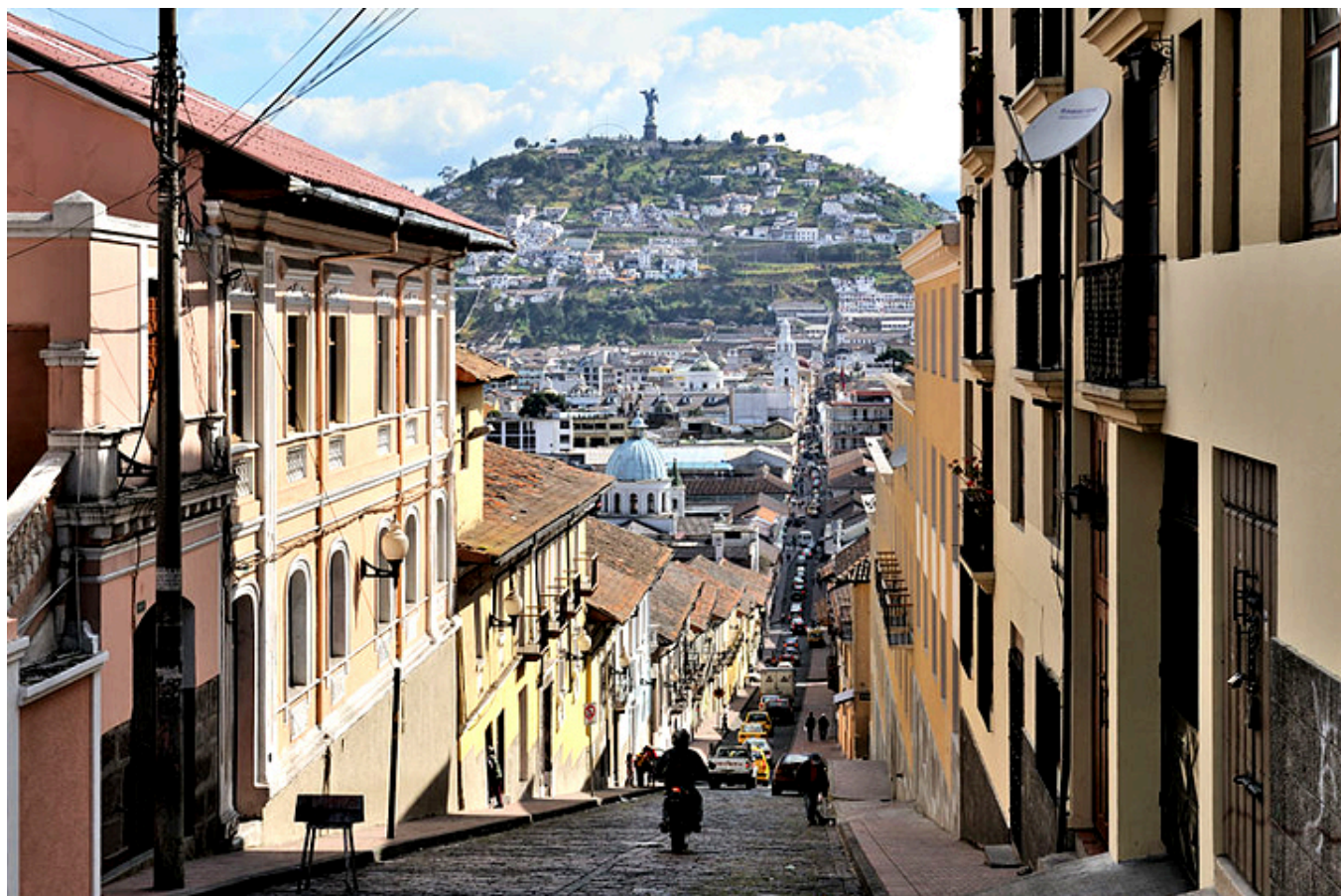
Quito. Ulica García Moreno

Podkreślić należy, że każda z tych budowli ma ponadto wypełnione ciekawą roślinnością przestronne patio, czyli klasztorne dziedzińce arkadowe. Ograniczyliśmy się właściwie tylko do najbliższej okolicy hotelu, czyli wielkiego prostokątnego Placu Św. Franciszka z fontanną pośrodku i kilku sąsiednich ulic (niektóre z potężnymi łukami ponad jezdnią, na przykład Arco de la Ronda - Łuk de la Ronda), z których najpiękniejsza to ulica García Moreno z ciągiem białych jednopiętrowych domów o wystających dachach i kutych w żelazie balkonach, od połowy stromo wznosząca się do góry.