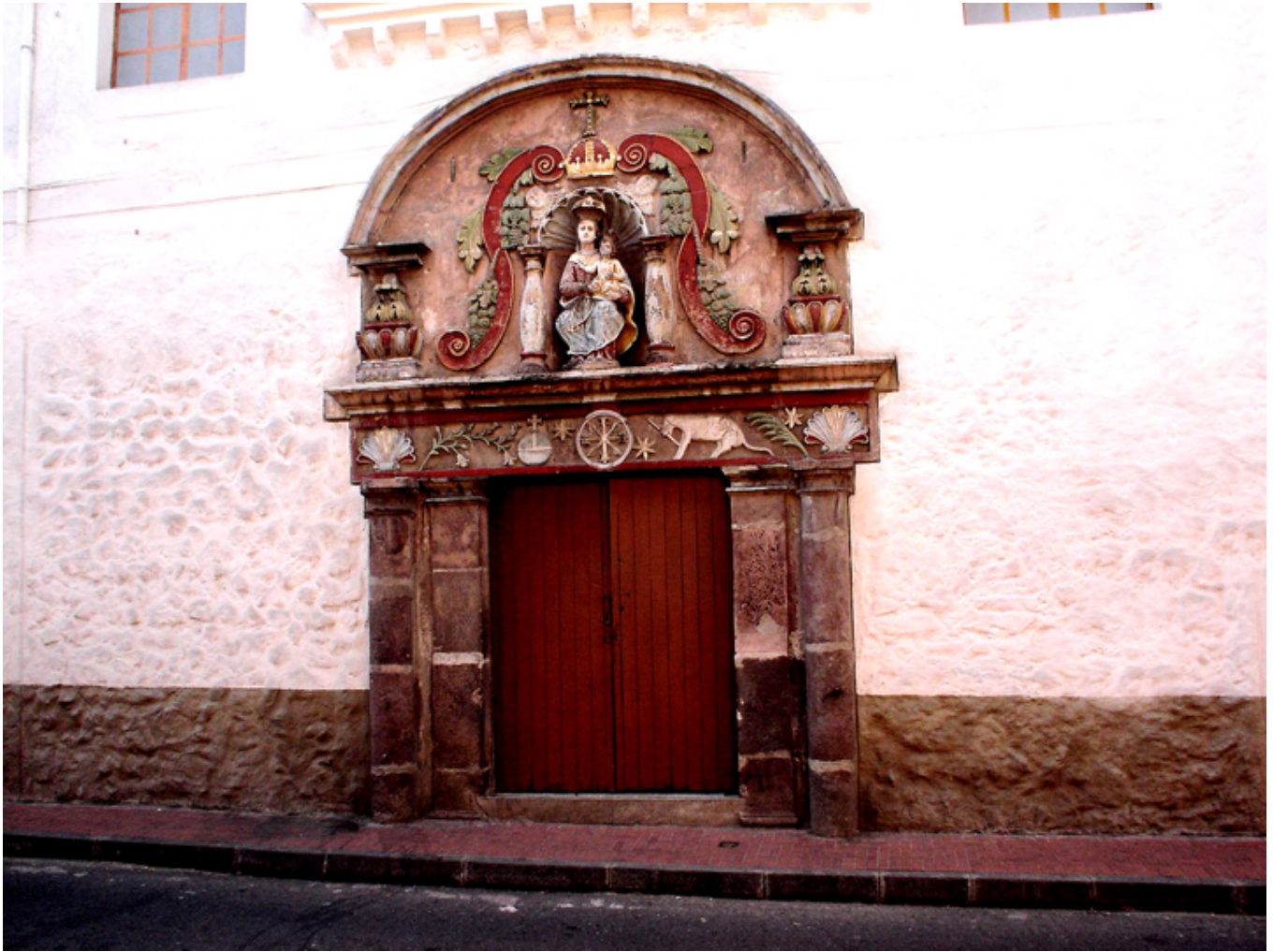
Quito. Kościół św. Dominika. Portal