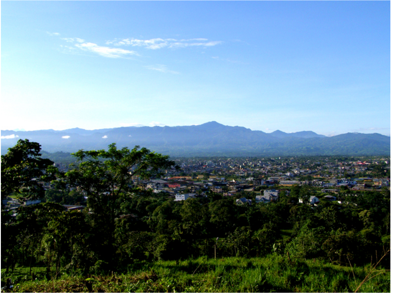
Santo Domingo de Los Tsáchilas