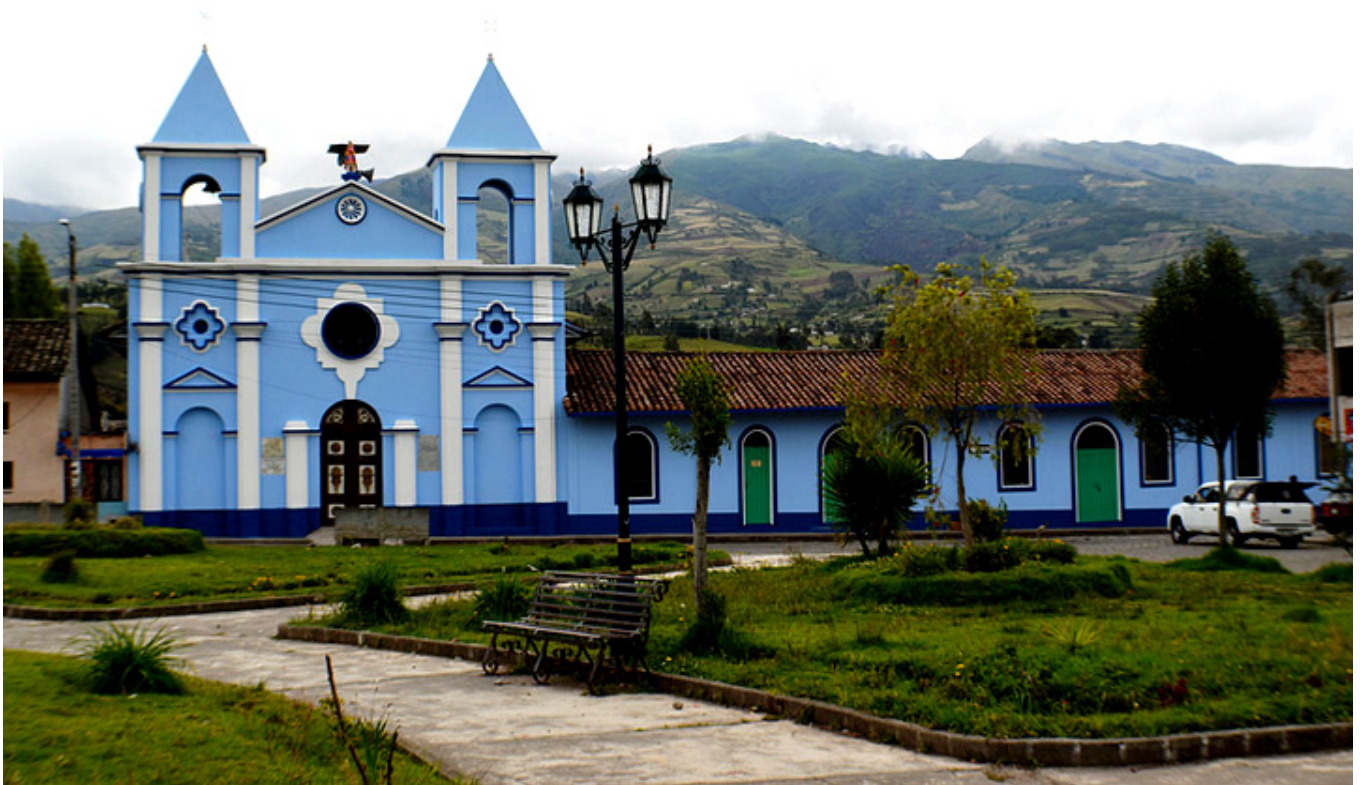
Otavalo. Kościół González Suárez