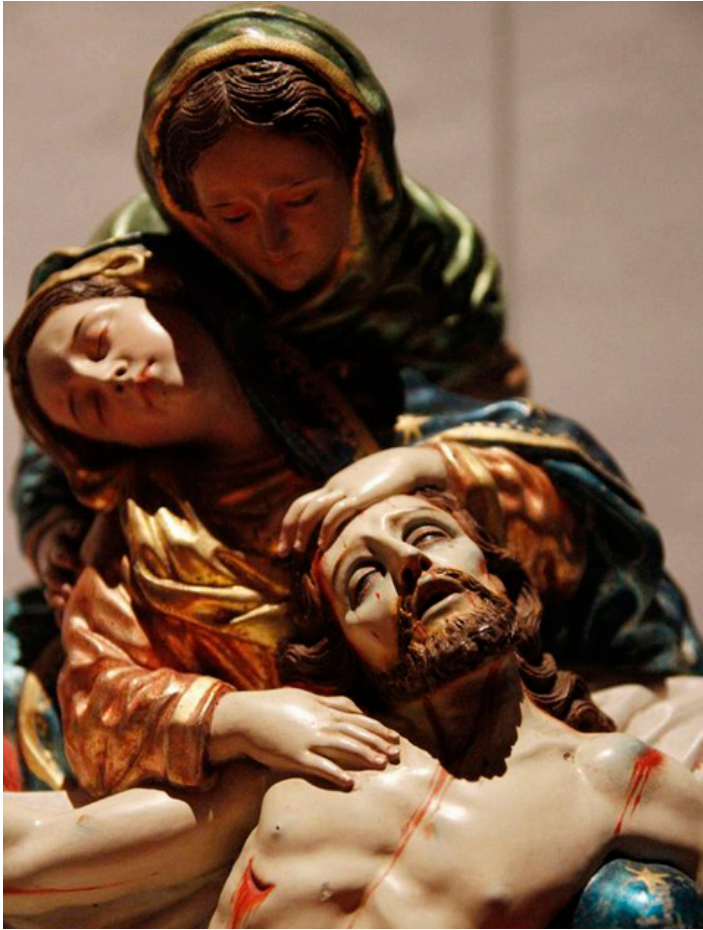
Szkoła Kiteńska. Śmierć Chrystusa