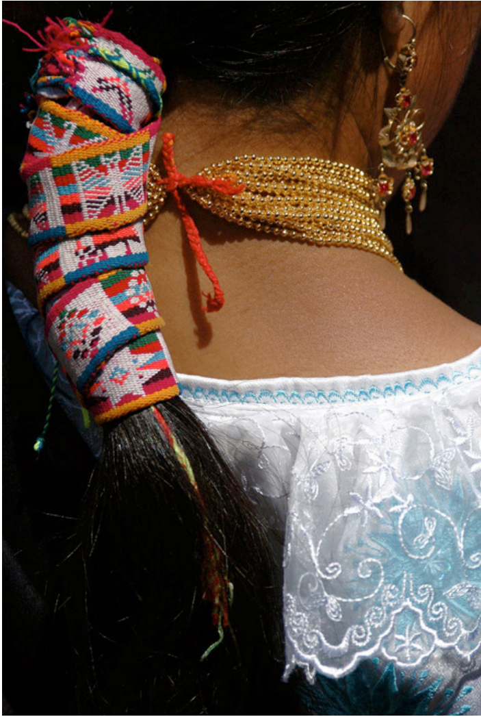
Kobieta z Otavalo