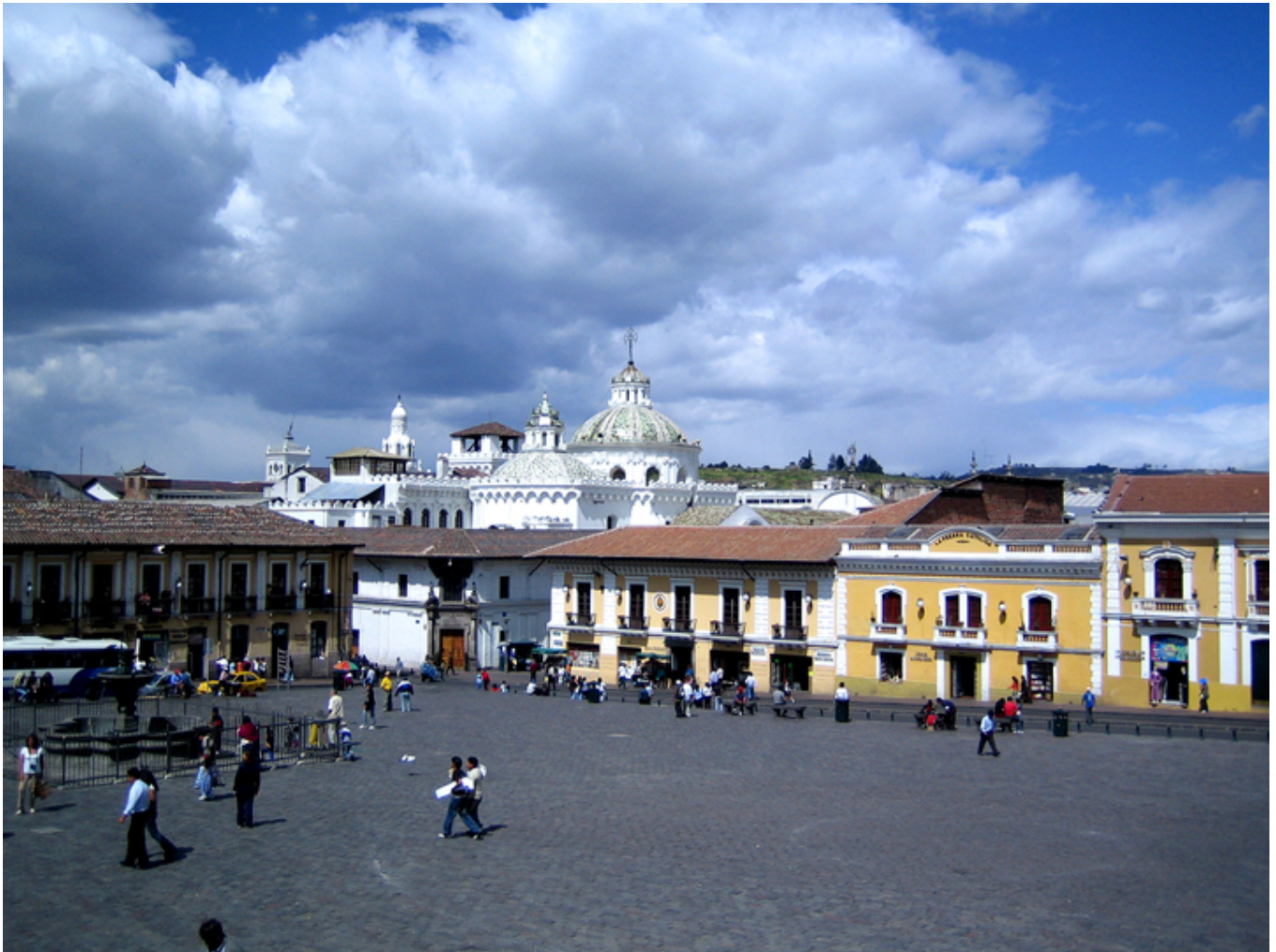
Stare Quito. W głębi kościół Towarzystwa Jezusowego