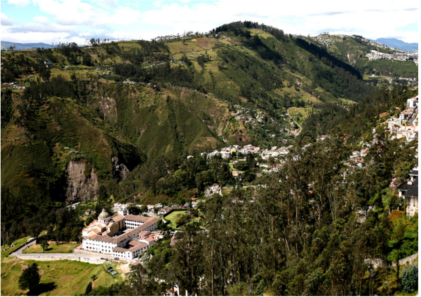
Quito. Dolina klasztoru Guápulo