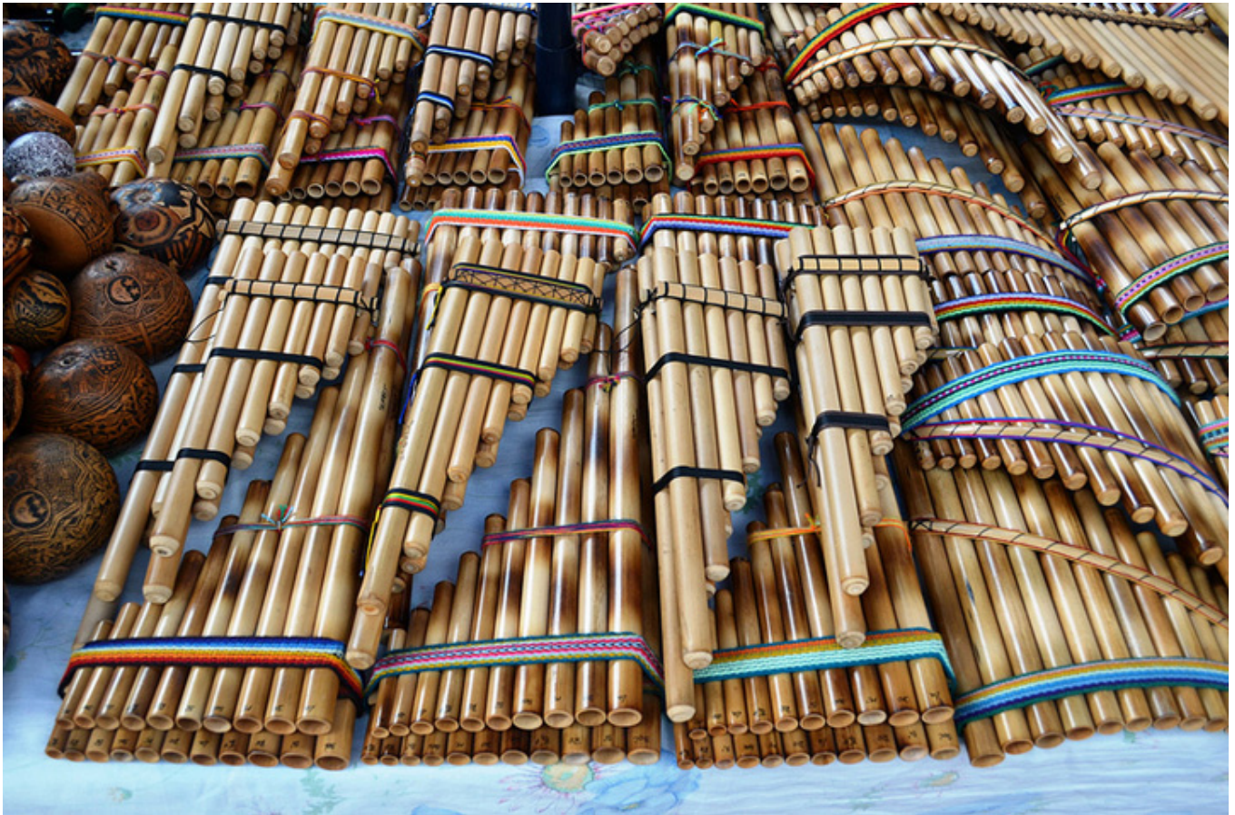
Otavalo. Fletrías Pana (rondadores) na targu