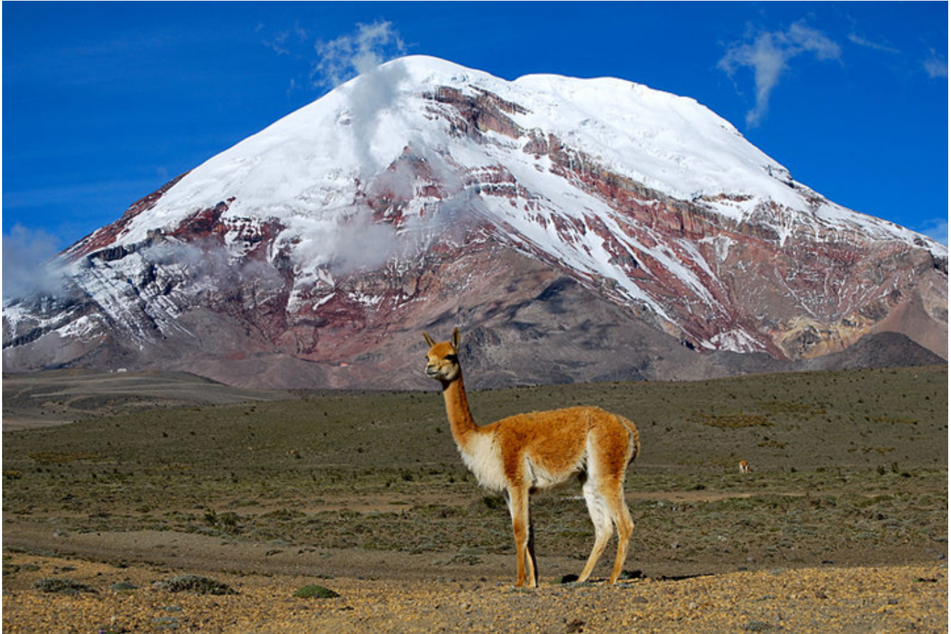
Wigoń na tle góry Chimborazo (6263 m wysokości)