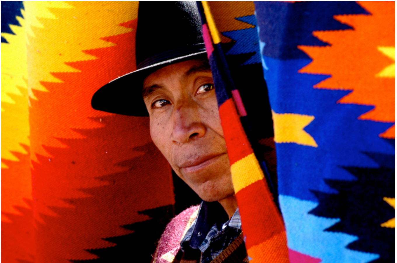
Targ w Otavalo

Ameryka Łacińska, Hiszpania i Portugalia oczami polskiego iberysty