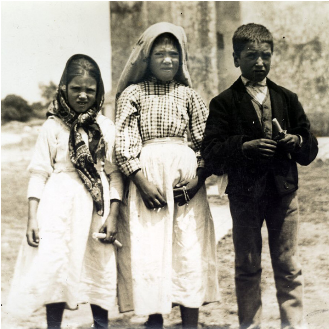
Dzieci, którym ukazała się Matka Boska w Fatimie, w 1917 r.

Ponoć w PRL-u ten mój przekład był zakazany i poszukiwany, a nawet konfiskowany w prywatnych zbiorach przez UB.