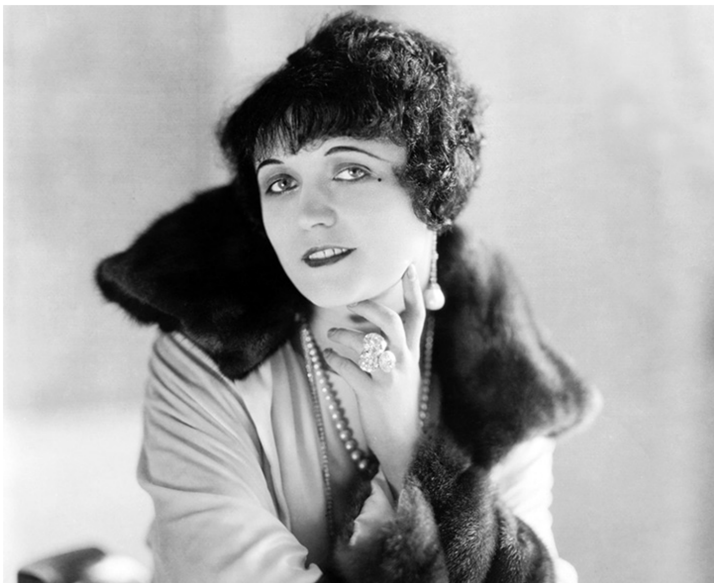
Pola Negri