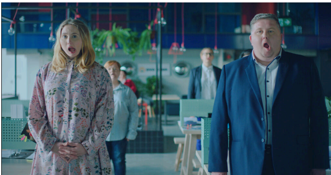
Kadr z filmu „Wenus z Willendorfu”

Film dostępny na platformie festiwalowej: 14-21 listopada.