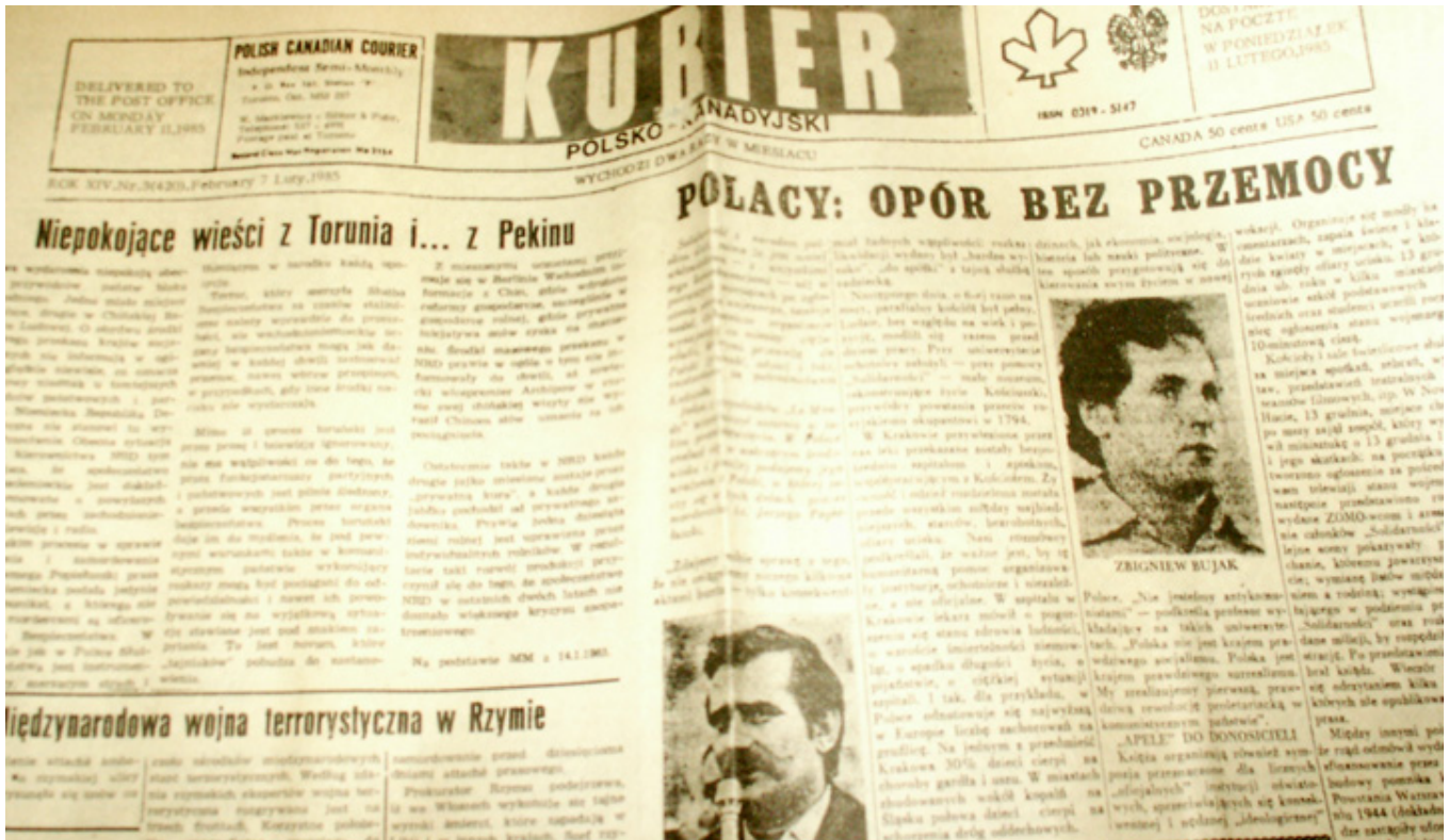
„Kurier Polsko-Kanadyjski” – gazeta założona przez Wilka Markiewicza, fot. J. Sokołowska-Gwizdka.

JSG: Jak doszło do tego, że w Toronto powstała pierwsza prywatna polska gazeta? Proszę opowiedzieć trochę szczegółów?