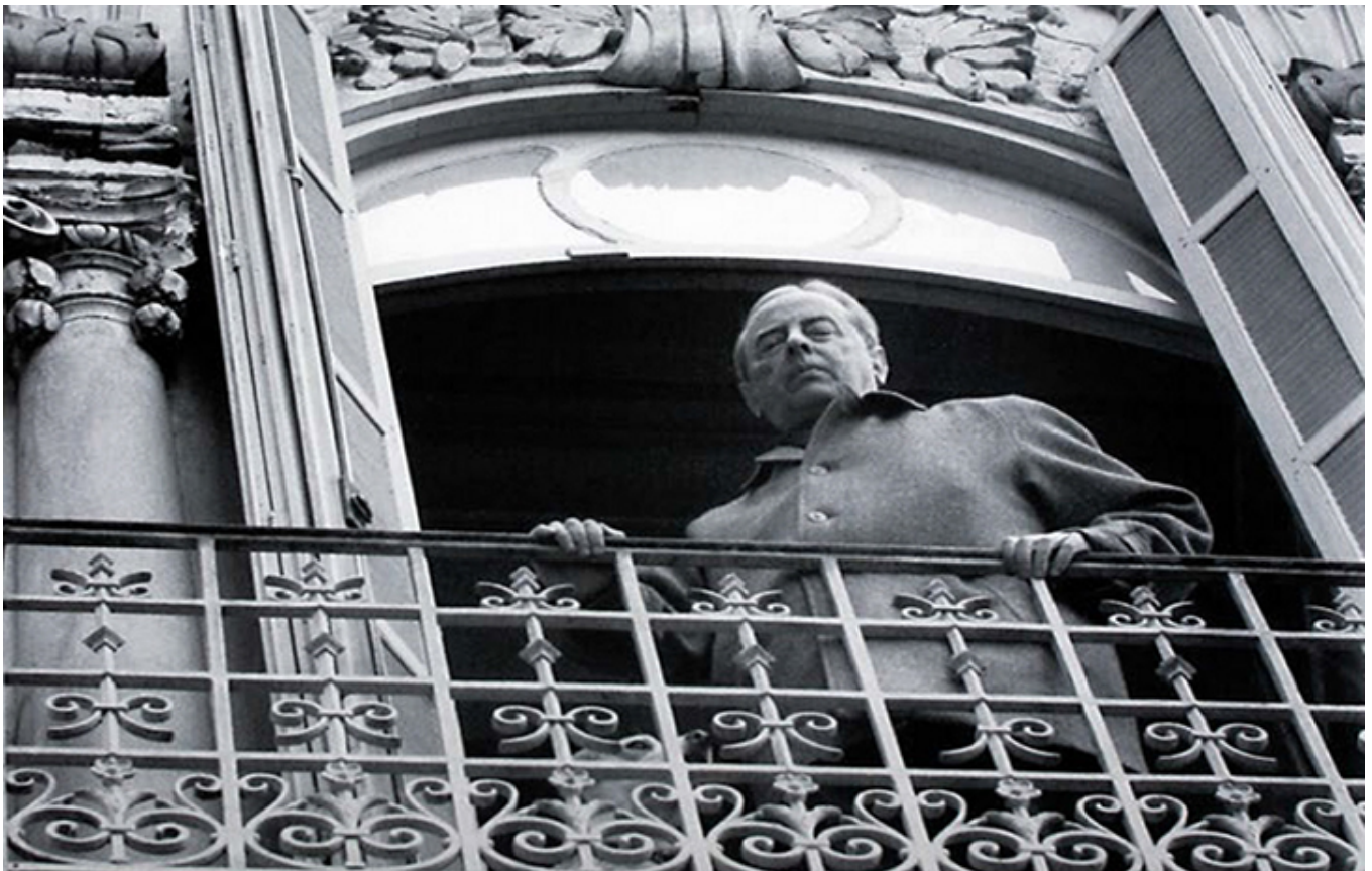
Witold Gombrowicz na balkonie willei Alexandrine w Vence.