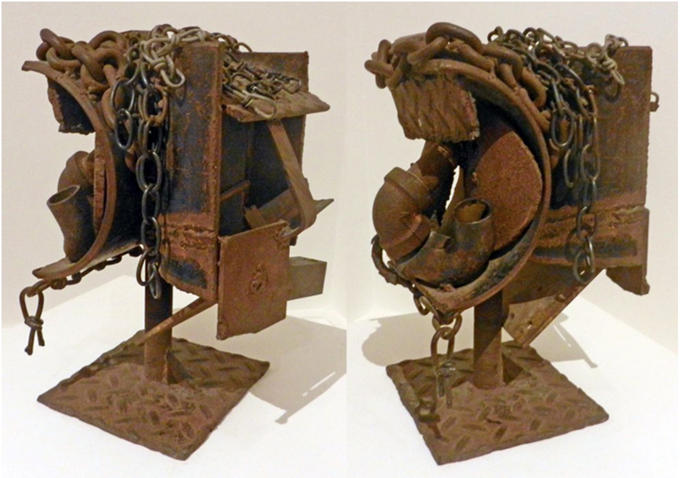
Richard Stankiewicz; Double Head, 1961 r., spawana stal

Z wykształcenia technik. Z zawodu żołnierz. W życiu, duszy i sercu rzeźbiarz. Amerykanin polskiego pochodzenia - Richard Stankiewicz. Jeden z czołowych artystów XX wieku w USA. Wymieniany w czołówce, obok Roberta Rauschenberga i Jaspera Johnsa.