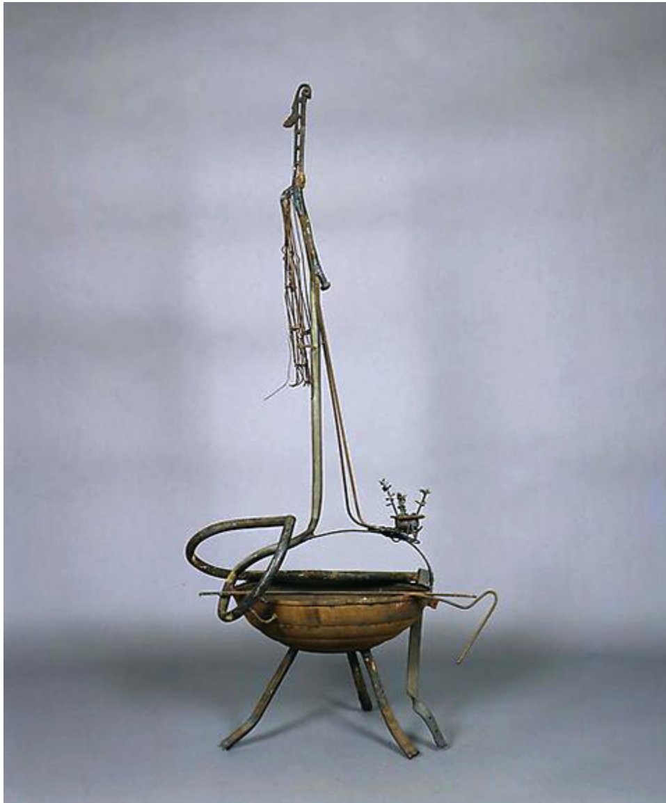
Richard Stankiewicz, Seated Lady, 1954 r., spawany metal, 49" x 23" x 17".