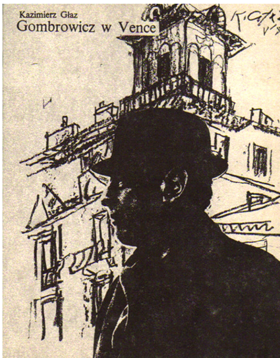
Okładka książki Kazimierza Głaza „Gombrowicz w Vence”, 1985 r.