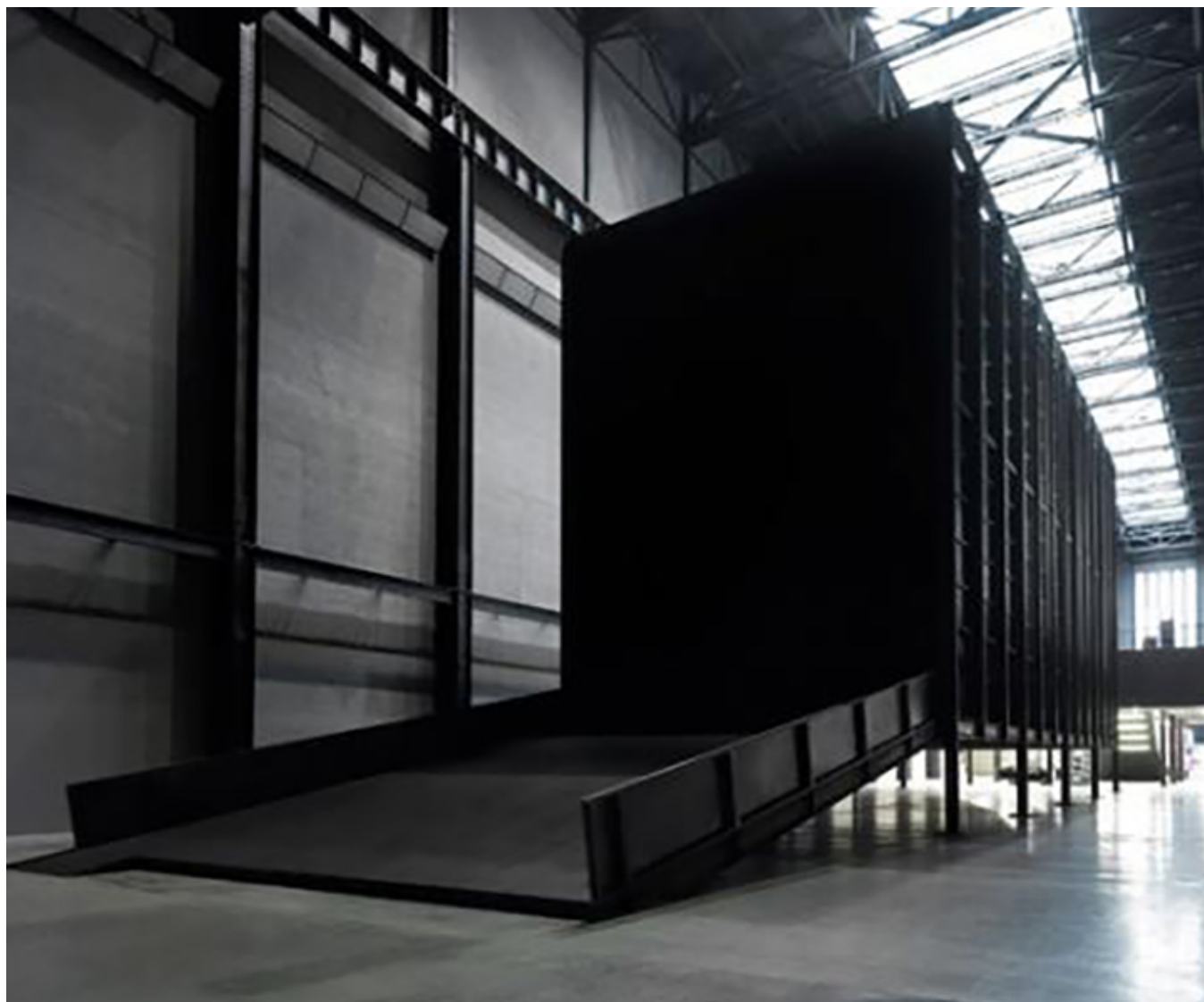
Mirosław Bałka, Jak to jest, Tate Modern, Londyn.

Granice państwowe, a nawet bariery systemów nigdy w historii nie stanowiły trwałych przeszkód dla wymiany myśli. Sztuka nie jest jakością statyczną i ulega zmianom nawet w koncepcyjnym załączku. Tym różni się od rzemiosła.