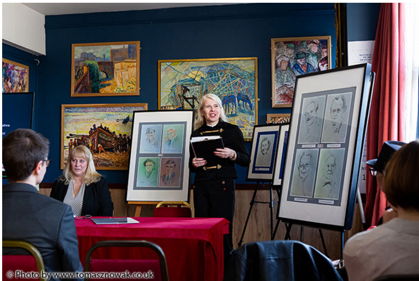
Anna Kokot-Nowak przedstawia biogram Rozalii Nowak