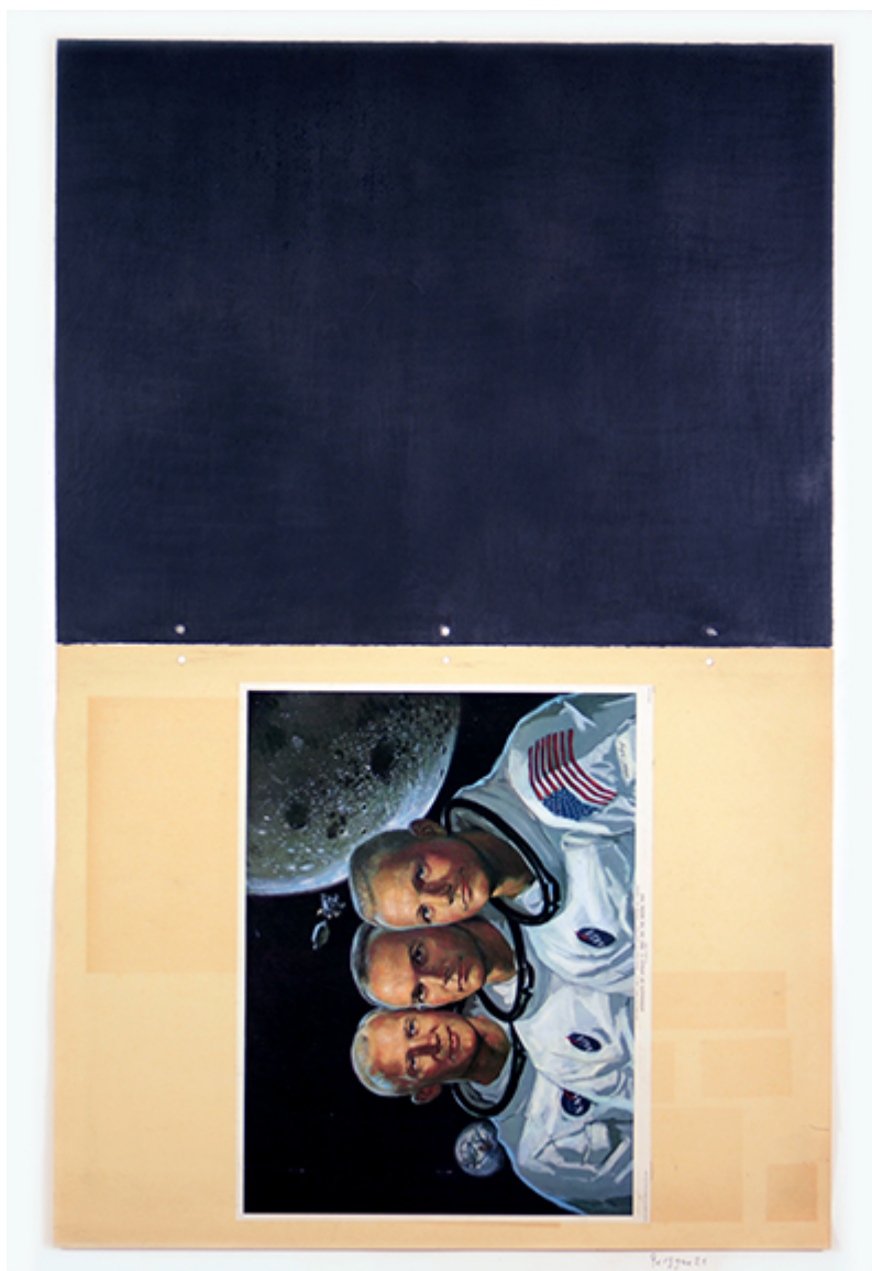
Bogdan Perzyński, Surface Drawing #29

Artysta zachował drukowaną informację prasową. Znajdowały się tam wiadomości bardzo znaczące i mniej znaczące, tragiczne i humorystyczne. Opisywano tam wydarzenia wagi światowej, lub tylko lokalne. Gazety wychodziły głównie w Teksasie od lat 30. XX w., ale są tam też gazety współczesne, w których pojawiają się m.in. informacje o polskim piłkarzu Robertcie Lewandowskim. Z tych gazetowych skrawków Bogdan Perzyński buduje konstrukcję znaczeń, w jakiś sposób określającą nasze społeczeństwo i jego struktury, którym ulegamy. Pokazuje jak bardzo podajemy się presji mediów i dajemy wiarę wszystkiemu, co czytamy. Widzimy nagłówki gazet, które podkreślają znaczenie lądowania człowieka na księżycu i triumf Ameryki w wyścigu z Rosją. I jesteśmy dumni z osiągnięć ludzkości. A czy