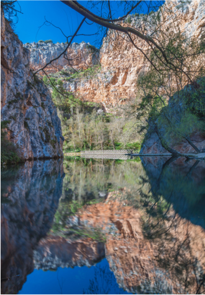
Monasterio de Piedra (Kamienny Klasztor w Aragonii).