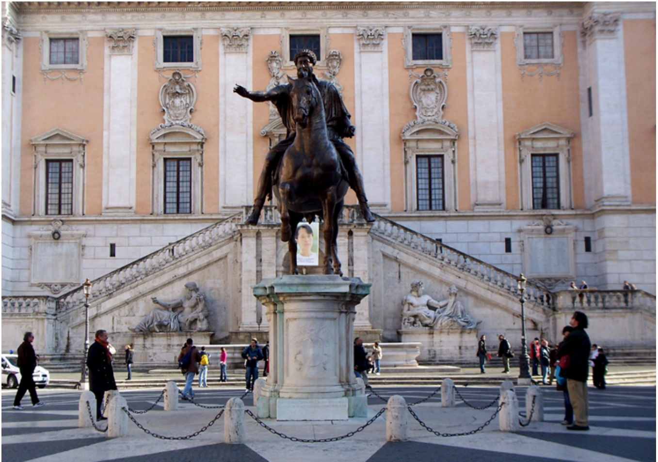
Rzym. Kapitol i pomnik Marka Aureliusza.

Mój paszport tracił ważność w pierwszych dniach lipca. By zdążyć na czas do Polski musiałem wyjechać z Madrytu w połowie czerwca, jeszcze przed końcem kursu. Wraciałem przez Barcelonę , skąd statkiem do Genui , potem już pociągiem do Rzymu , który chciałem koniecznie poznać, stamtąd do Mediolanu i przez Wenecję , Wiedeń i Koluszki do Skierniewic . W Barcelonie urzekła mnie stara Dzielnica Gotycka i przepiękna aleja Las Ramblas z szerokim pasem pośrodku, gdzie sprzedają kwiaty i ptaki w klatkach. O Rzymie można by bardzo długo. Powiem tylko, że miałem strasznego pecha: gdy wchodziłem po monumentalnych schodach na