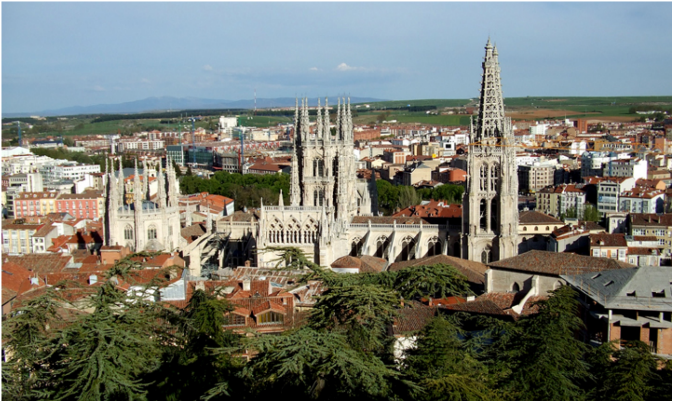
Burgos. Widok ogólny z katedrą.