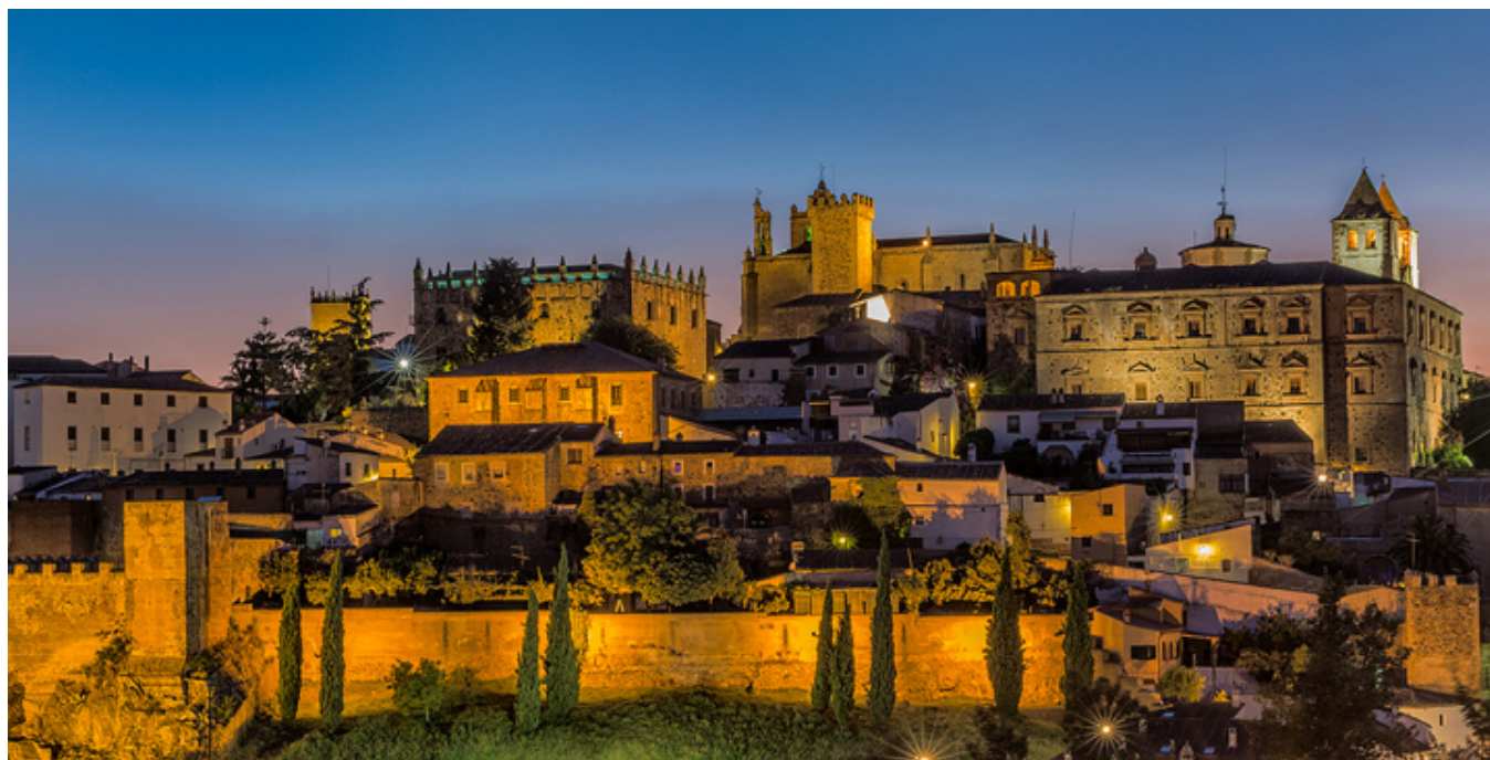
Cáceres nocą

rozmowy przebiegały niczym w jakimś transie, zapamiętaniu i to zarówno z jego jak i mojej strony. Jeździłem głównie autostopem. Bywało z tym różnie: czasem sterczałem na skrzyżowaniu po kilka godzin, zanim coś się zatrzymało. Było to dość męczące. Wynajmowałem pokoje w najtańszych hotelikach, mieszczących się zwykle w starych domach. Frapującą ciekawostką było to, że w szafkach nocnych przy łóżku znajdowałem zawsze pojemny i elegancki, często porcelanowy i pomalowany w kwiatki... nocnik! Gdy po raz pierwszy dokonałem tego zdumiewającego dla mnie odkrycia, nie ukrywam, że przeżyłem lekki szok. Potem stało się to już czymś zupełnie normalnym.