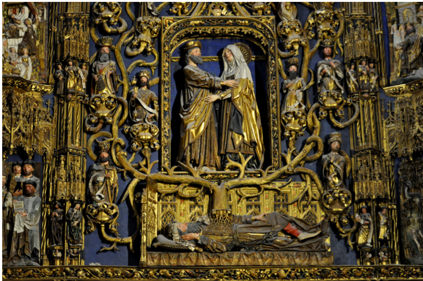
Burgos. Kaplica św. Anny w ołtarzu głównym katedry.