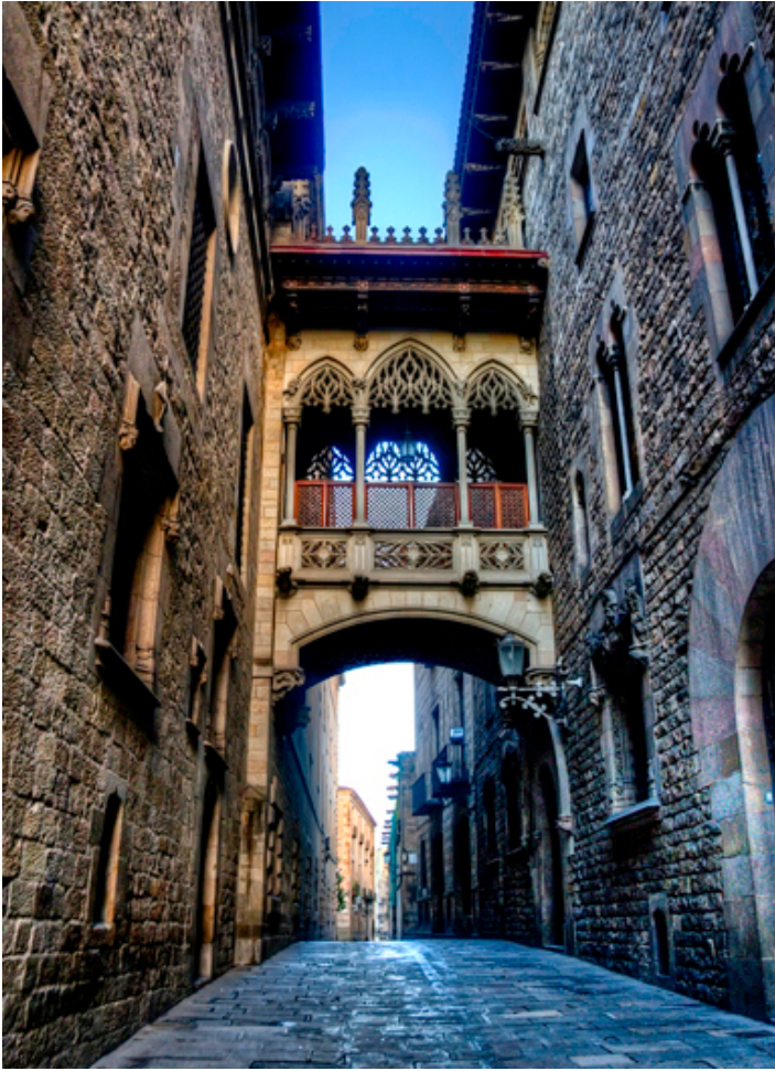
Barcelona. Dzielnica gotycka.