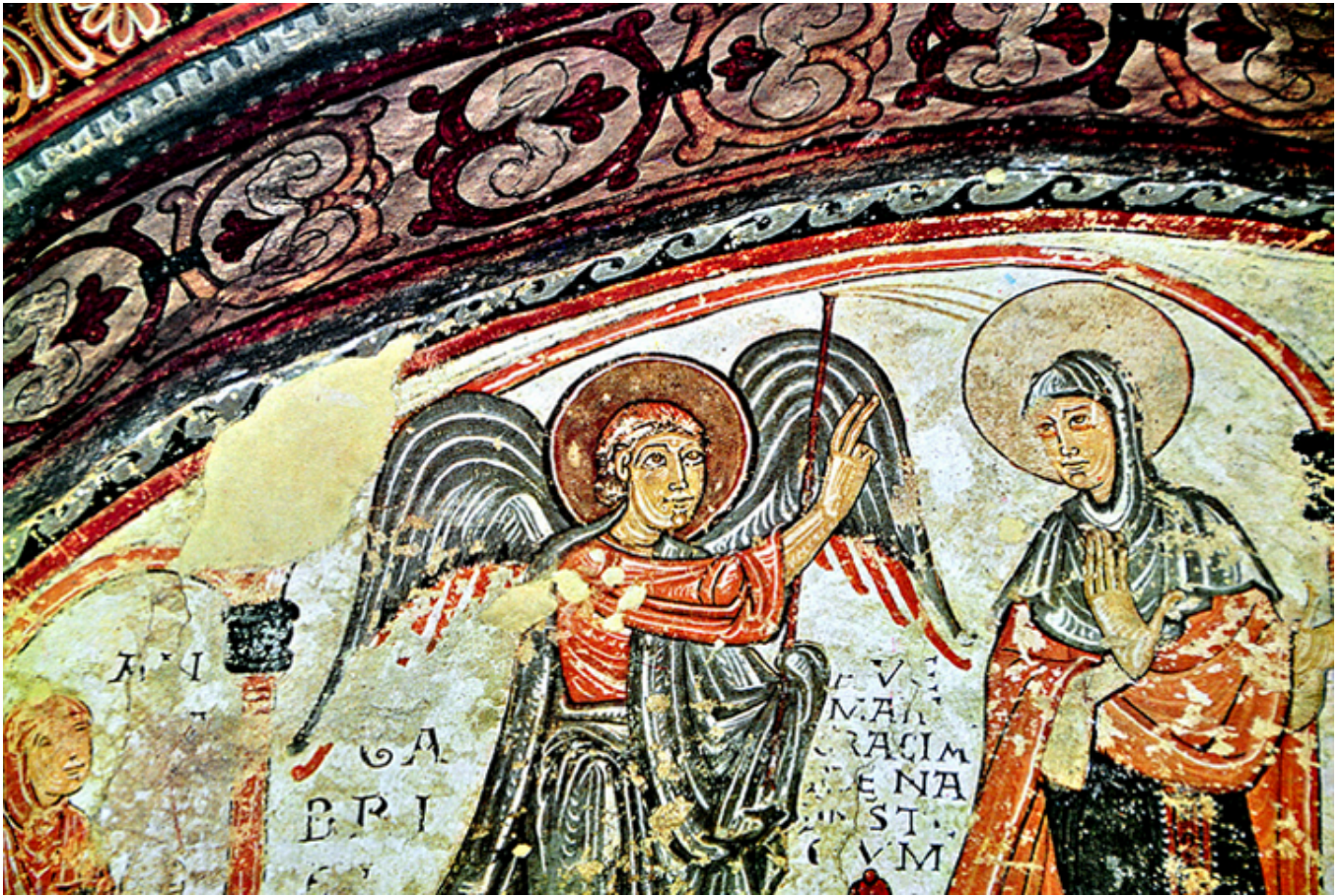
León. Kolegiata św. Izydora. Panteon Królewski. Malowidła.