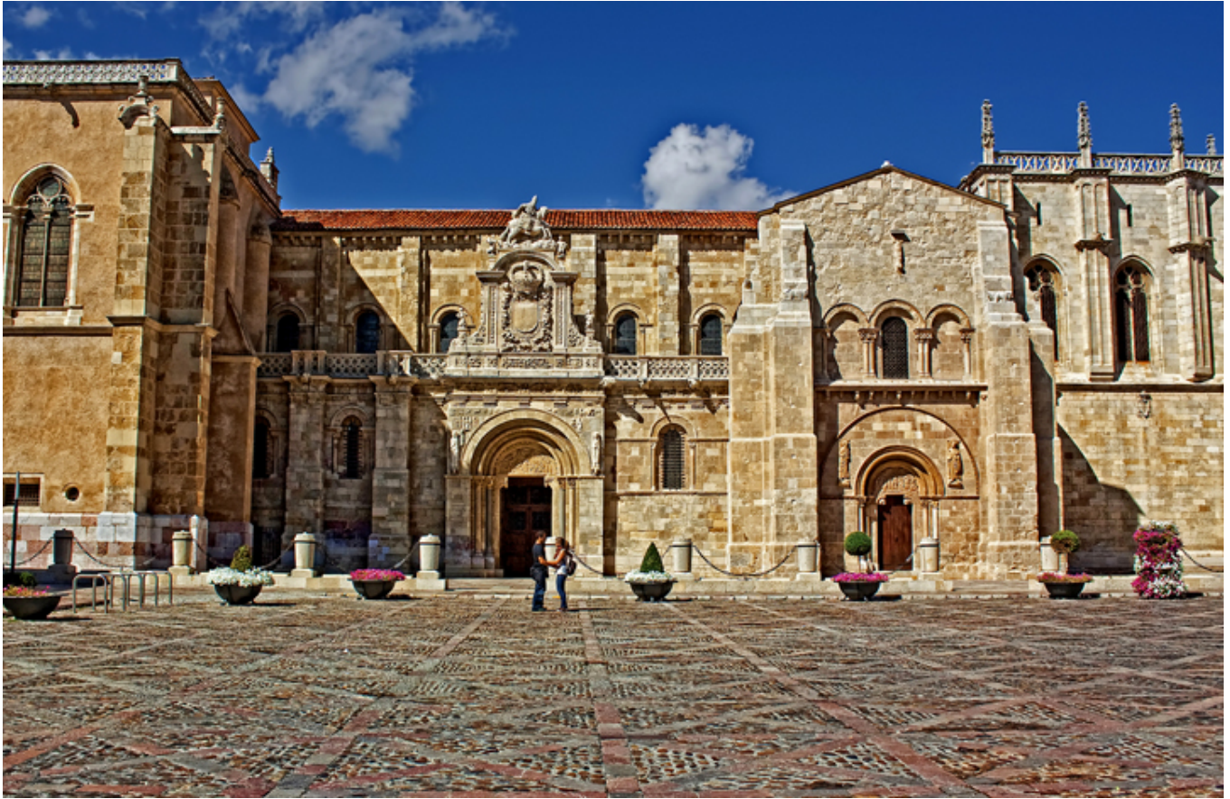
León. Kolegiata św. Izydora, fot. John Gallastegui.