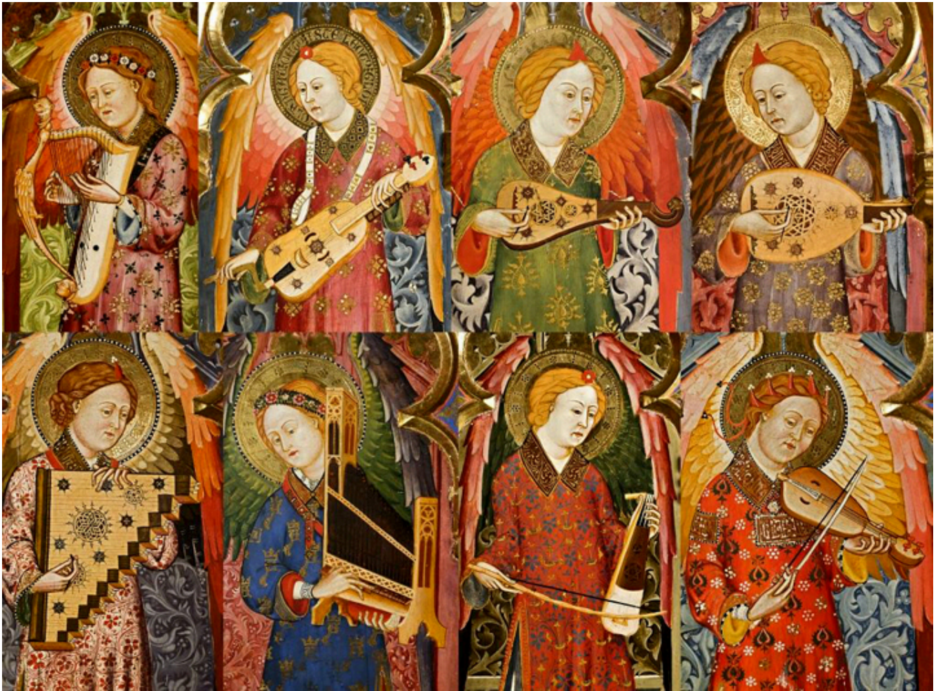
Relikwiarz mauretański w Monasterio de Piedra.