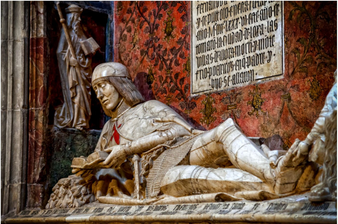
Katedra w Sigüenza. Czytający rycerz Martín Vázquez de Arce.