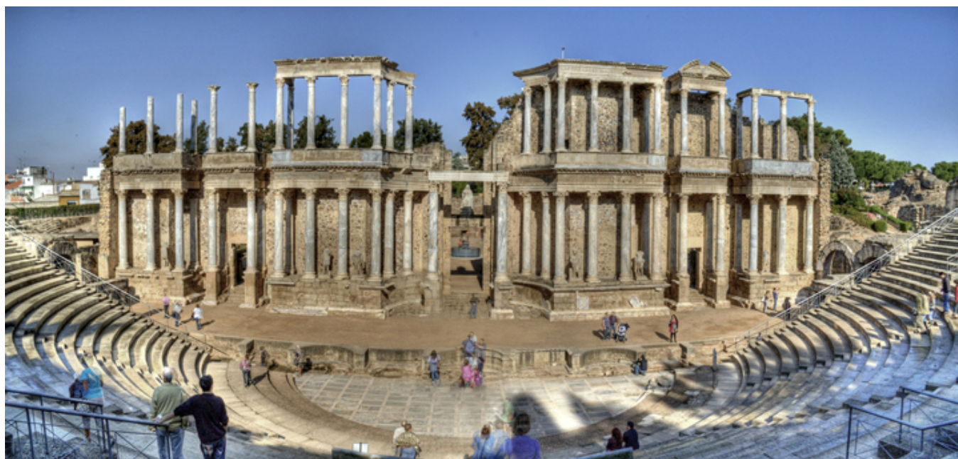
Mérida. Teatr rzymski.

w Elche , obejrzałem największy na Półwyspie Iberyjskim las palm daktylowych. Wcześniej zwiedzałem samą Walencję i oglądałem słynne fallas (konstruowane na ulicach miasta satyryczne sceny z kukłami z kartonu i papier mâché ; podpala się je przy akompaniamencie rakiet i petard co roku nocą z 19 na 20 marca w ramach tak zwanego Święta Ognia). Najładniejsze sceny są uwolnione od spalenia i wzbogacają kolekcję słynnego muzeum kukieł w Walencji . Spośród zabytków antycznych podziwiałem także wspaniałe ruiny i teatr rzymski w Mérida w Estremadurze .