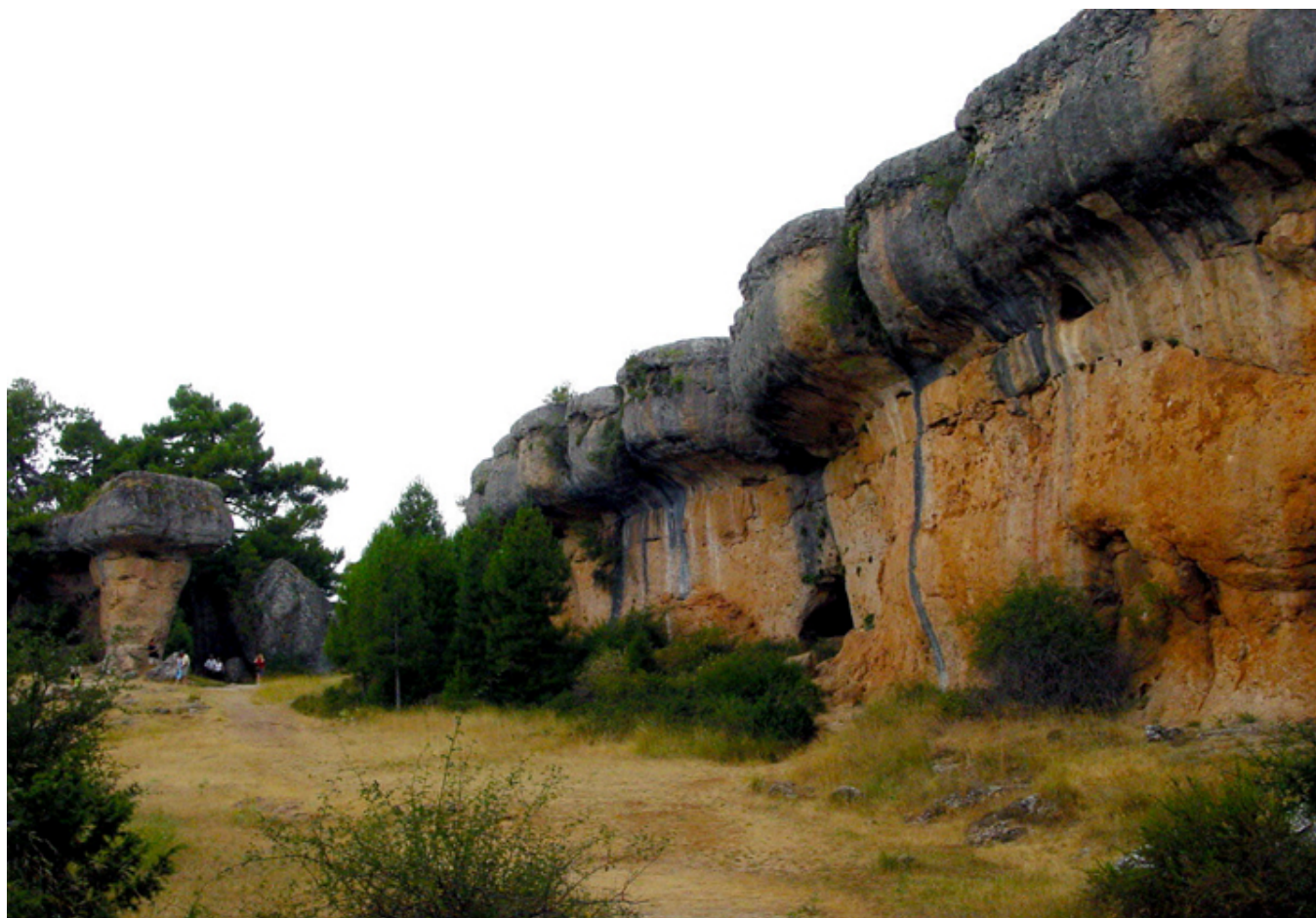
Ciudad Encantada czyli Zaczarowane Miasto Skalne