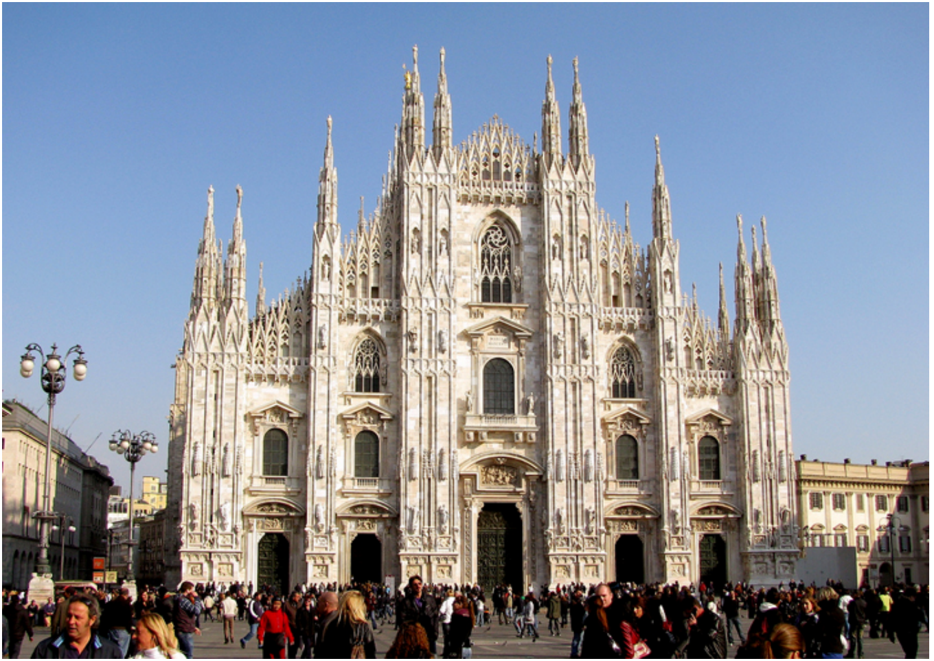
Mediolan. Fronton katedry.