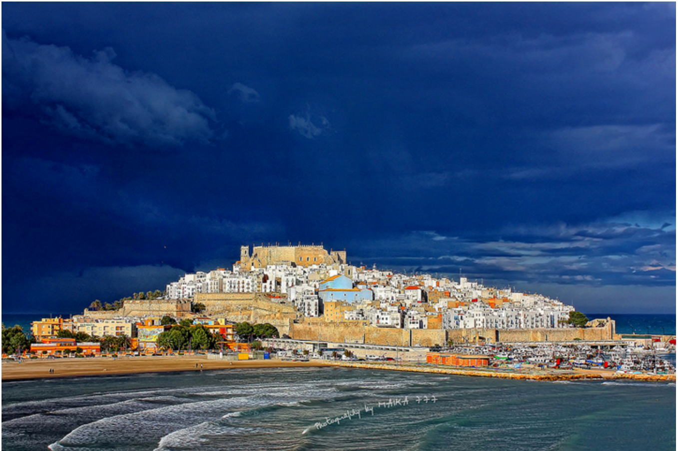
Peñíscola po burzy.

Z dalszych wypadów wymienię jeszcze miniaturkę Kadyksu, miasteczko Peñíscola , na wschodnim wybrzeżu, na północ od Walencji . Jak jego katalońska nazwa wskazuje, leży na skalistym wzniesieniu, połączonym ze stałym lądem bardzo wąskim przesmykiem. W zamku na samym szczycie rezydował Pedro de Luna, czyli antypapież Benedykt XIII, żyjący na przełomie XIV i XV wieku. Blżej Walencji , w Sagunto , zachwyił mnie teatr rzymski. Wyglądał wówczas pięknie, z kępami opuncji na pierwszym planie zachowywał swój dawny charakter. Niestety, w latach 80. i 90. XX wieku dwóch włoskich architektów dokonało całkowicie nieudanej rekonstrukcji, zacierając oryginalne ślady tego wspaniałego rzymskiego zabytku. Na południe od Alicante ,