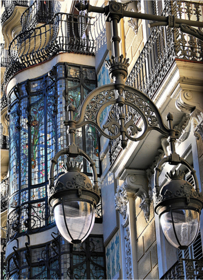
Barcelona. Architektura modernistyczna.