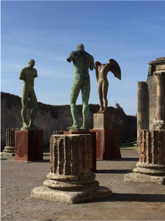
Wystawa prac Igora Mitoraja w Pompejach.