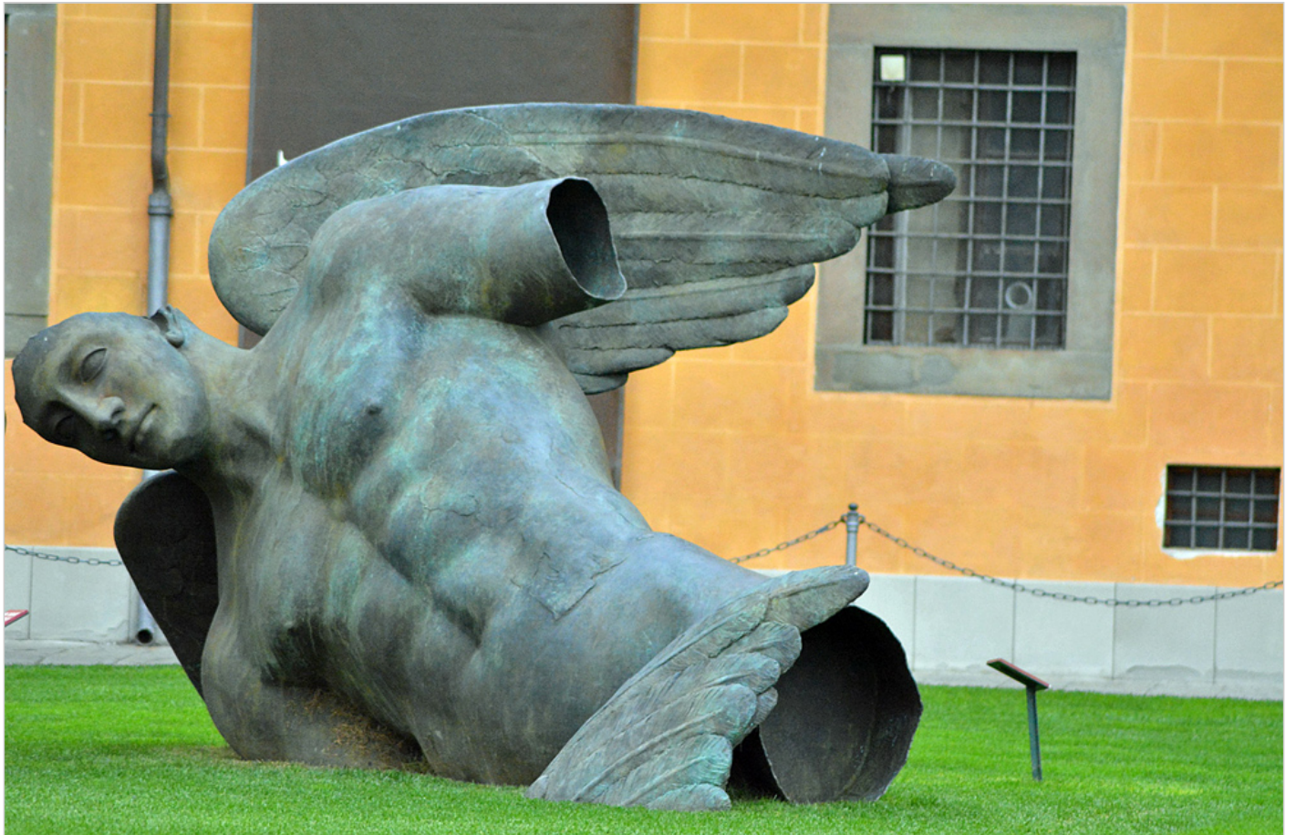
Igor Mitoraj, „Upadły Anioł” („Angelo Caduto”). Rzeźba usytuowana w pobliżu Krzywej Wieży w Pizie.