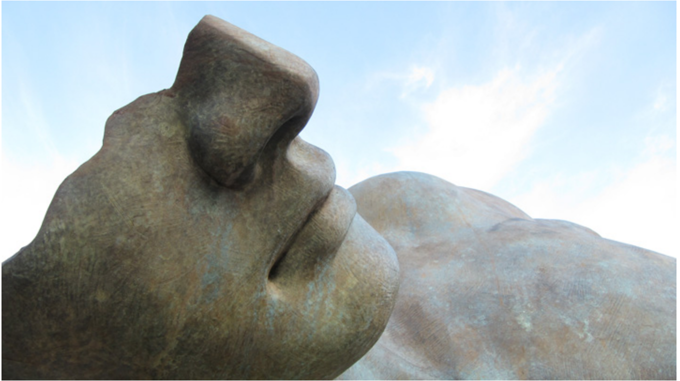
Igor Mitoraj, „Torso di Ikaro”, fot. Wikipedia.