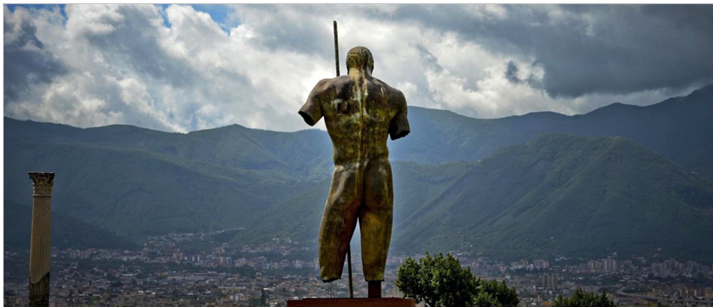
Rzeźba Igora Mitoraja „Dedal” w Pompejach

Antyk bowiem był jednym z głównych źródeł inspiracji artysty. Tworząc swoje rzeźby odwoływał się wprost do mitologii lub historii Grecji i Rzymu, niekiedy już w tytule samego dzieła: „ Ikar ”, „ Centauro ”, „ Eros ”, „ Mars ”, „ Gorgona ”, „ Paesaggio Ithaka ”. Jak zauważają krytycy sztuki, artysta przywołując piękno i idealne proporcje rzeźb klasycznych, jednocześnie je reinterpretował, współcześniał. Uzmysławiał odbiorcy niedoskonałość ludzkiej natury poprzez umyślne spękania i uszkodzenia powierzchni posągów.