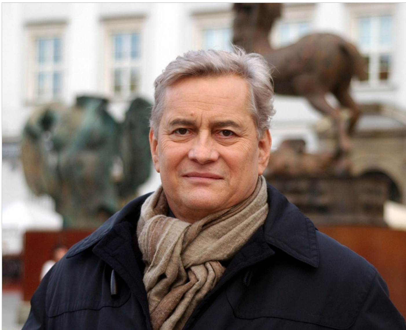
Igor Mitoraj

Artysta jest zaliczany do grona najwybitniejszych współczesnych rzeźbiarzy. Jego prace znajdują się w kilkudziesięciu muzeach, fundacjach i siedzibach największych korporacji na świecie.