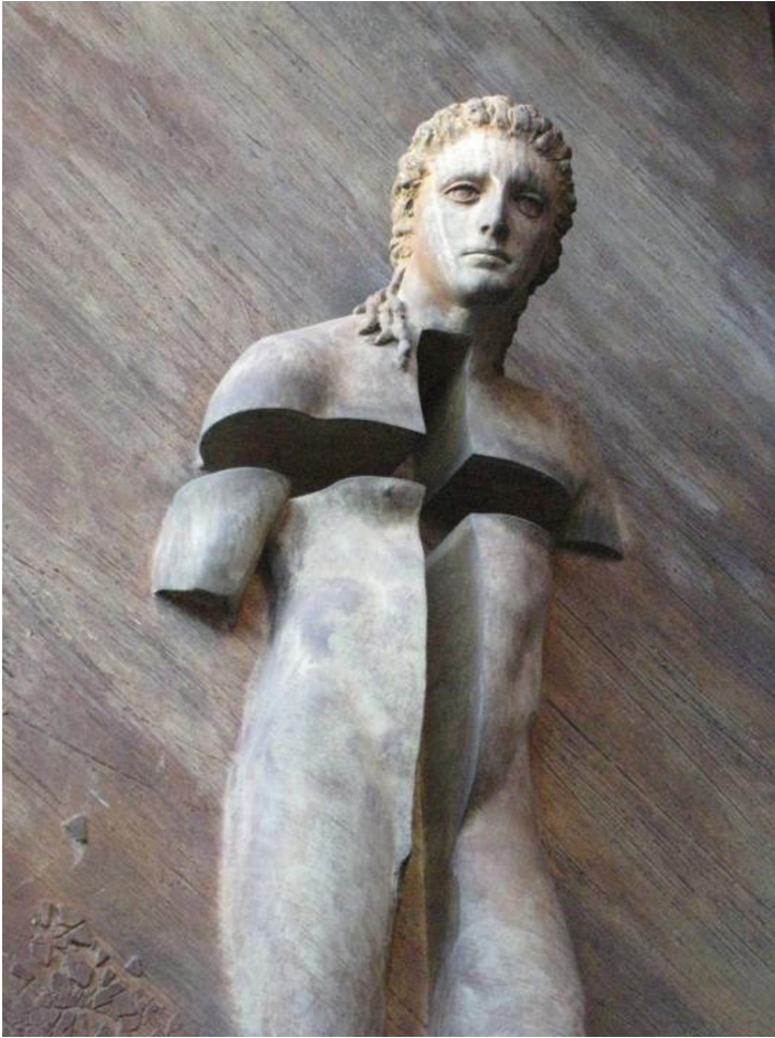
Rzeźba Igora Mitoraja w Rzymie, fot. Pinterest.