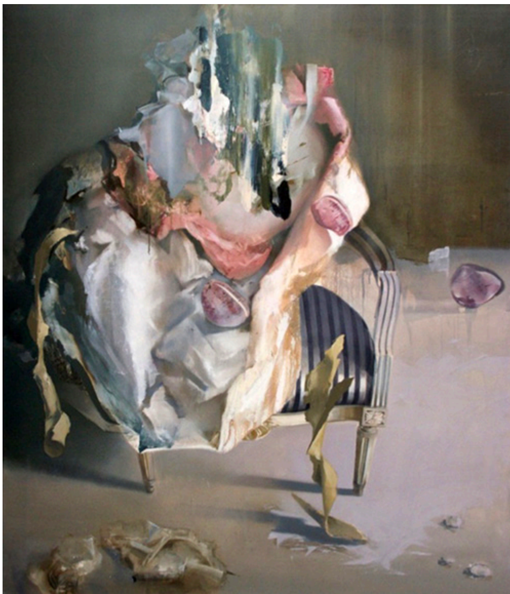
„Nuansy ziemi” z serii „Ospiti”, olej na płótnie, 2014 r.