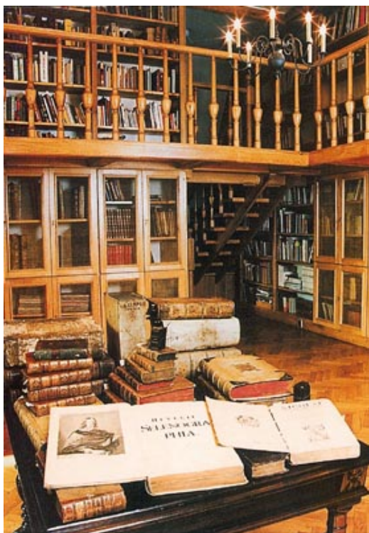
Biblioteka Muzeum Przypkowskich w Jędrzejowie.

duchownych. Był także księgą mądrości dla mieszczan i chłopów, ważnym źródłem wiedzy o świecie dla czytelników. Dla nas dzisiaj, po wiekach jest cennym komunikatem o rzeczywistości, którą opisywał i utrwał.