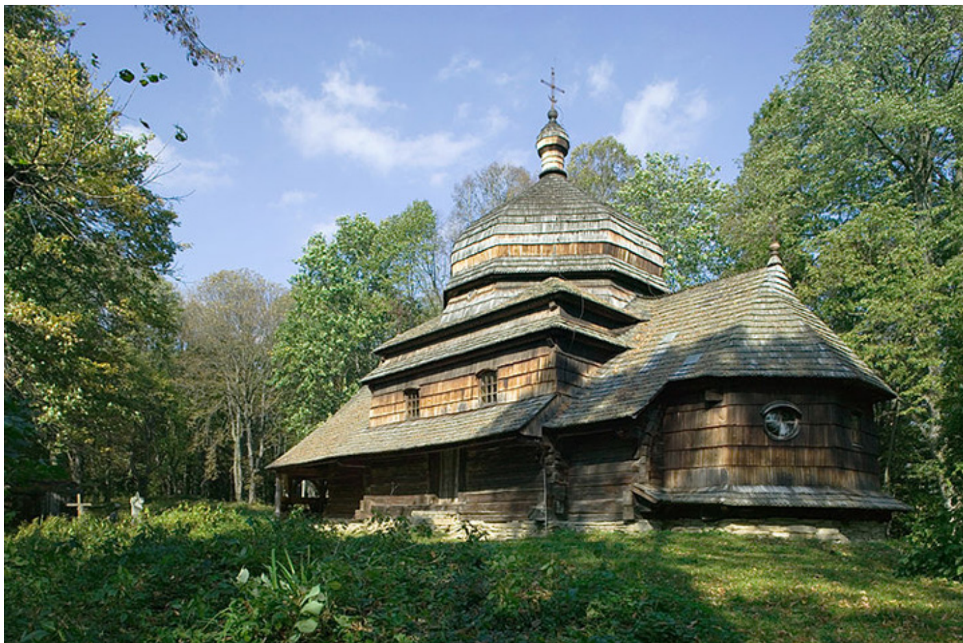
Ulucz. Cerkiew Wniebowstąpienia Pańskiego, 1659 r.

wówczas cerkiewek najpiękniejsza jest perła architektury cerkiewnej w Czerteżu, ogromna drewniana „bombonierka” kryta gontami, czyli cerkiew Przemienienia Pańskiego z XVII wieku. Wokół cerkwi niski dach, rodzaj sobót dla schronienia wiernych. Jedna wielka kopuła wieńczy tę wspaniałą budowlę.