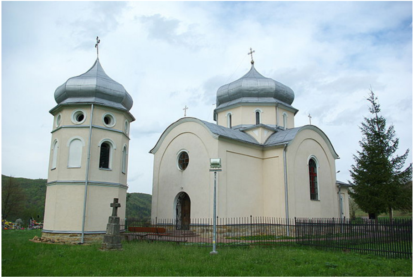
Międzybrodzie, Cerkiew Świętej Trójcy, 1901 r.