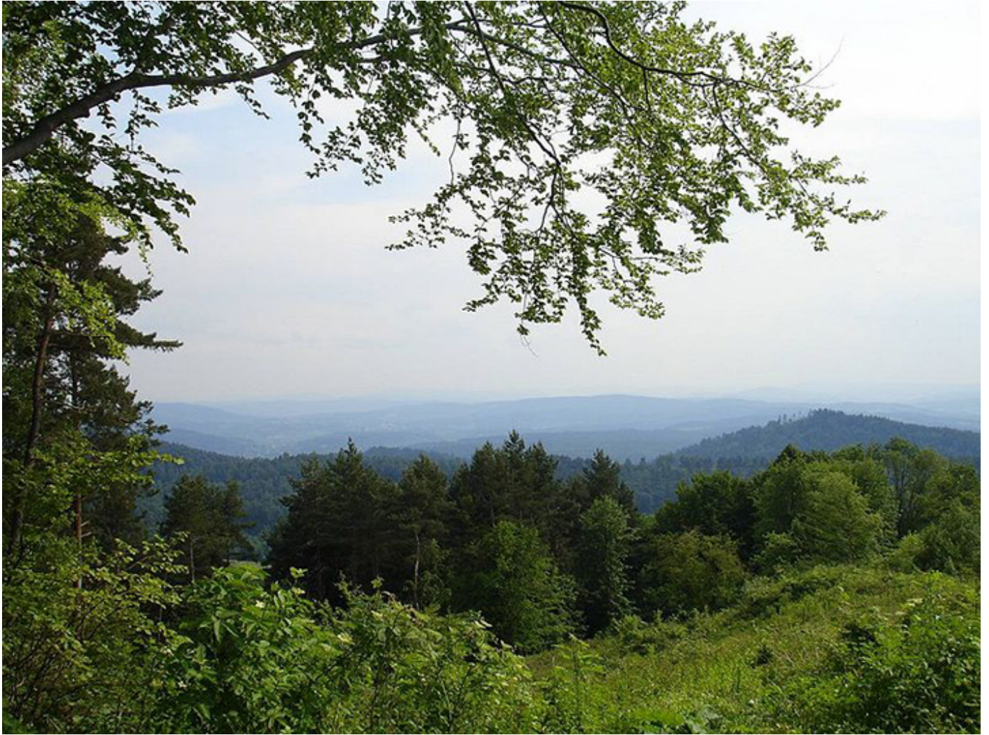
Góry Słonne