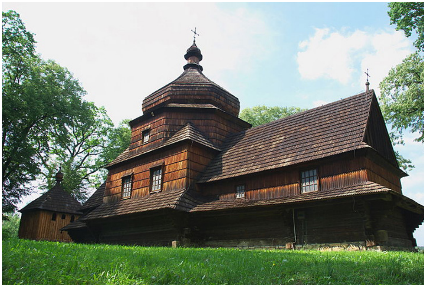
Zespół cerkwi Przemienienia Pańskiego w Czerteżu, XVII-XIX w., fot. Z. Wojski