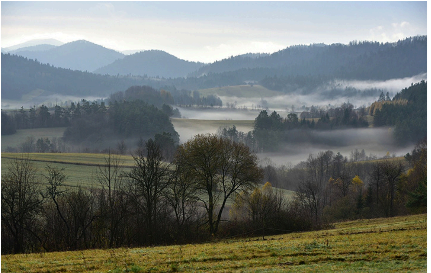
Góry Baligrodzkie