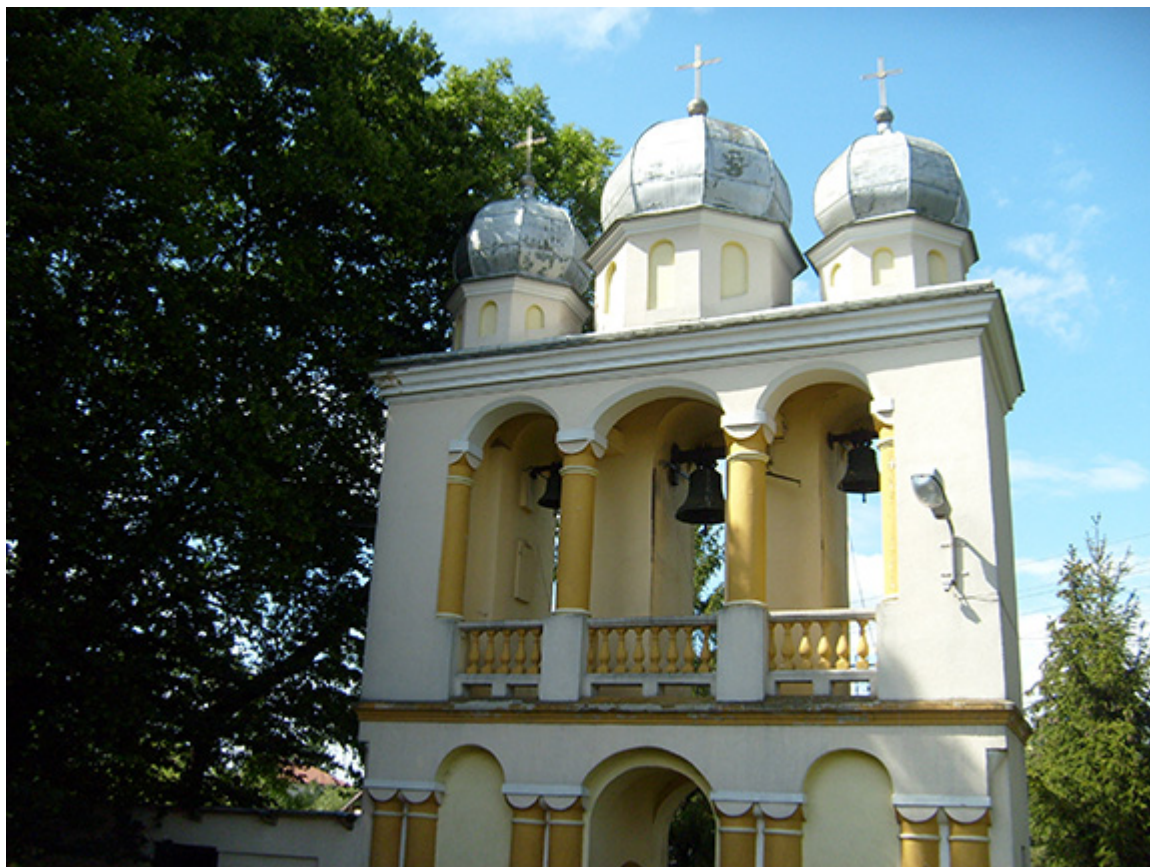
Dzwonnica cerkiewna w Jurowcach