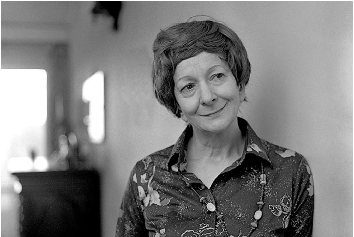
Wisława Szymborska, Kraków 1980 r.