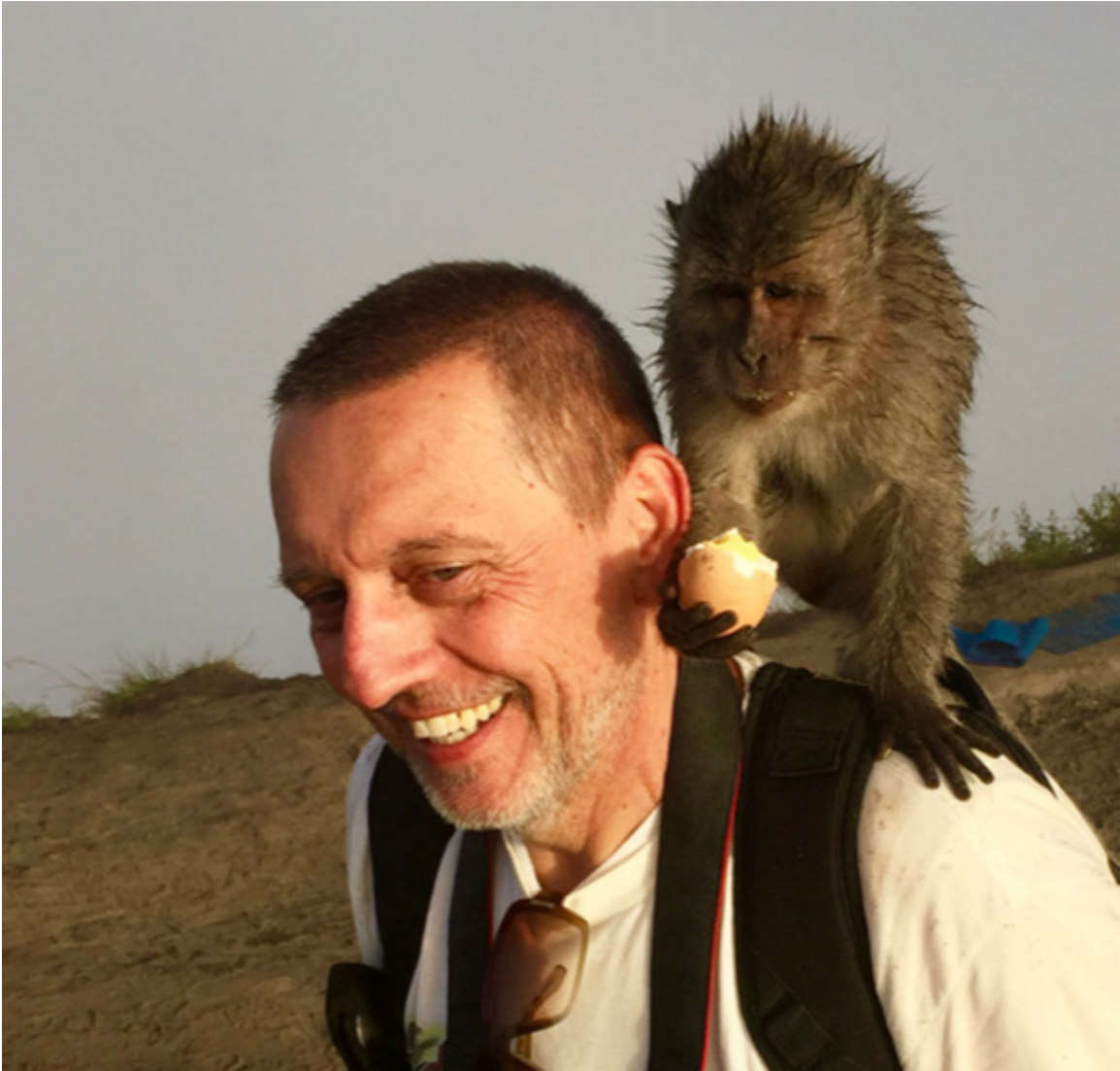
Sorry kuzyn - jestem uczulony na jajka.

Zapraszamy do lektury zaczynając od prologu autora do nie wydrukowanej (jeszcze) książki: