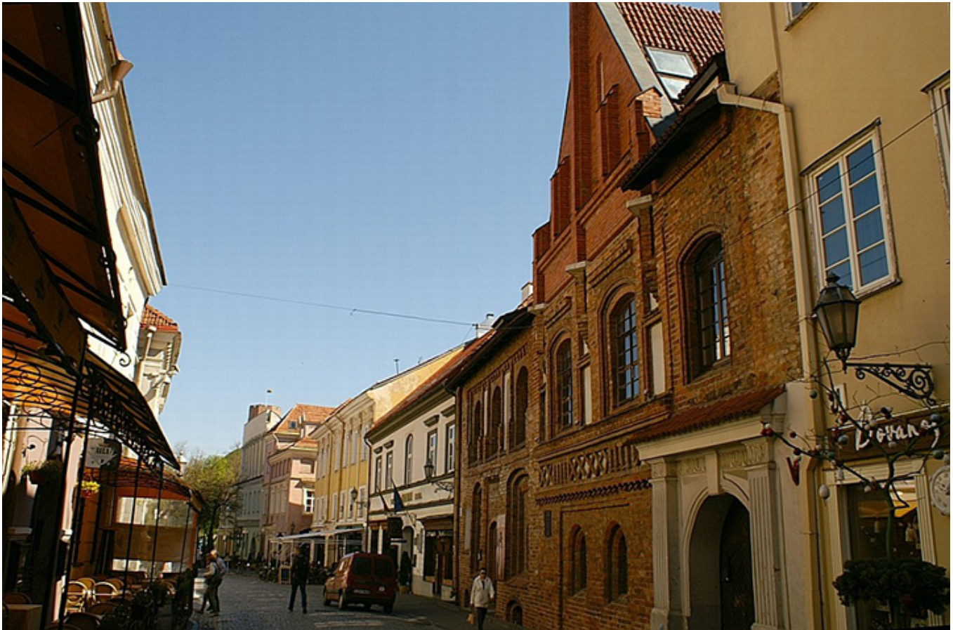
Wilno, ul. Zamkowa