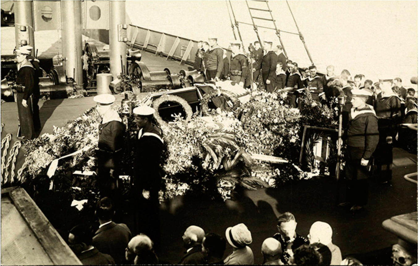
Sprowadzenie szczątków Juliusza Słowackiego do Polski, uroczyste przywitanie trumny w Gdyni, 1927 r.

O tych uroczystościach myślę z prawdziwym wzruszeniem. Wracam myślami do mojego ojca, który o nich opowiadał mi w okrutny czas okupacji. zabierając mnie wielokrotnie z Łagiszy, gdzie mieszkaliśmy, do Sosnowca. Oto bowiem w roku 1927 służył w wojsku polskim w Krakowie i brał udział w uroczystym pochodzie na wzgórze wawelskie. Jego wspomnienia i swojskie gawędy, żywe i barwne, pełniły funkcję swego rodzaju podręcznika historii w czasie, gdy polska książka była tępiona przez Niemców wszelkimi metodami. Tym domowym sposobem odbywało się patriotyczne wychowanie mojego pokolenia, tak kształtowała się legenda romantyczna, dzięki której łatwiej było przetrwać narodowe niedole i zachować poczucie własnej