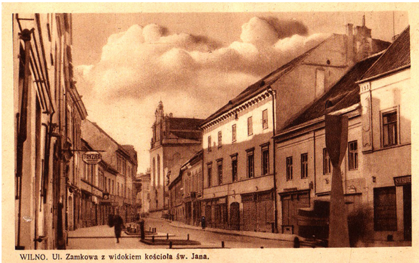
Wilno, ul Zamkowa. Dawna pocztówka.