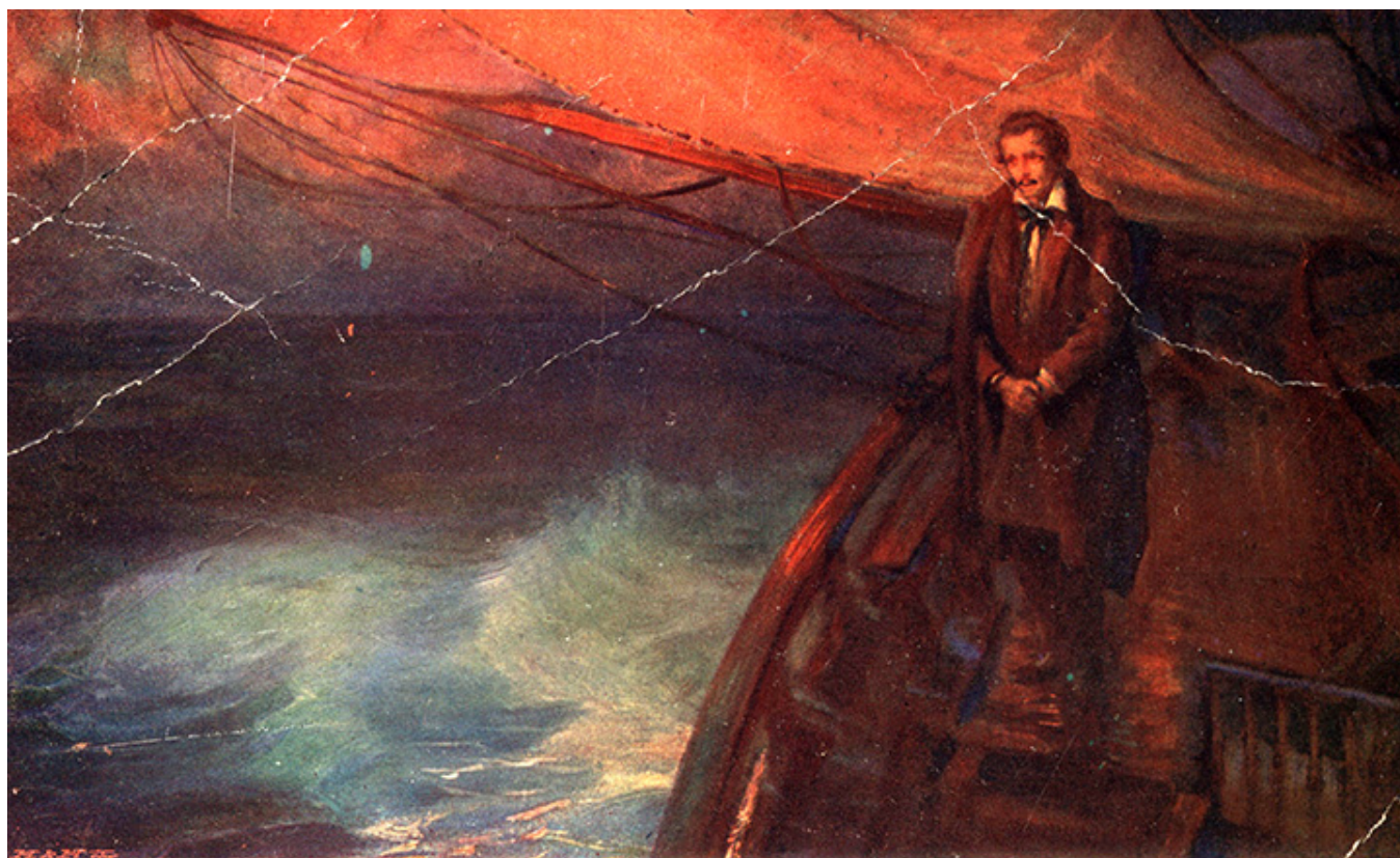
Pocztówka z wizerunkiem Juliusza Słowackiego, ilustracja do wiersza „Smutno mi Boże”