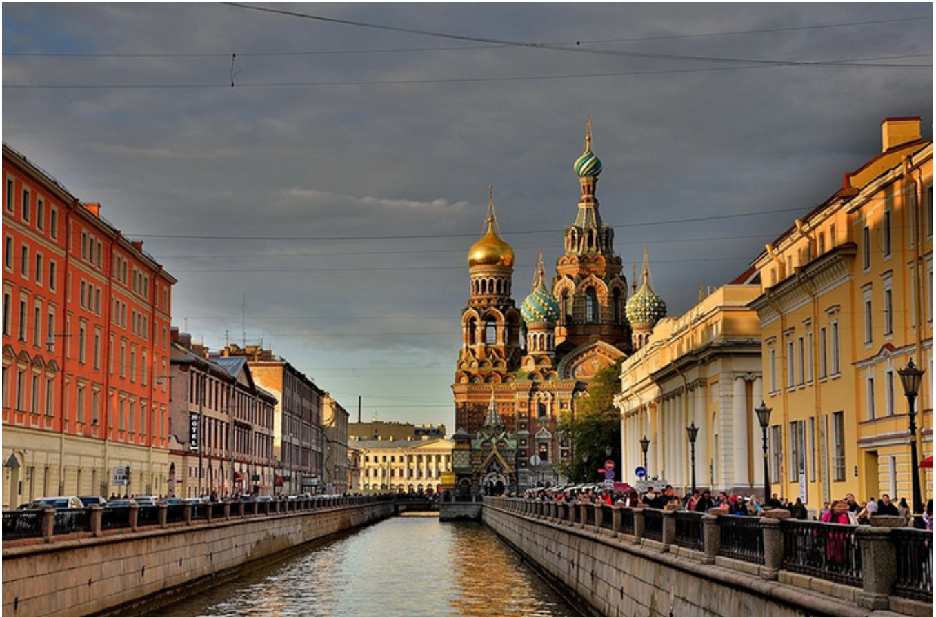
Petersburg, miasto nad Newą

Każdy z nich mógłby na pewno powtórzyć za wielkim malarzem Aleksandrem Orłowskim, członkiem Akademii Petersburskiej: „Kocham Polskę i Polaków”.