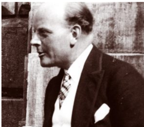
Alfred Antoni Wilhelm Roman Bazyli Potocki, ostatni (IV) ordynat Łańcuta

Przyjmując ich i robiąc z Łańcuta miejsce spotkań dla dyplomatów i wybitnych gości z zagranicy, byłem pewien słuszności swych usług dla swojego kraju.