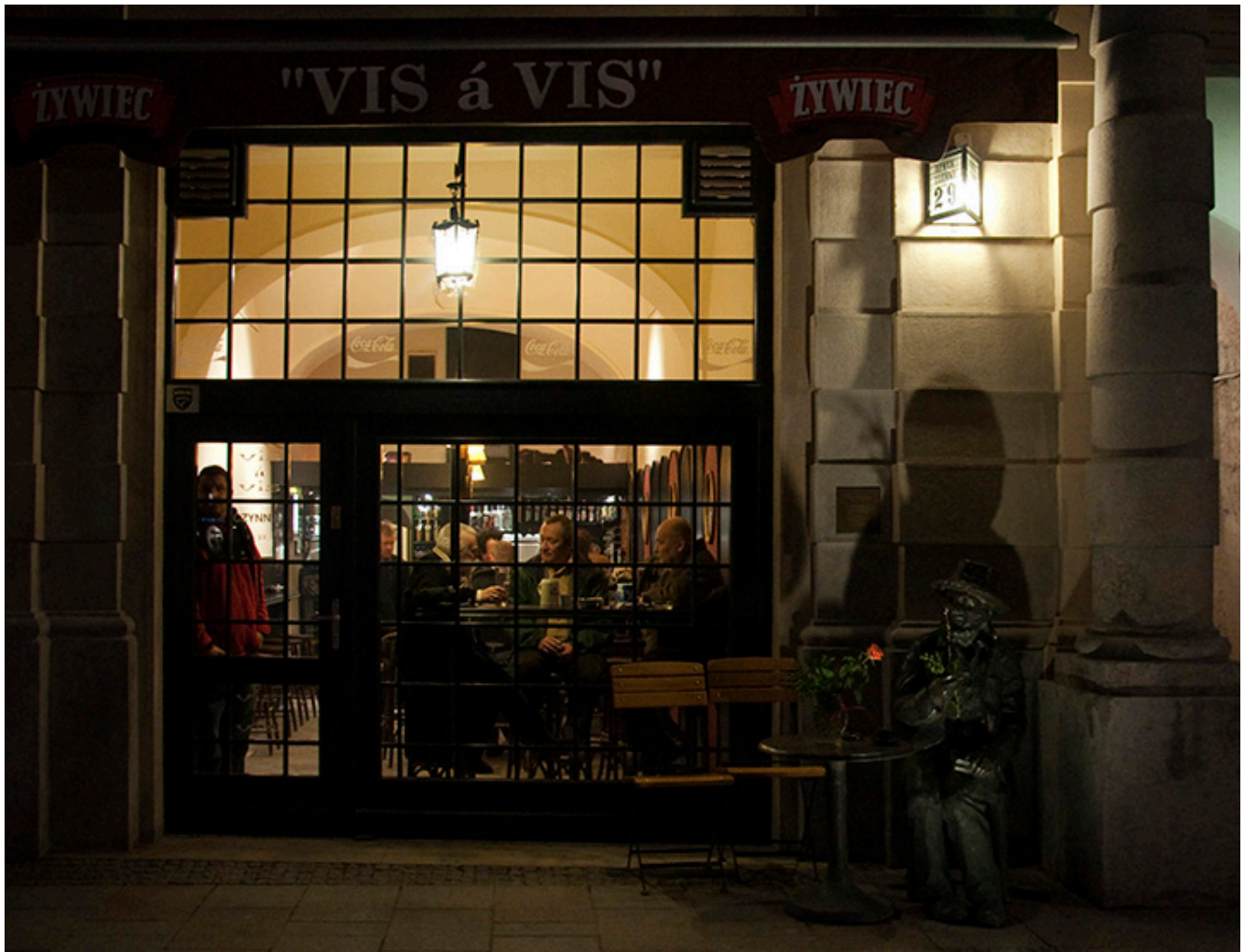
Kawiarnia „Vis a Vis”

W Krakowie bywa się w knajpach i to najlepiej kultowych. Knajpa to dość nieostre określenie. Raczej trzeba to poczuć niż zrozumieć. „Zwis” jest knajpą. Kawiarnia „Grandu” knajpą nie jest. Knajpami nie są restauracje i lokale hotelowe. Knajpy w Krakowie są od siebie odległe „o rzut beretką”, albo jeszcze bliżej. Poza tym nie każda knajpa jest kultowa. Ze „Zwisu” można „rzucić beretką” na Sławkowską 4 do „Free Pubu”. Adres trzeba znać, bo „Free” to jedno z licznych miejsc w Krakowie, które nie ma żadnego szyldu. Taki sygnał, że trzeba wiedzieć, gdzie trzeba bywać. W tej klasie „Free Pub” był chyba pierwszy. Jej