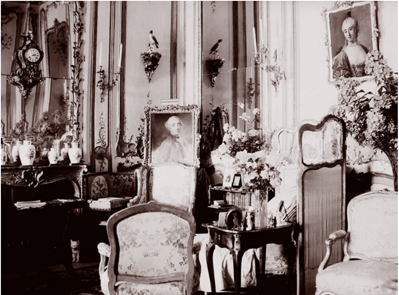
Wnętrze zamku w Łańcut, 1937 r., fot. Narodowe Archiwum Cyfrowe

Polowania, muzyka i taniec stały się tradycyjną częścią sposobu życia.