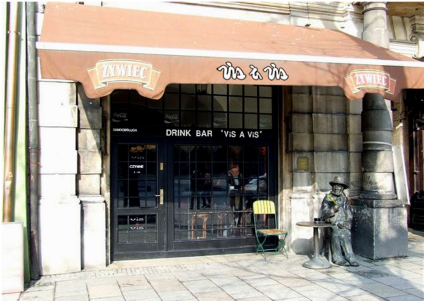
Kawiarnia „Vis a Vis”