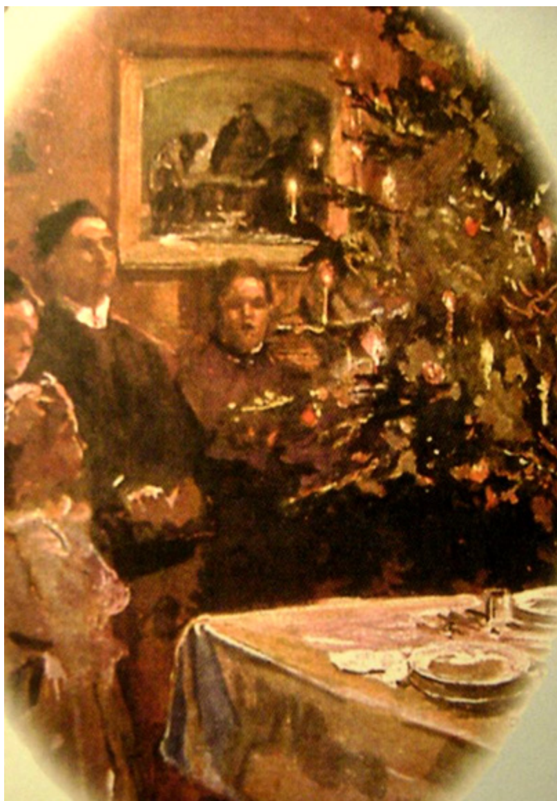
Polska Wigilia, XIX w.

Pamiętamy o barszczu z uszkami, zupie grzybowej albo z suszonych owoców, karpia, czasem kutii, pieczemy pierniki... Menu wigilijnej wieczerzy to swoisty relikw, pozostałość dawnej,