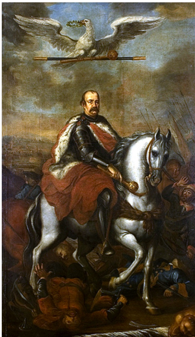
Alegoryczny portret Jerzego Sebastiana Lubomirskiego, ojca panny młodej, autor nieznan

czterech. Z osobna pasztetników sześć, cukierników czterech Francuzów, którzy na miejscu w Łańcucie cukry robili.