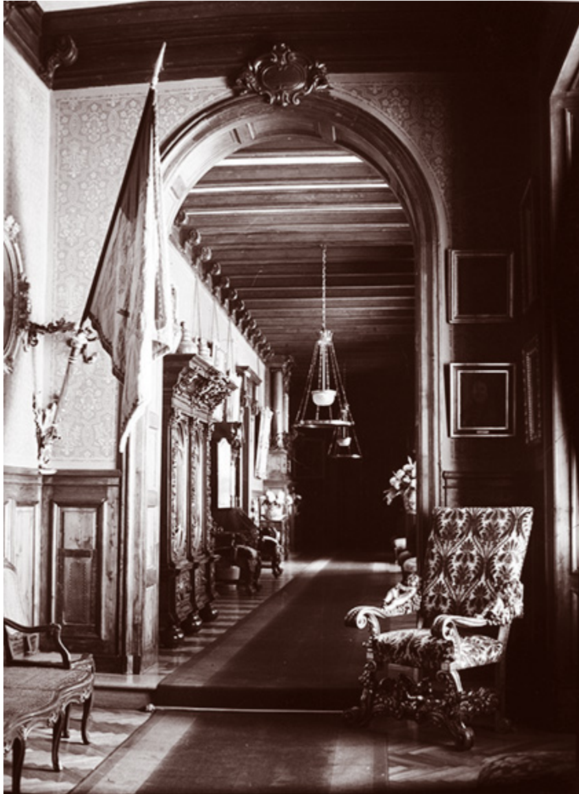
Wnętrze zamku w Łańcucie, 1937 r.