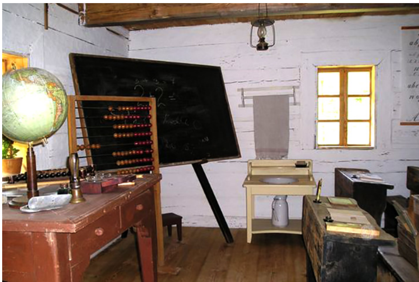
Tak wyglądały kiedyś klasy w szkołach, z tablicą, liczydłem, globusem i ławkami z otworami na kałamarze. Na zdjęciu zrekonstruowana klasa w Szkole Podstawowej w Pakosławiu