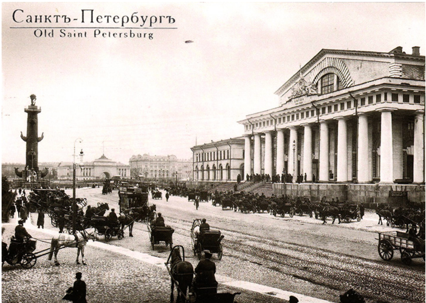
Petersburg na dawnej pocztówce

- Pan jest Polakiem? - zapytał się pewnego razu dyrektora Ermitażu Michała Piotrowskiego Adam Michnik. - Mój dziadek był katolikiem - odpowiedział Michnikowi pan dyrektor. Jak widzimy i dzisiaj to co dotyczy "polskiego Petersburga" powtarza się tak samo, jak i za czasów ostatniego imperium.