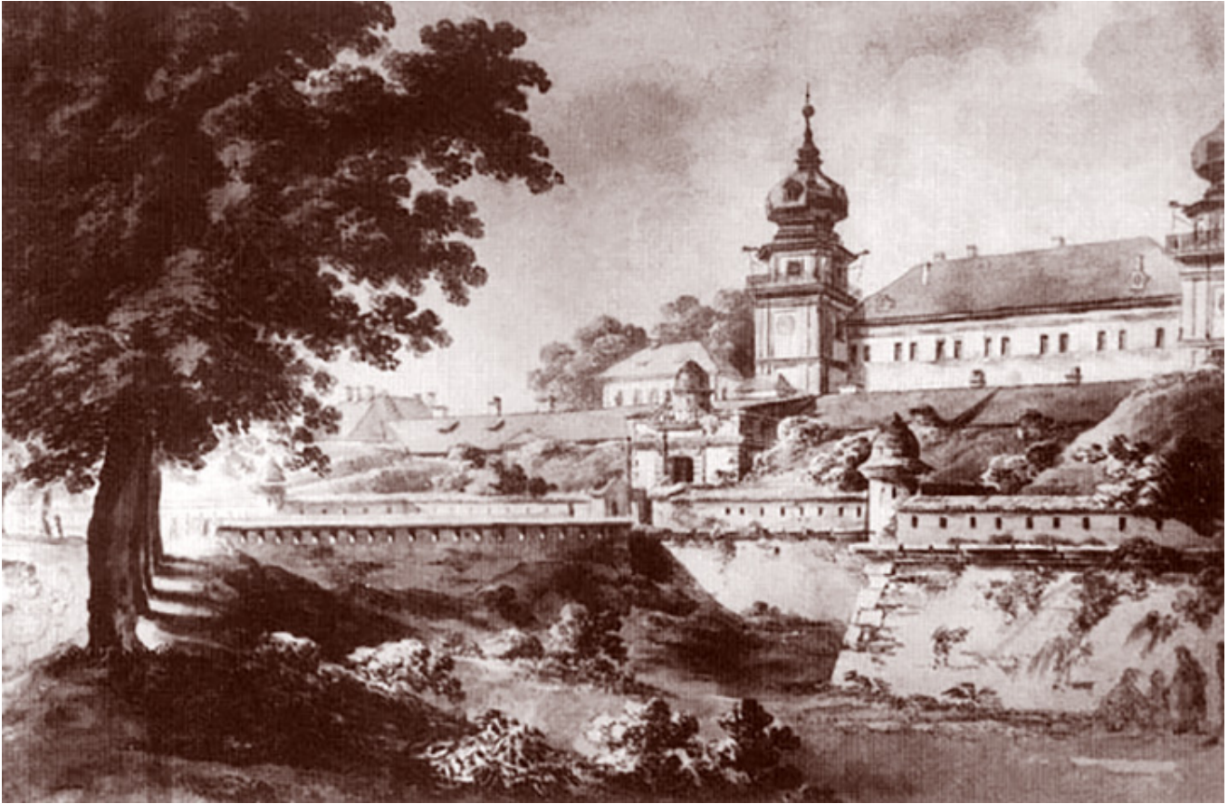
Widok od zachodu. Akwarela Thomasa de Thomona z końca XVIII w., fot. E. Baniukiewicz, Z. Wiśniowska, Zamek w Łańcucie, Arkady, Warszawa, 1980