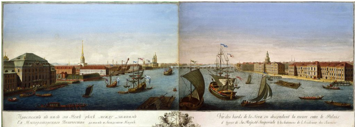
Grawiura: St. Petersburg i Newa 1753. Valeriani Joseph i Machaew Michaił Iwanowicz, fot. wikipedia

W 1583 roku Szwedzi ponownie próbowali zawładnąć ujściem rzeki Newy i wznieść nową fortecę, lecz bezskutecznie. Rosjanie trzymali w rękach tę miejscowość aż do nastąpienia tzw. „smutnego wremienia”, kiedy to Szwedom udało się założyć w ujściu rzeki Ohta miasto Nien, a na przeciwległym brzegu – twierdzę Nienszanc. 1 maja 1703 roku Rosjanie opanowali tę twierdzę, a 6 maja Piotr I odniósł zwycięstwo nad Szwedami koło obecnego Jekatierinhofa, biorąc jako trofea dwa wojskowe statki. To było pierwsze morskie zwycięstwo Rosjan. Piotr I kazał upamiętnić to wydarzenie medalem z napisem „niebywajemoje bywajet” i był tak pewien tego, że jest niezwyciężony, że 29 czerwca nad brzegiem Newy założył miasto, które nazwał Sankt-Petersburgiem. Będąc wielkim reformatorem postanowił połączyć w tym mieście Rosję z Europą, Wschód z Zachodem, Europę z Azją. Niestety sojusz ten nie dał oczekiwanych rezultatów, oprócz rozwoju cywilizacji, który ujawnił się tylko i wyłącznie w zewnętrznych stronach życia i w przeobrażeniu Rosji w „śpiącą piękność”. Pozostał bardzo duży kontrast