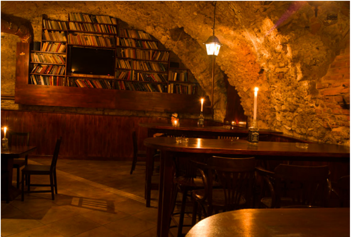
„Free Pub”, Kraków, fot. „Free Pub”.