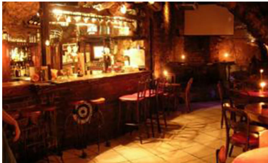
„Miasto Krakoff”, Kraków

Krakowie nikt nie powie inaczej niż Plac Żydowski. Jeżeli to dzień powszedni, to na tym ciągle czynnym placu targowym można, w towarzystwie przekupek i pod gołym niebem, zjeść najsmakowniejsze w mieście flaki. Szukać ich należy w poaustrijackim „okrągłaku” na środku targowiska. Na rogu Estery (legendarnej kochanki Kazimierza Wielkiego) pub „Singer”, pierwszy kultowy na Kazimierzu. Jak zwykle, kto nie wie gdzie, ten nie znajdzie. Nazwa w sam raz, bo za stoliki służą maszyny do szycia marki Singer. Oprócz tego w ostatniej salce przez pewien czas stało łóżko!? Do niedawna było to ulubione miejsce studentów Szkoły Teatralnej, pomimo tego, że szkoła i akademik są raczej z drugiej strony miasta. Kto zostanie tu do rana usłyszy rzadkie już w milionowym mieście odgłosy budzącego się do życia targu. (W niedzielne przedpołudnie to największy dom towarowy pod chmurką z używanymi ciuchami).