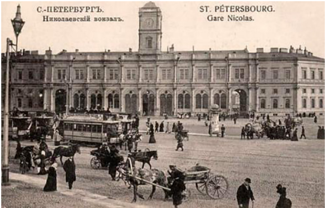
Petersburg na dawnej pocztówce

Nowe polskie nazwiska przez ostatnie 25 lat nie pojawiły się: ulicy Mickiewicza nadal nie ma, zresztą ulicy Mandelsztama tak samo. Pojawiło się popiersie Mickiewicza, jeszcze w 2007 roku koło jedynej w Rosji polskiej szkoły w Grafskim zaułku, która niestety od niedawna przestała być polska. Co jeszcze? Jak się okazało, współcześni polscy architekci bezwiednie biorą udział w obecnym budownictwie tutaj w Petersburgu, lub w jego okolicach, czego się nie afiszuje, ale na przykład nowy gmach lotniska "Pułkowo" bardzo przypomina lotnisko Fryderyka Chopina w Warszawie.