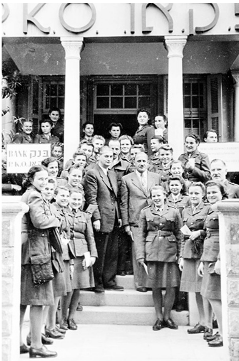
Uczennice Gimnazjum Kupieckiego witane przez dyrektora oddziału banku PKO (Pocztowa Kasa Oszczędności) w Tel Awiwie. Hebrajski napis świadczy, że bank służył przedwojennym polskim emigrantom żydowskiego pochodzenia.

lub bardziej rozbudowane informacje o szkołach junaków i młodszych ochotniczek podawali autorzy monografii Polskich Sił Zbrojnych na Zachodzie, a przykładem może być tom Piotra Żaronia: Armia Andersa (Toruń 2000). Materiał o szkołach junackich w Nazarecie i Barbarze zawiera także album Tułacze dzieci (Warszawa 1995).