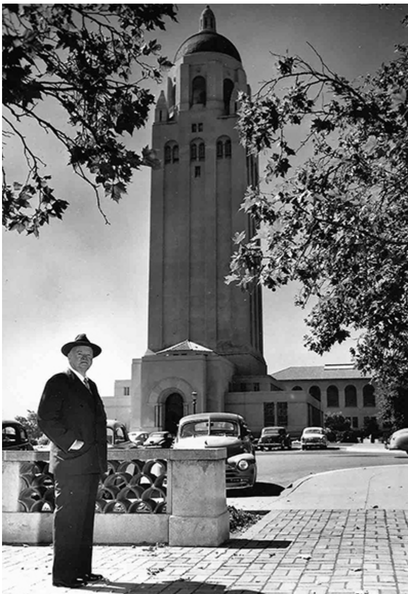
Prezydent Herbert Hoover przed Instytutem swojego imienia, Stanford, 1950.