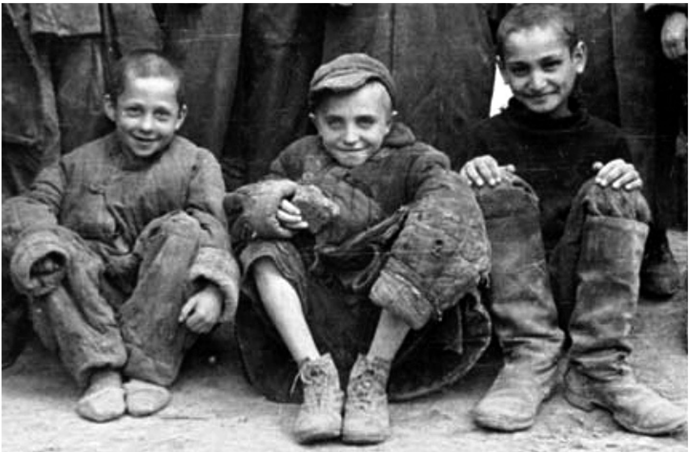
Szczęśliwi, już prawie junacy.

Generał podziękował „kochanym Dzieciom” za „tak bardzo drogą” dla niego pamięć i za listy. Ciekawe są opisy obozów letnich młodszych ochotniczek urządzonych w 1945 r. w Atlicie koło Hajfy, Barbarze, Jerozolimie, Nazarecie i w Ośrodku Uzdrawieńczym w Tyberiadzie (turnusy lecznicze). Stacja Uzdrawieńcza dla uczniów powstała w lutym 1943 r., posiłki wydawano tu pięć razy dziennie, przeprowadzano badania lekarskie, obowiązkowe było leżakowanie, wyjeżdżano na kąpiele zdrowotne siarczane i solankowe. Wychowawcy zapoznawali młodzież z dziejami Ziemi Świętej, prowadzili zajęcia z geografii i historii Polski. Każdy kolejny turnus prezentował przedstawienia teatralne, podtrzymywano więź z osobami duchownymi z