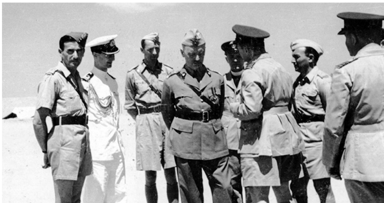
Gen. Władysław Sikorski z wizytą w Heliopolis, w maju 1943, zaledwie na dwa miesiące przed tragiczną katastrofą w Gibraltarze.