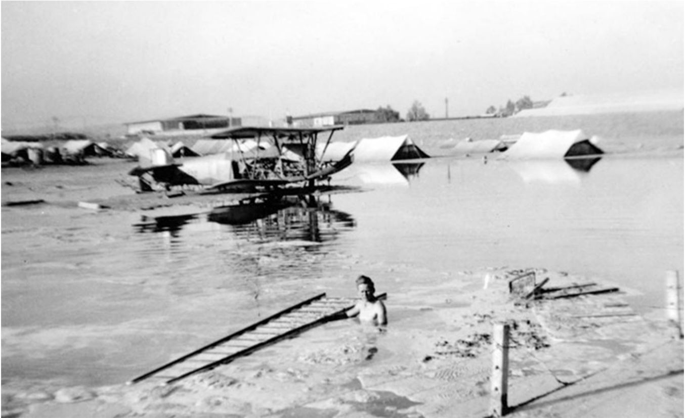
Niespodziewany wylew Nilu zatopił obóz w Heliopolis. Ucierpiały namioty sypialne, ale uratował się dwupłatówiec.