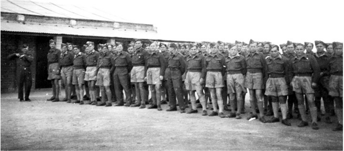
Pierwsze miesiące gimnazjum w Heliopolis, jeszcze w mundurach junackich. Obok w murowanym budynku znajdowały się klasy szkolne. Marzec 1943.