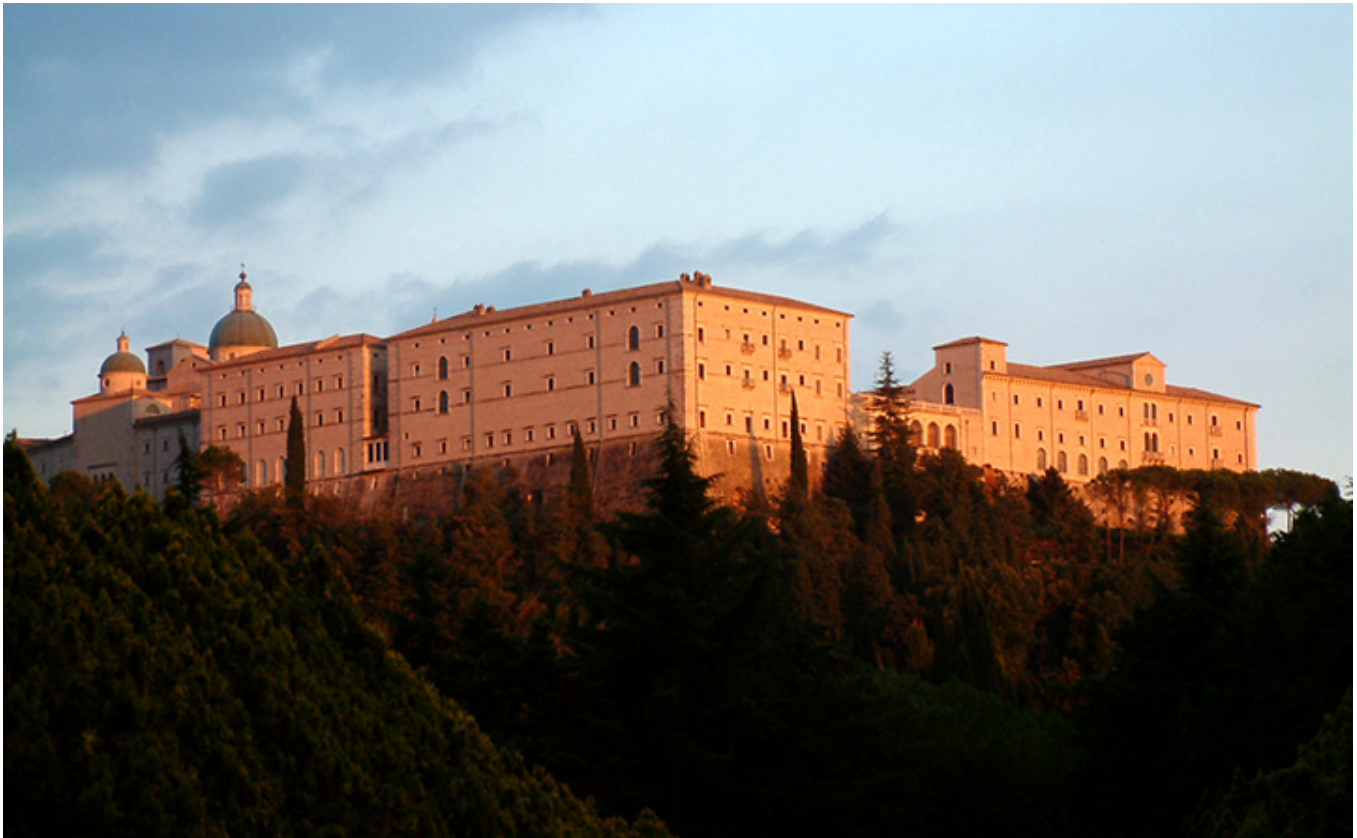
Monte Cassino, fot. wikipedia.