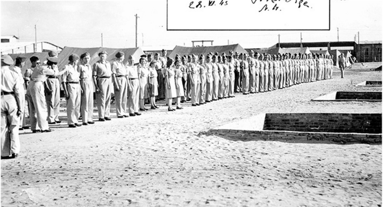
Wpis gen. W. Sikorskiego do kroniki młodych lotników.