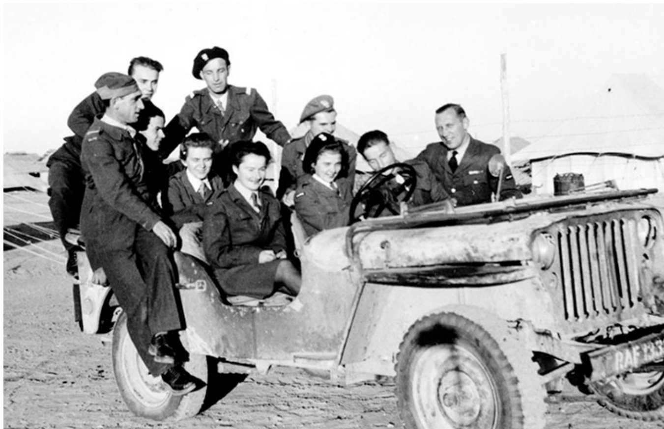
Wizyta zespołu teatralno-kabaretowego w Heliopolis.

W trakcie prac redakcyjnych postanowiliśmy pozostawić niektóre terminy utrwalone w środowiskach emigracyjnych (przykładem kampania wrześniowa 1939 r.), jak najmniej ingerować w styl narracji autora, w pierwotny układ książki.