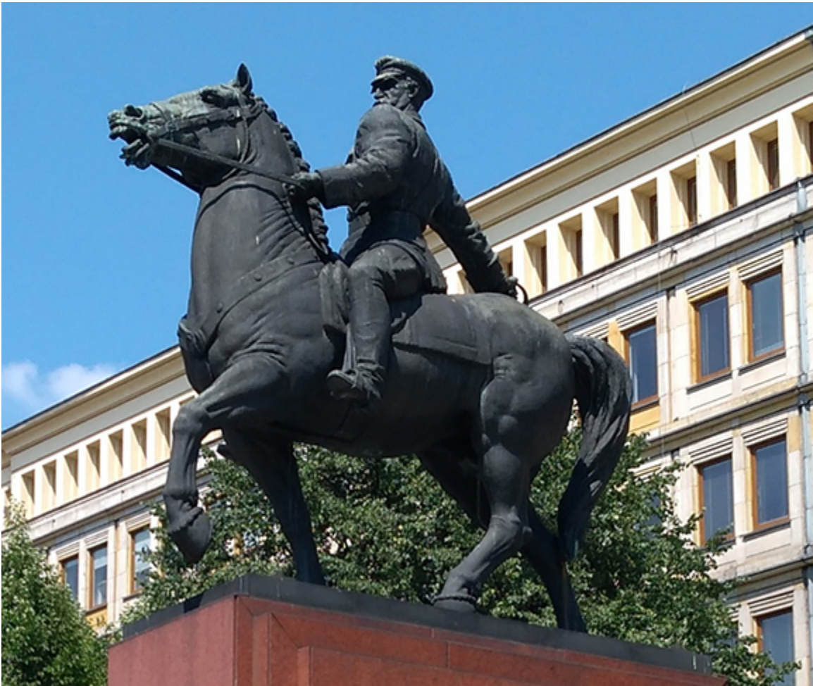
Pomnik Józefa Piłsudskiego w Katowicach.