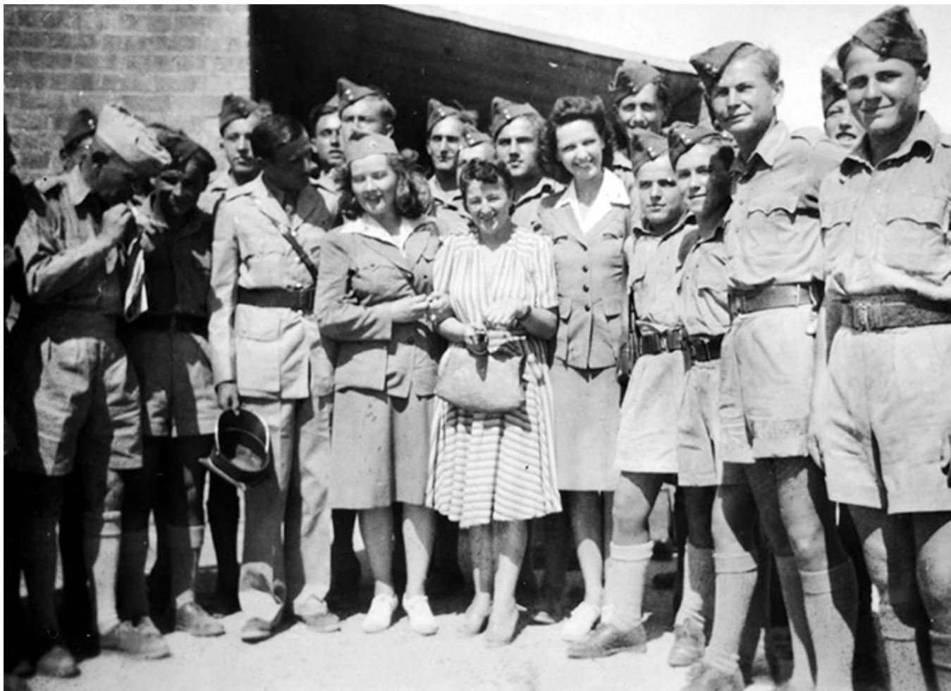
Pamiętna wizyta: Polki z Amerykańskiego Czerwonego Krzyża przyjechały z darami dla młodzieży, przywoząc ręczniki, skarpetki i słodycze. Heliopolis, kwiecień 1944.

1939-1950 (red. J. Wróbel, J. Żelazko, Warszawa 2008).